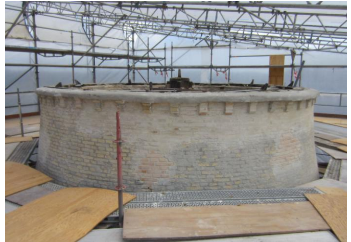
Færdig - klar til pudsning /klar til maling