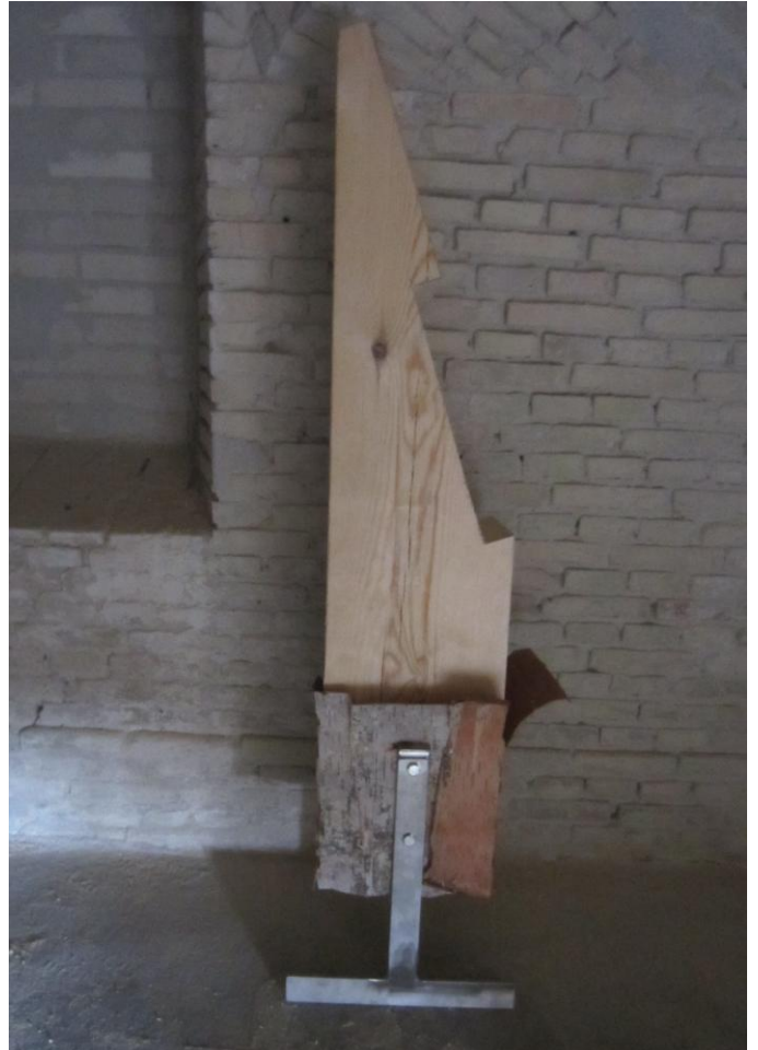
Her står en fransk lus – klar til at blive skubbet gennem hullet udefra . For herefter at blive låst med to kiler – én fra hver side.