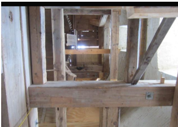
Et kig op gennem møllen