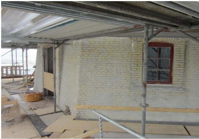
Undermøllen øverst - Kværnloftet