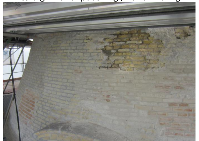
Næsten Færdig - klar til pudsning /klar til maling