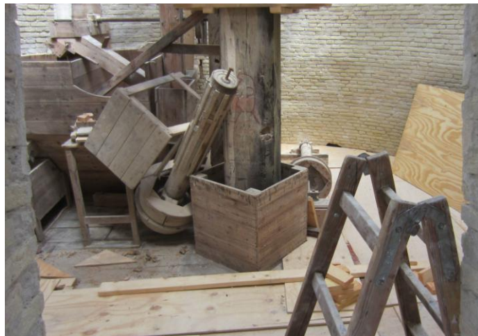
Et kig på ind på Lorrisloftet/ Hejseloftet