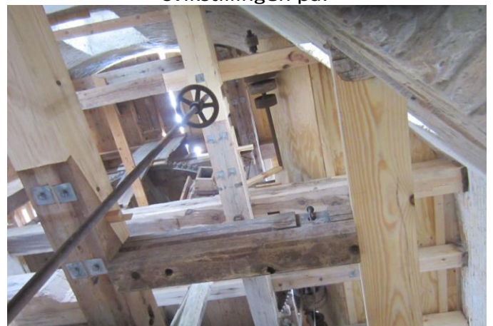
Meget gulv mangler – så der er kig op Her fra kværnloft op på Stjernhjulsløft