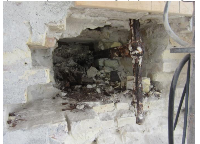
Her skal den rustne jernbinding og blækkende udskiftes