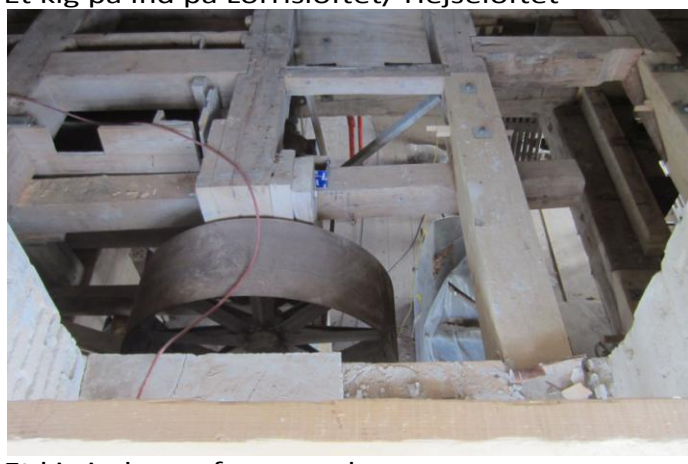
Et kig ind oppefra og ned