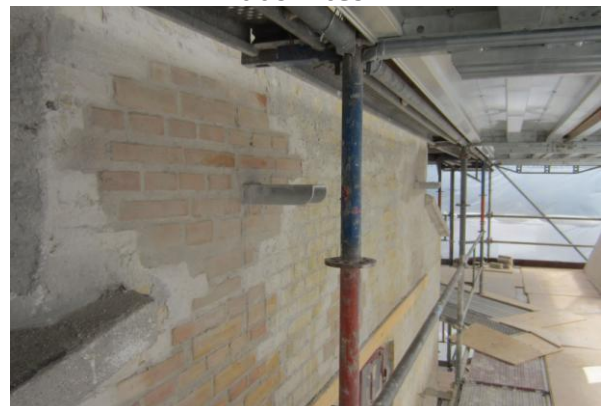
Her ses nye jern til at sætte støttestolperne til svikstillingen på.