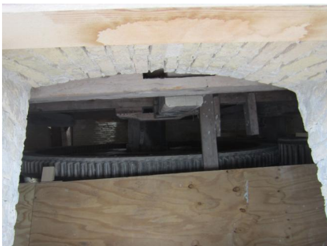
Et kig ind udefra på Stjernhjulet