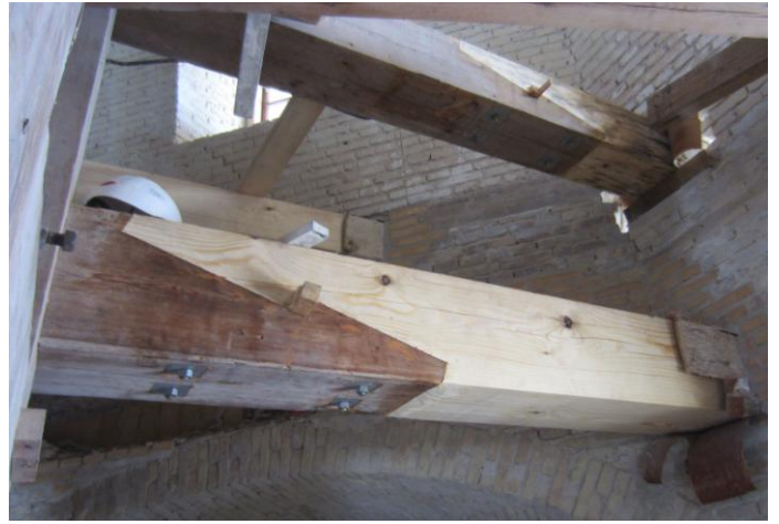
En færdig fransk lus / samling