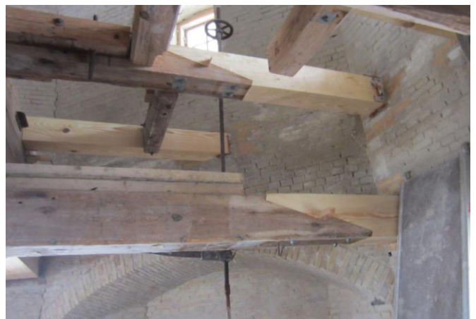
Et kig op fra Broloftet