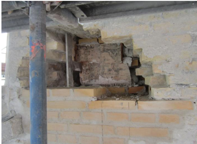
Her er én med Birkebark omkring – klar til indmuring