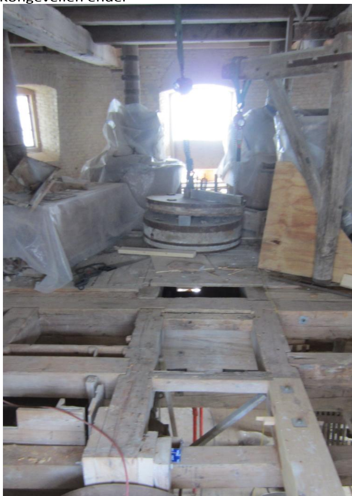
På Kværnloftet er dele af gulvet er fjernet for at kunne udbedre det bærende tømmer.