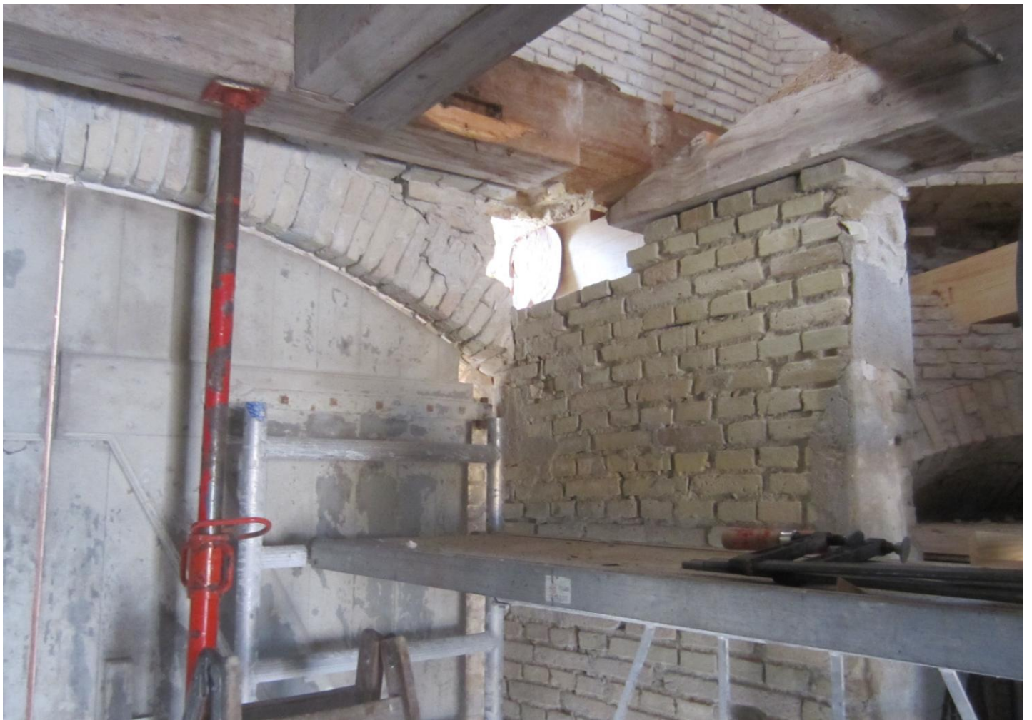
Helt nede i Portrummet er nu gået i gang med udbedring af murskader og udskiftning af bjælker