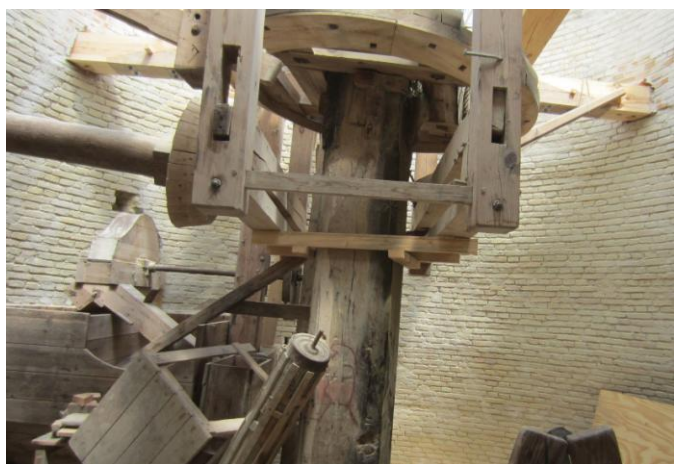
Kværnloftet hvor Kongevellen ender