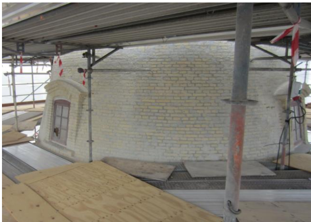
Næste loft - Lorrisloftet/ Hejseloftet