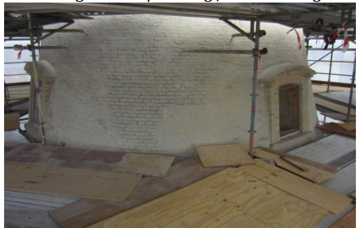
Færdig - klar til pudsning /klar til maling