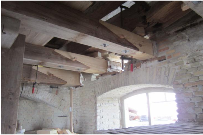
Vi er på Broloftet og ser op mod kværnloftet