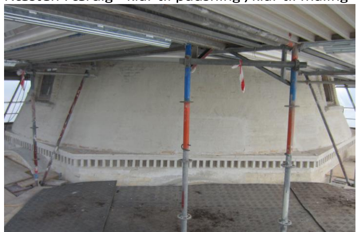
Færdig - klar til pudsning /klar til maling