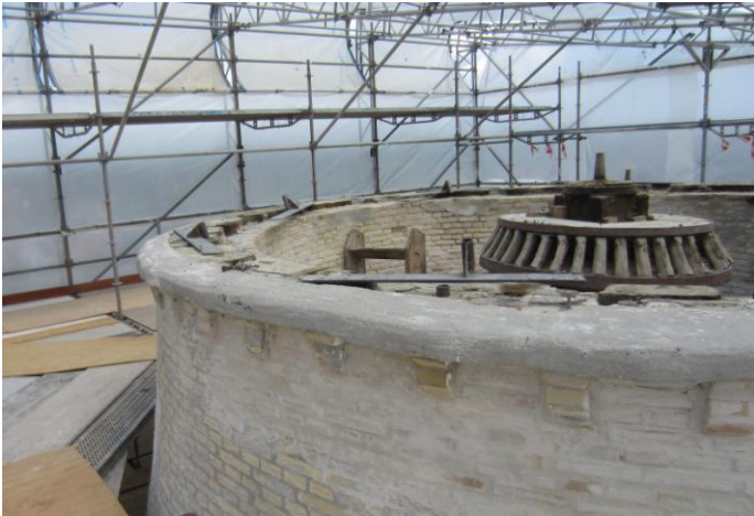
Med start udefra /oppefra - her hatloftet