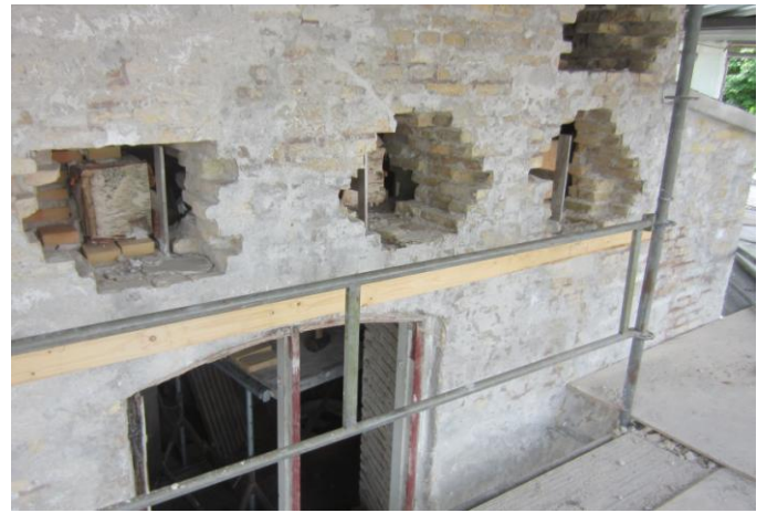
Her arbejdes i undermøllen med udskiftning af Bjælker v.hj. "franske lus" og nye jernbindinger