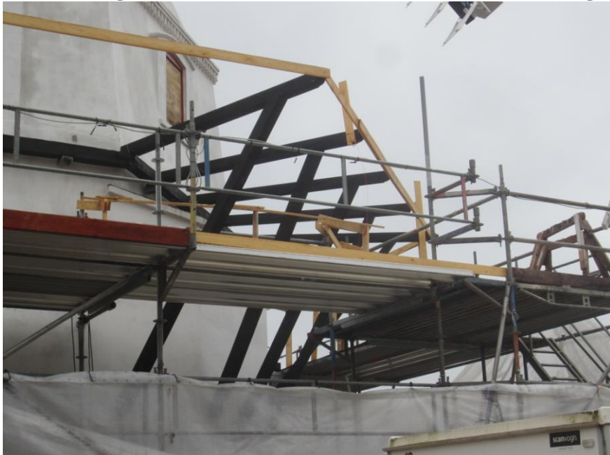
Et bræt yderst , så de låses fast inden der kommer brædder på