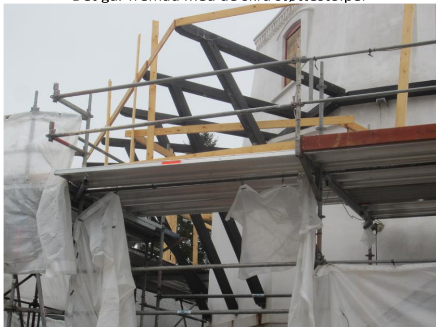
Holdet har også fået etableret rækværk - så der ikke sker noget.