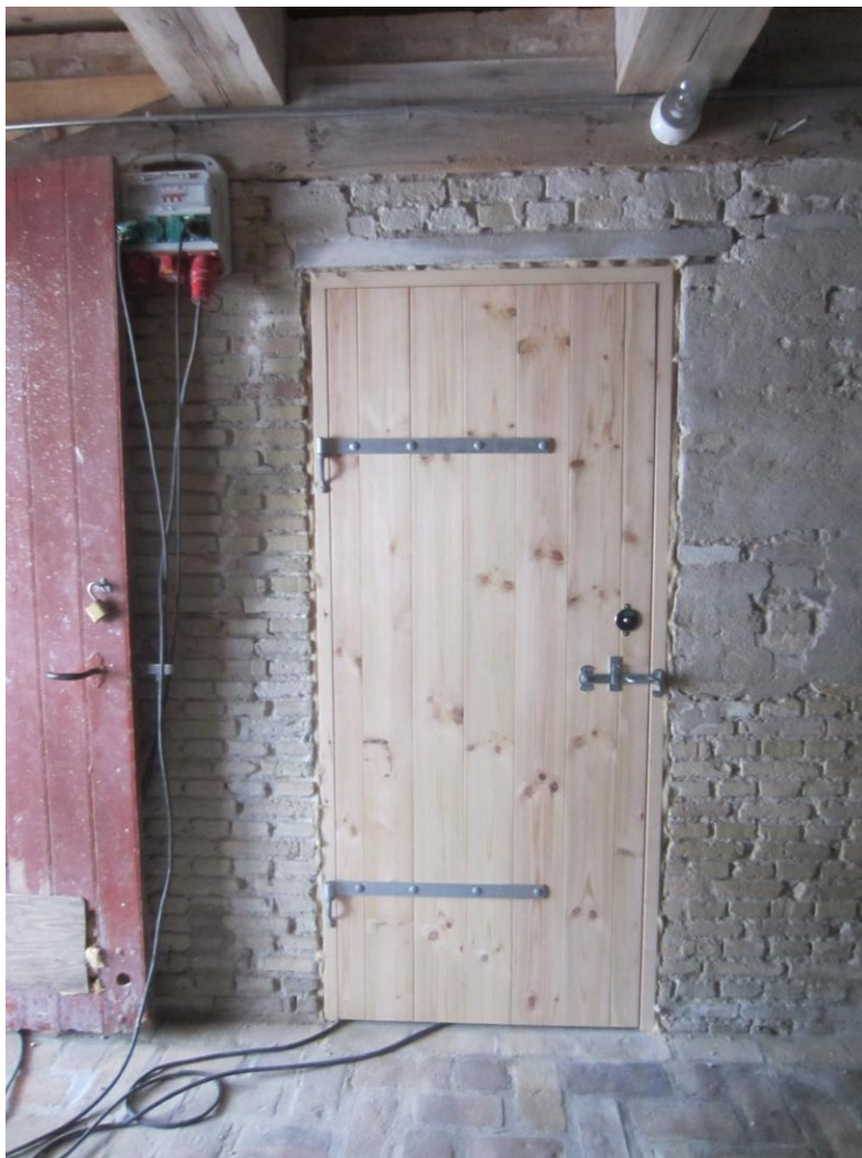
Flot ny toilettdør a la "Stalddør" passer fint ind

Status torsdag d. 15. marts 2018 - Dør til toilet og Svikstilling fortsat