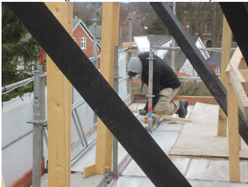
De klør` dog på – og forventer at komme i gang med brædderne i næste uge