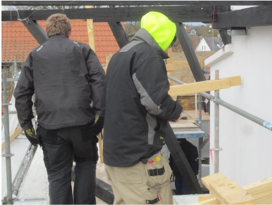
Det blæser og er koldt - ikke mindst 10m over jorden.