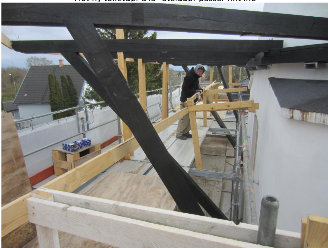
Eleverne fra tømrerlinien arbejder stadig med Svikstillingen