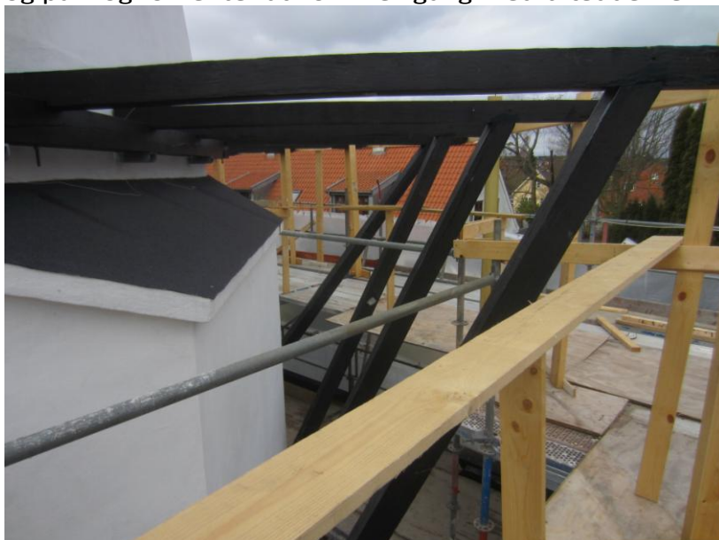
Rækværket skal på – da de må fjerne noget af "gulvet" for at komme til .