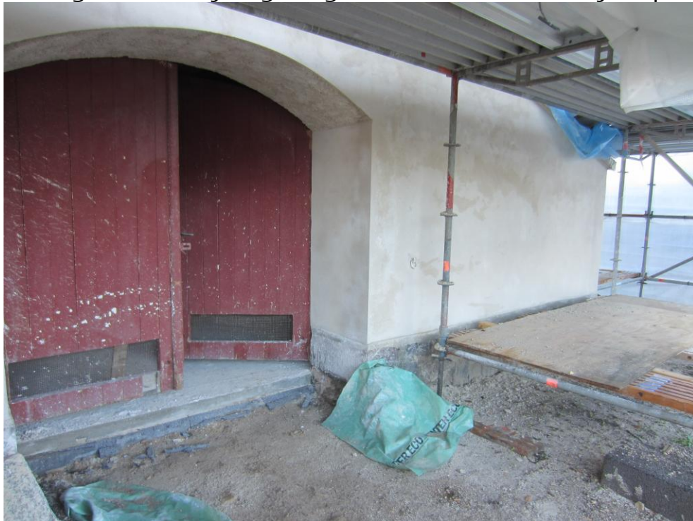
Imens har murerne pudset næsten færdigt udendørs Der mangler kun de to buer i portene over dørene