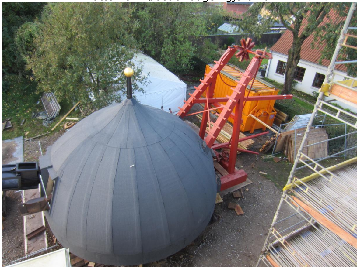
De sidste trin op til Vindrosen, Aksel og hjul mm er monteret til Vindrosen På grund af risiko for vind eftermonteres de 8 vinger på Vindrosen