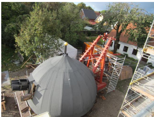
Hatten er i løbet af dagen gjort klar