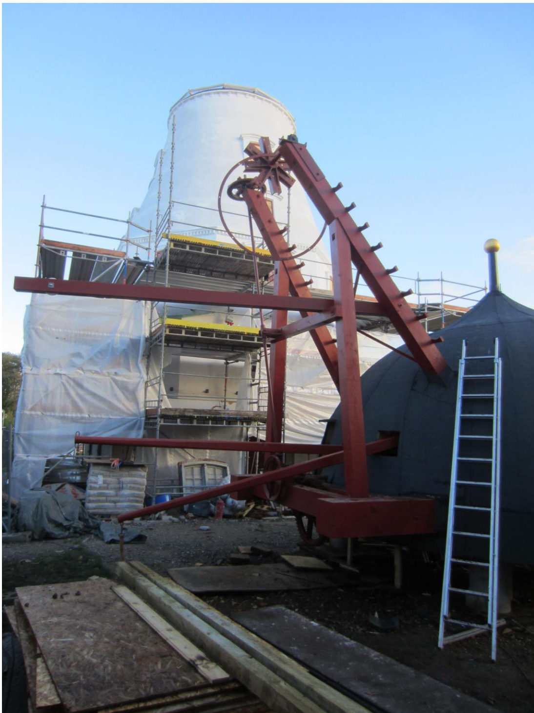
Alt styretøj til hatten er monteret