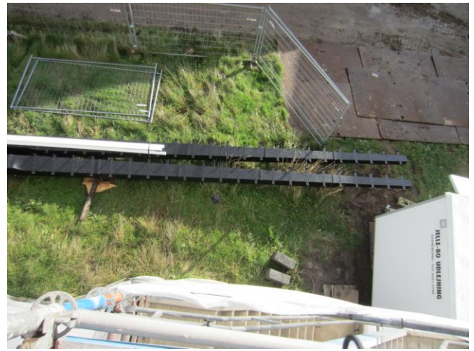
Vingerne kom jo i går og er klar til at blive hejst op