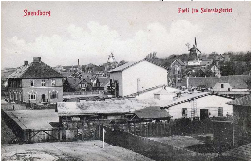
Postkort 1901 Svineslagteriet med th. Graas Mølle og bagerst Christiansmøllen Graaes mølle har Krøjerose og Christiansmøllen en "Svans" dvs. manuel krøjning