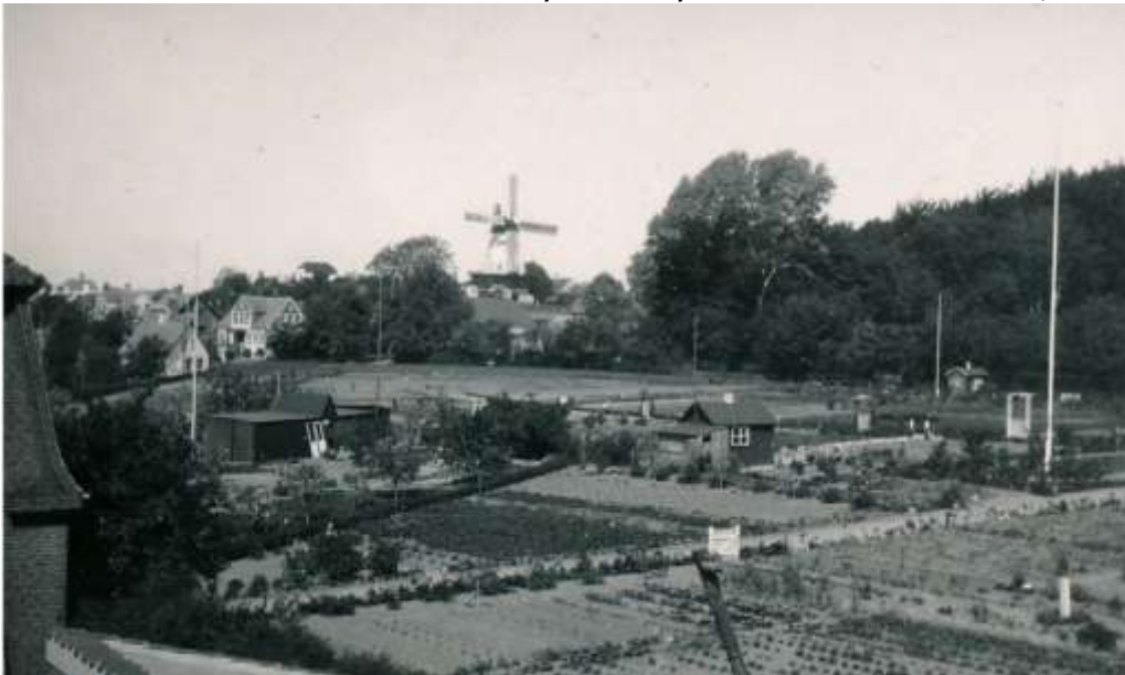
1950 set fra Kolonihaverne bag Amtsmandsboligen