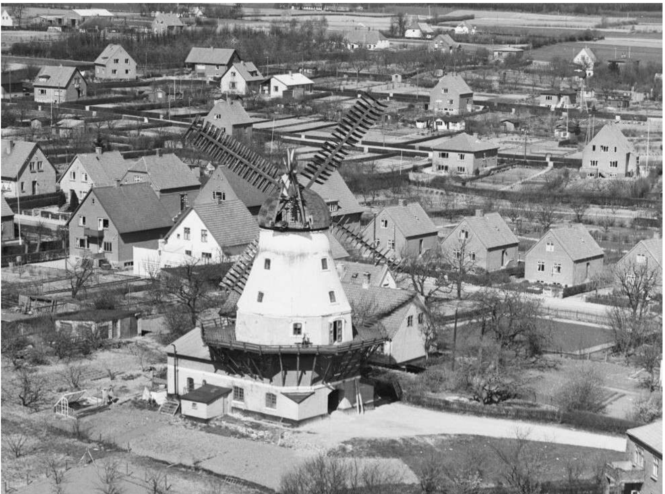
1940 optaget af engelsk fly.(RAF) Del af større billede se herunder