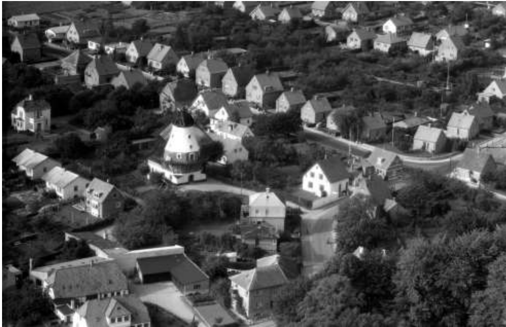
Ca 1956-58 De tre huse foran møllen mod byen udstykkes fra venstre i 1951, 1952 og 1954