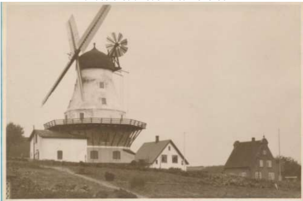
ca. 1925 bemærk tilbygning og Vindrose og kæder ned til Galleri