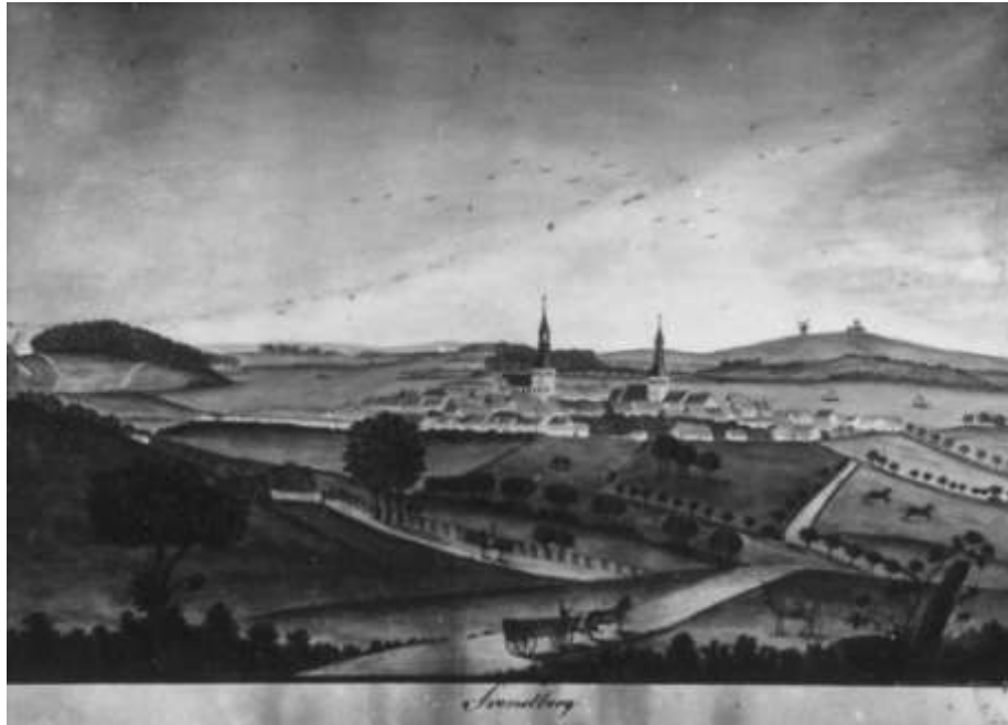
Illustration fra H.C. Andersens ture til Svendborg – Billedet dateret til 1830 – Bemærk stubmøllen t.v.