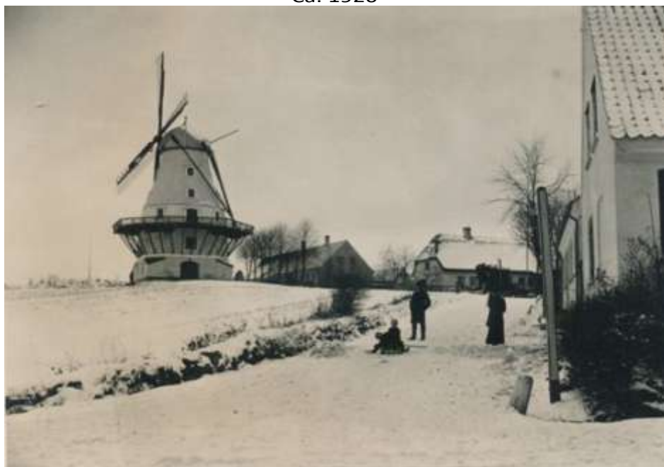
ca. 1920 med Møllegården ( stadig "Svans" = minus Krøjerose)