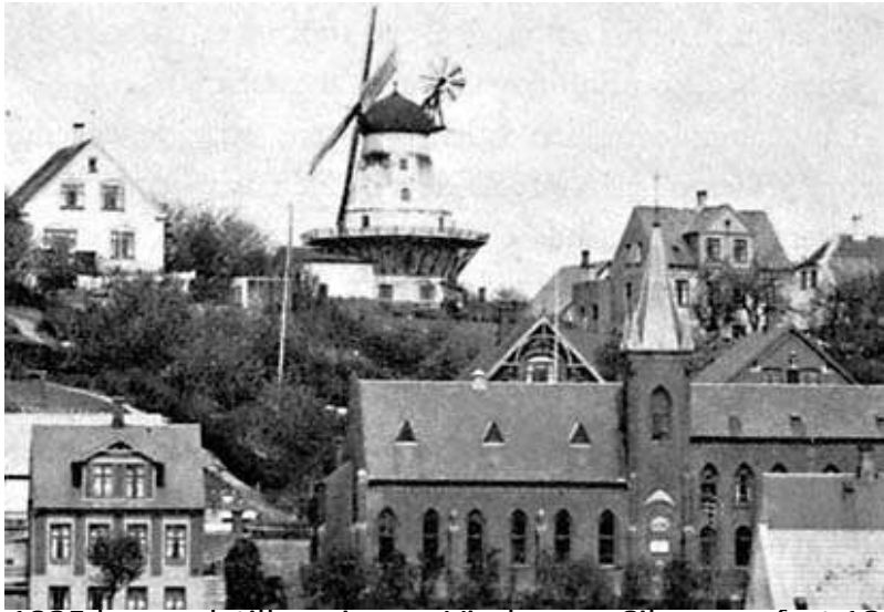
ca. 1925 bemærk tilbygning og Vindrose – Siloam opført 1895