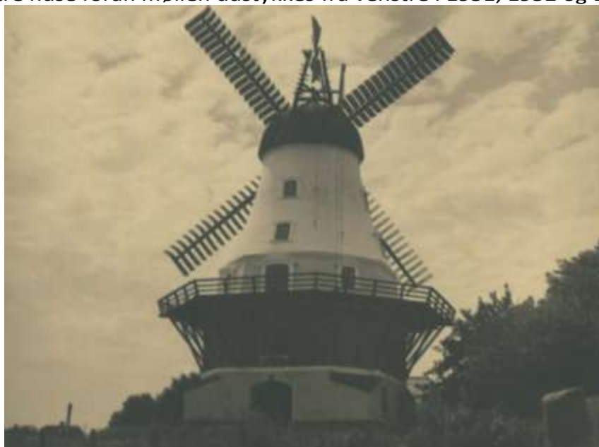
1945-50 Er den malet i 3 farver?