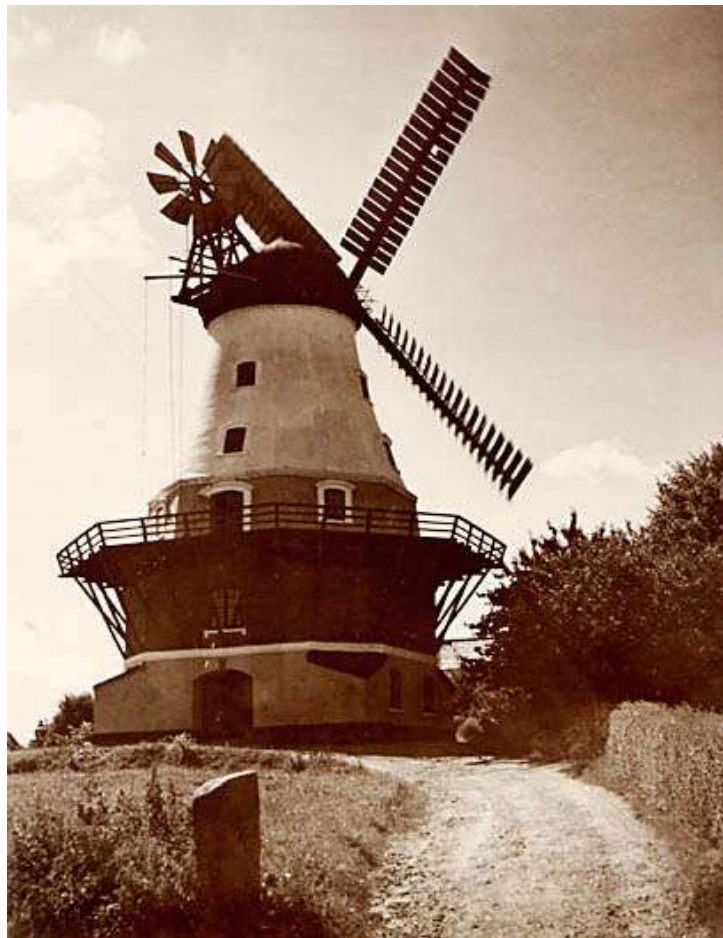
1935 Sendt som Festtelegram 1935 ?