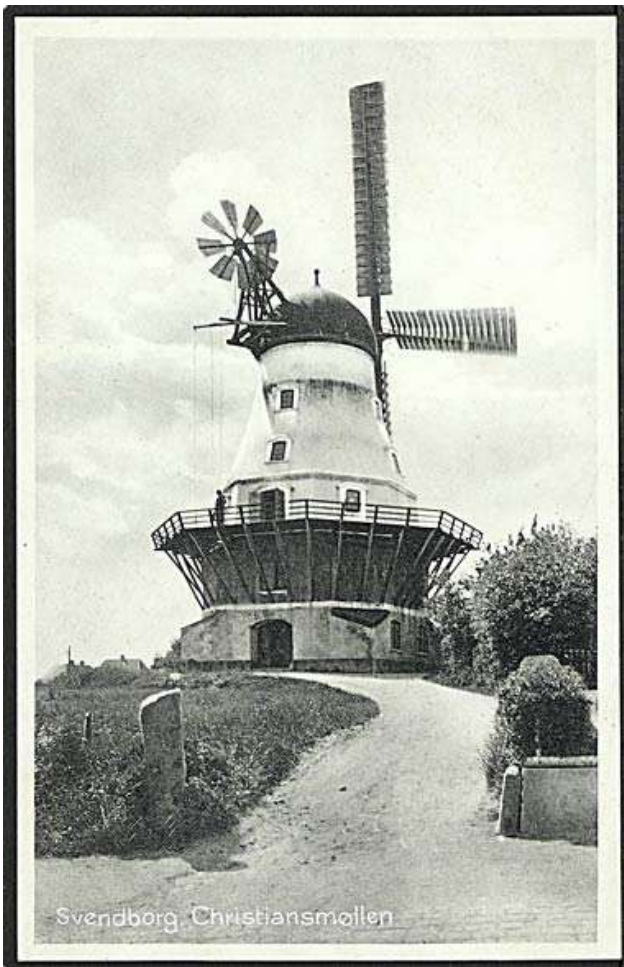
Postkort ca 1935