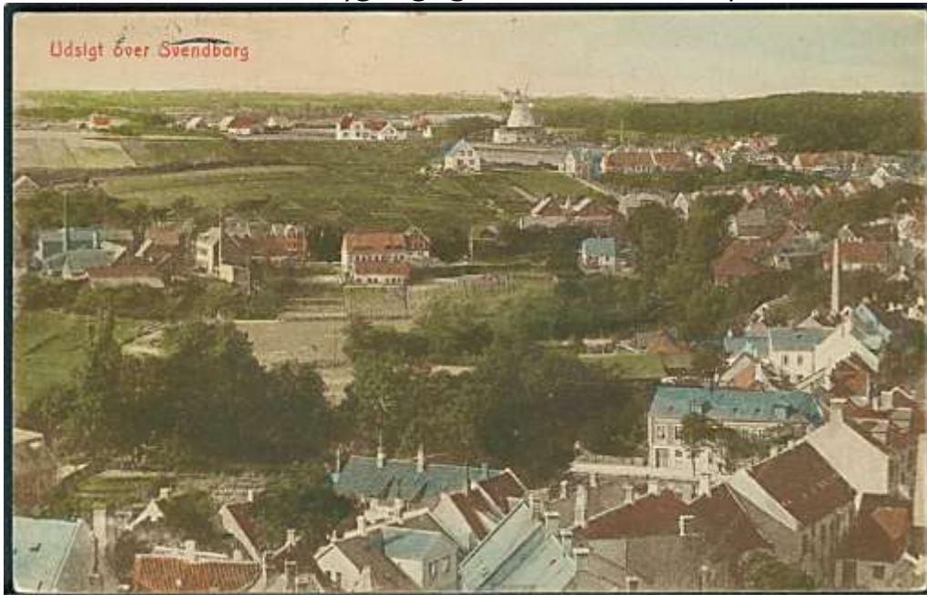
Håndcoloret billede fra ca. 1925-30