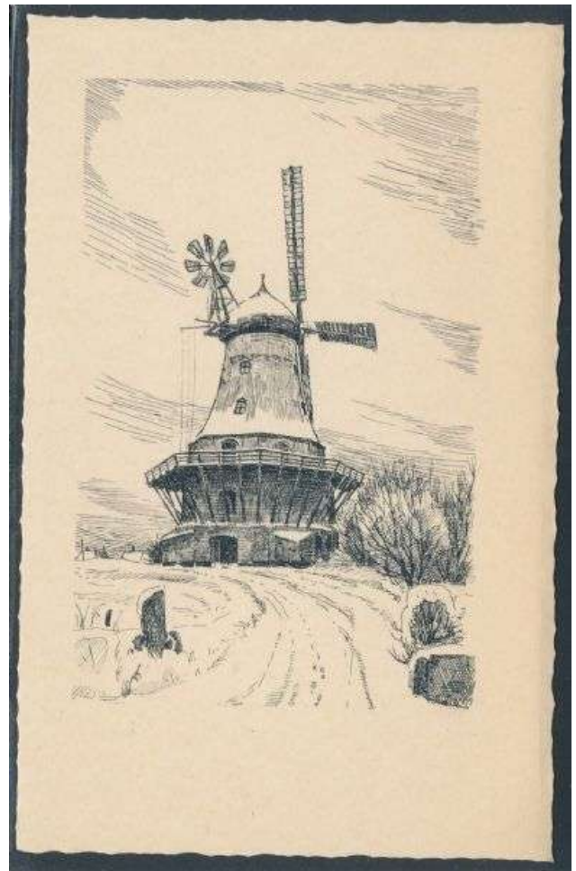
Tegning ca. 1935