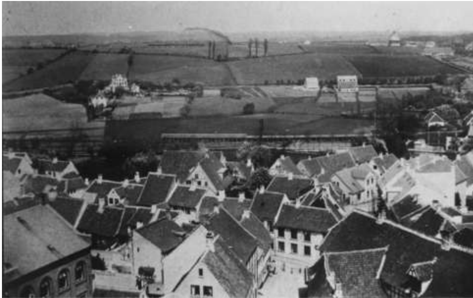
ca.1890 Vor Frue kirkes tårn mod nord. Vejen tv. Bagergade. Bemærk en af byens Reberbahner. Th. neden for møllen Dronningholmsvej med Grubbemøllen