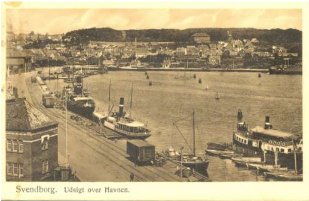
Postkort 1913 Svendborg Havn - både Christiansmølle og Graas mølle ses.