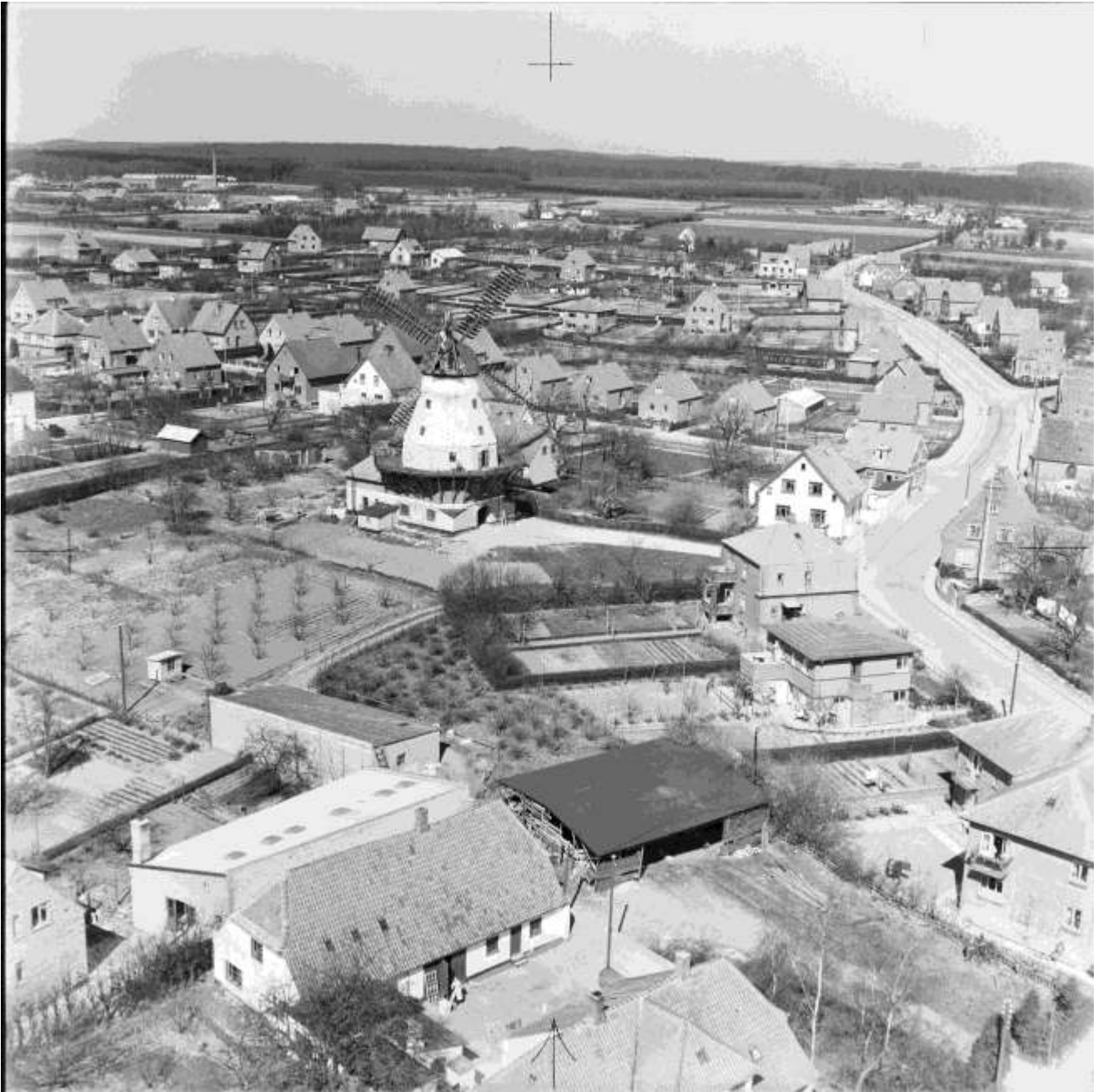
1940 Luftfoto over området med Christansmøllen De tre huse foran møllen udstykes fra venstre i 1951, 1952 og 1954