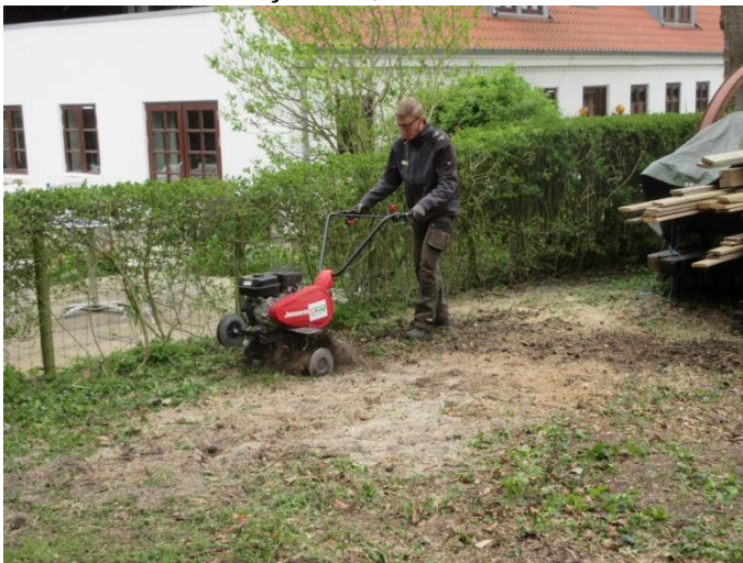
Fjerne løse del i 5-10 cm dybde