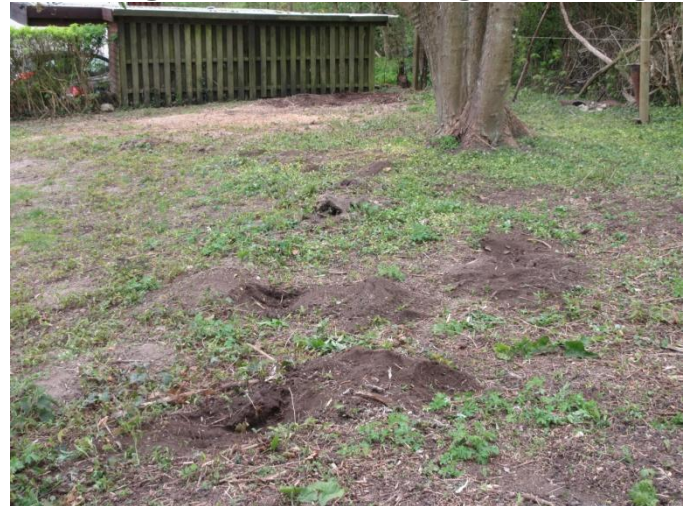
Rodfræse alle rødder