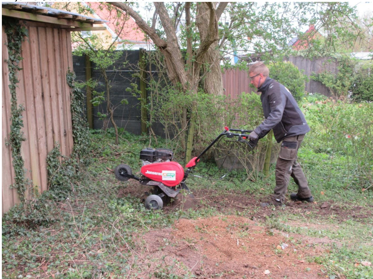
Væk med rødder og og rodnet