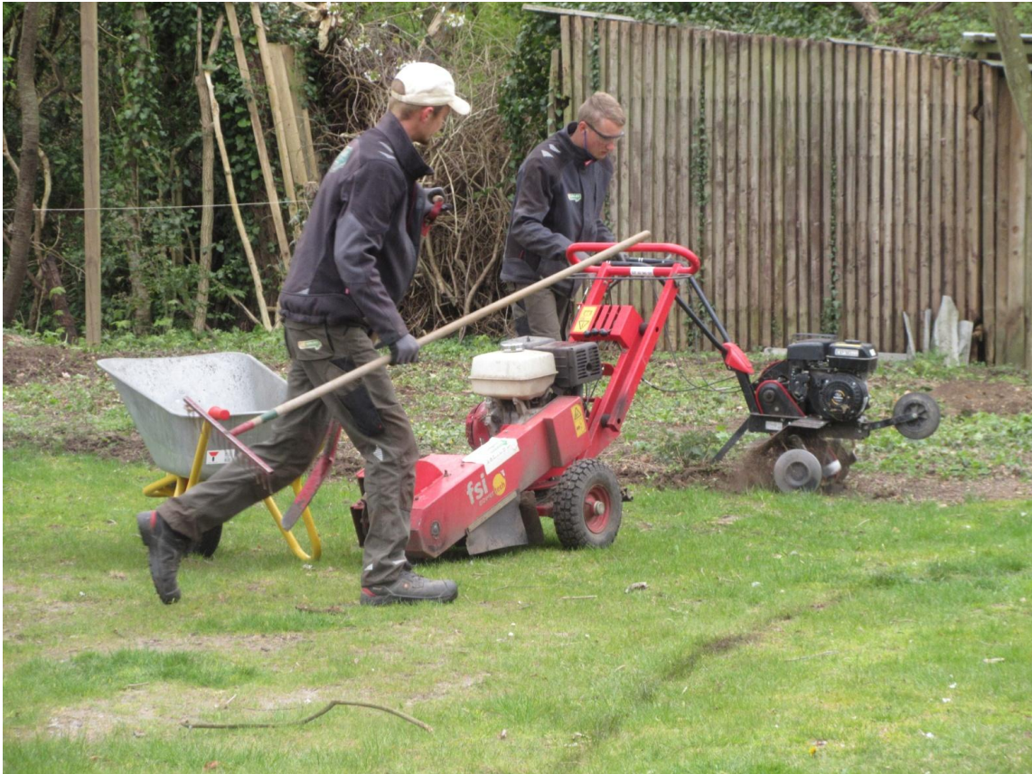
Så er der klar til en god rive til fordeling af jord