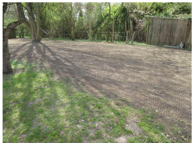
Til sidst vendes græsfrø i underlaget