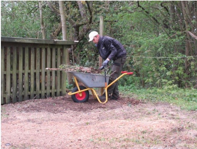
Fjerne løse dele

24-04-2019 blev området bag møllen rodfræset og kultiveret inden græssåning.