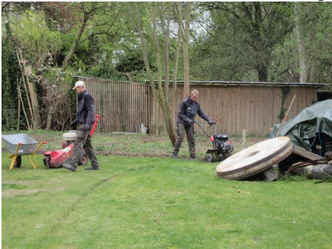
Det overskydende køres væk