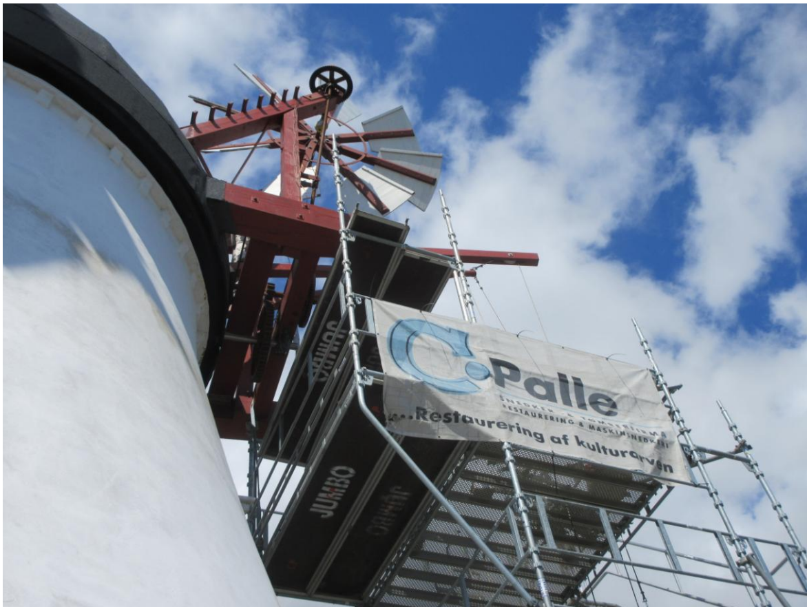
Med Lasse oppe ved vindrosen laves testkørsel med krøjning