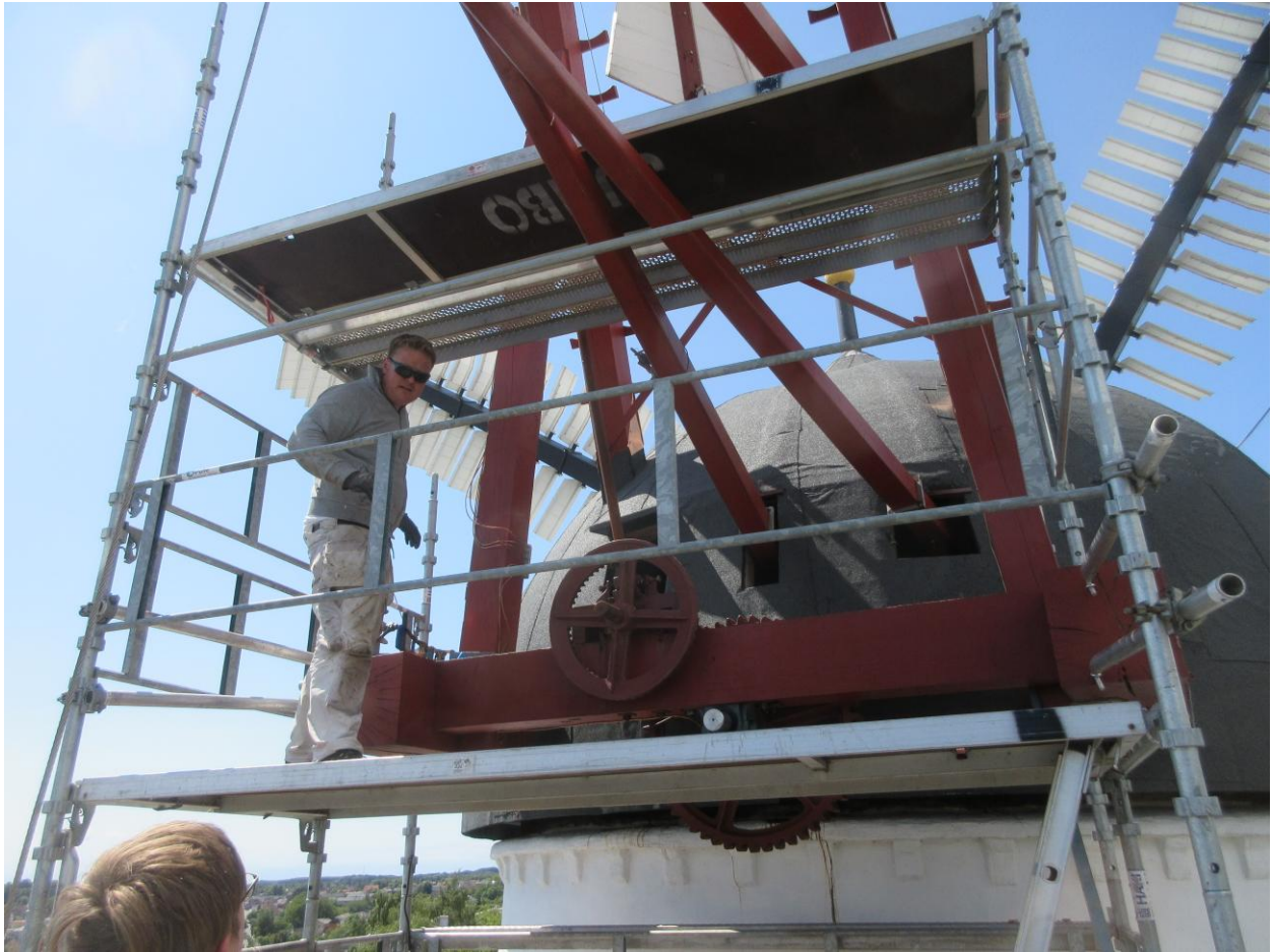
Eftermiddagen bruges på klargøring til første testkørsel af vindrosen/krøjning.