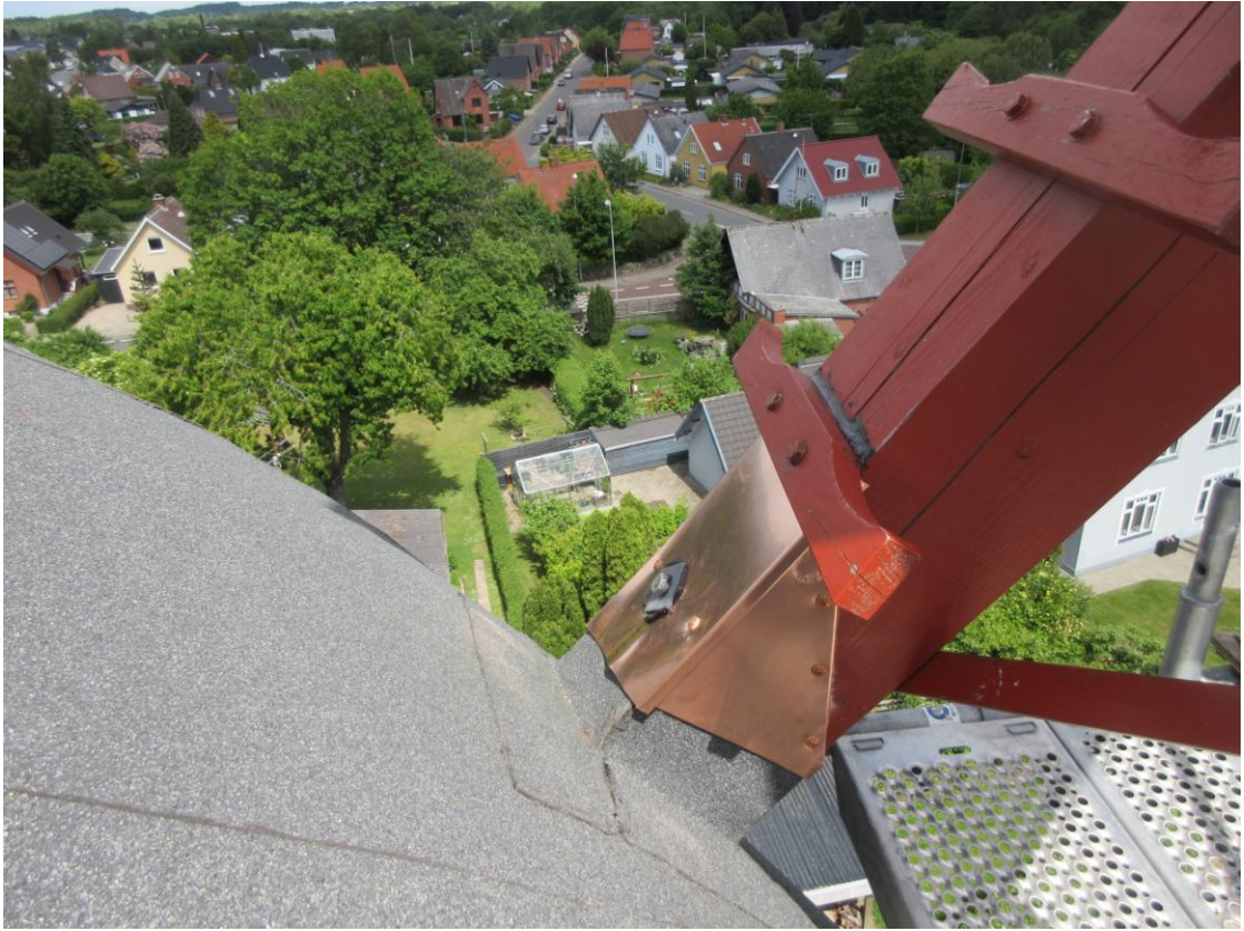
Det færdige resultat