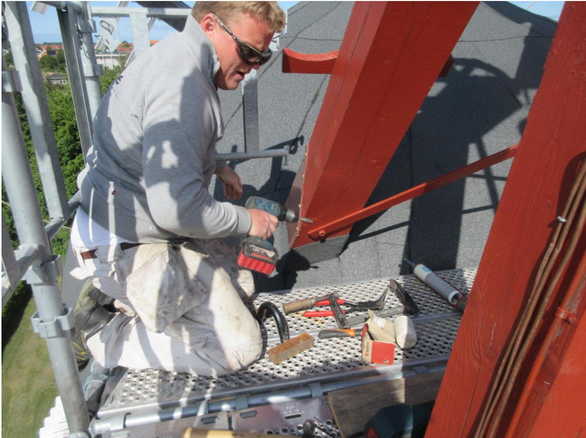
Kobberet opmåles og skæres og bukkes og der laves huller så det kan skrues fast.