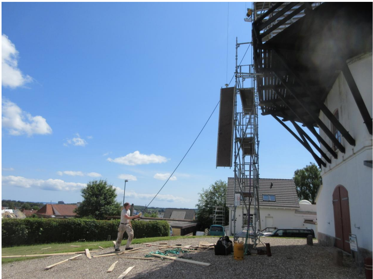
Det kræver at de 2 etager af stilladset oppe ved vindrosen tages ned.