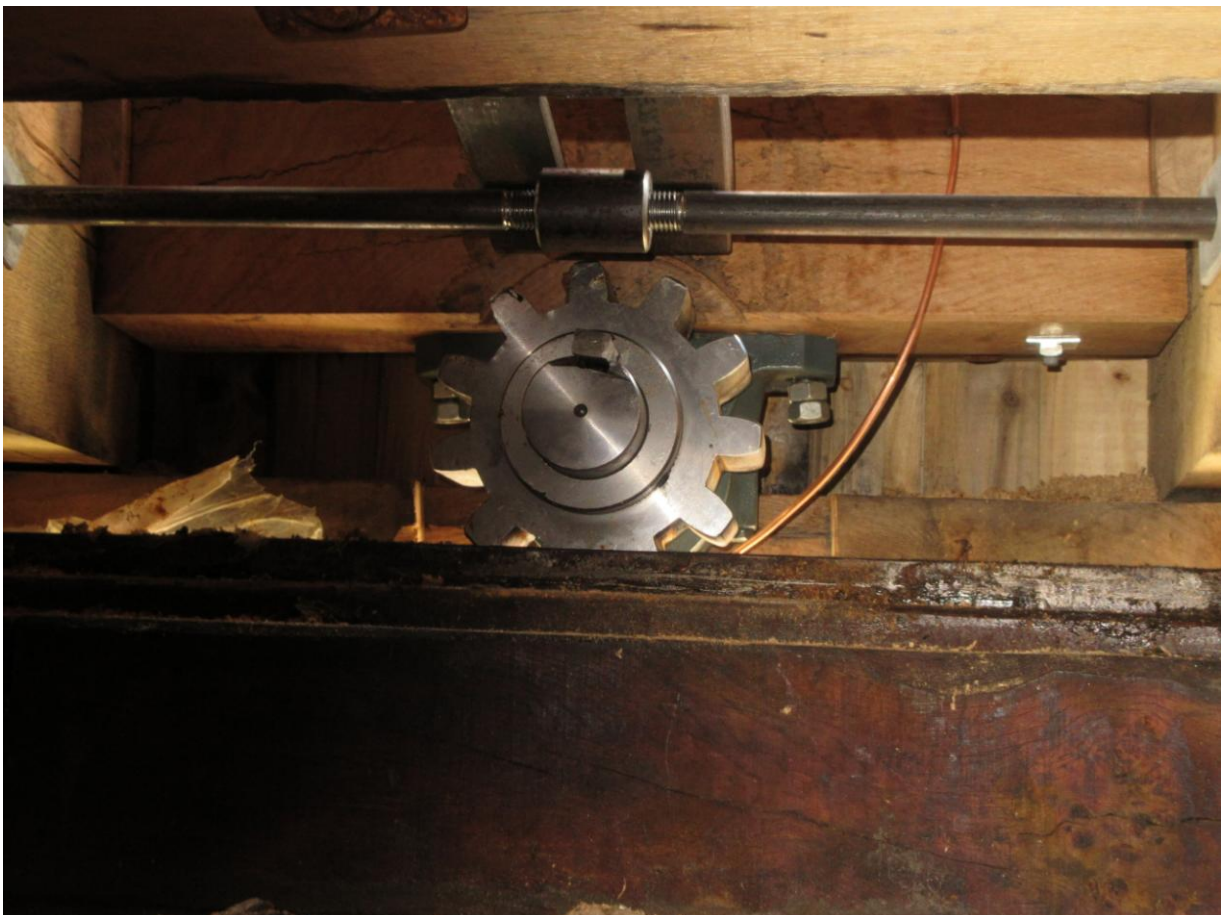
Undertegnede holder øje med evt. den mindste mislyd inde i hatten.