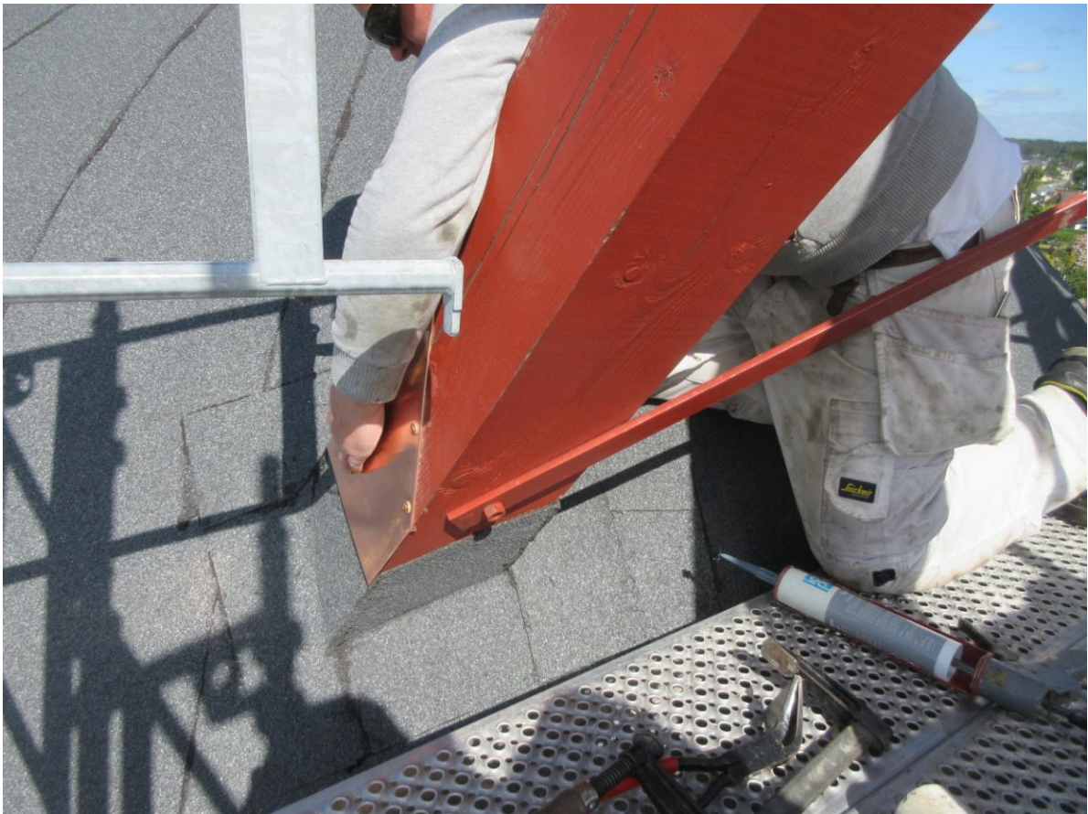
Små tagrender sørger for at vandet løber væk