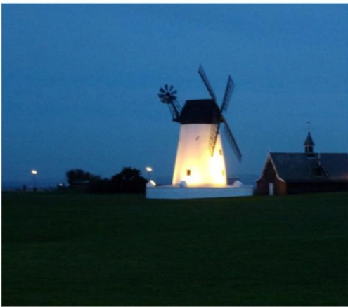
ULBØLLE MØLLE - BELYST NEDEFRA