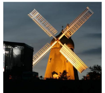
BÆLUM MØLLE - FRONTBELYST SKRÅT NEDEFRA