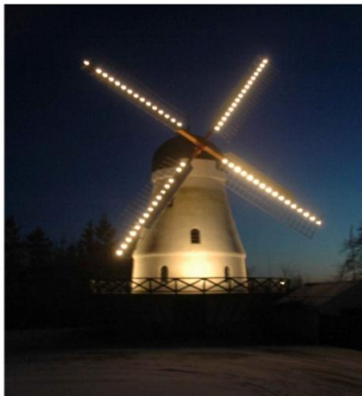
MØLLE MED BEGGE DELE