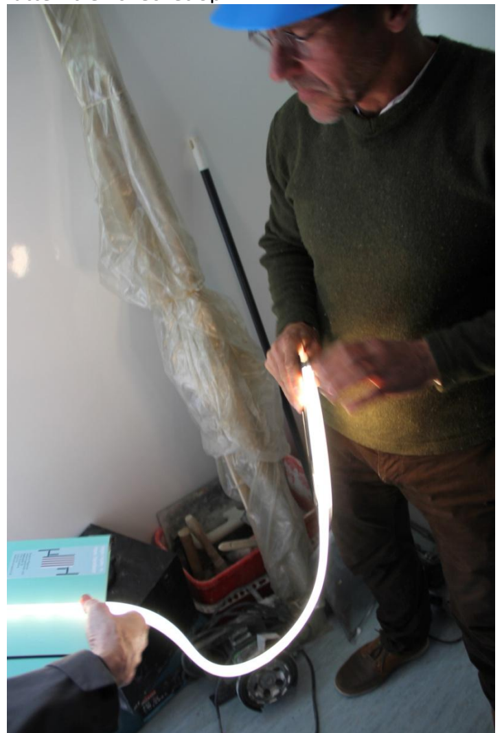
LED lys blev demonstreret – lysbånd mm