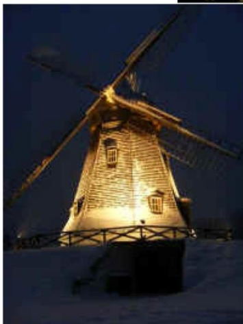
HØJSAGER MØLLE BELYST PÅ FRONT (mont. på omgang?) NEDERSTE DEL, HAT OG VINGER ER MØRKE