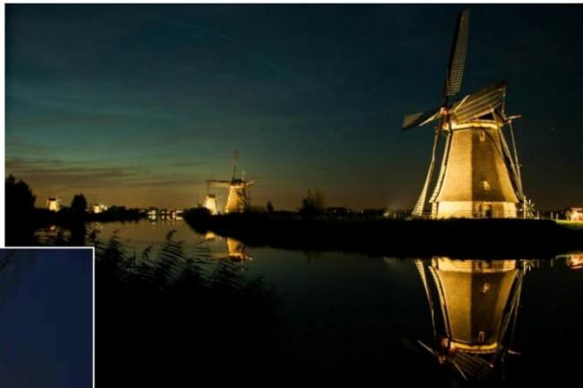
2 MØLLER FRA HOLLAND BELYST NEDEFRA - DYSTERT / DRAMATISK