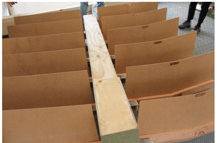
Hvor kan lyset på vingerne placeres?