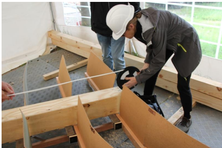
Der blev målt og diskuteret