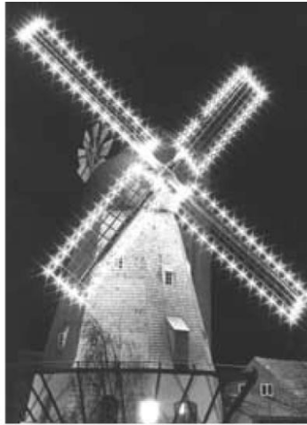
AULUM MØLLE - PÆRER A LA TIVOLI Front delvist oplyst?