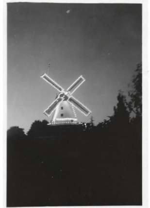
CHRISTIANSMØLLEN I 30'erne