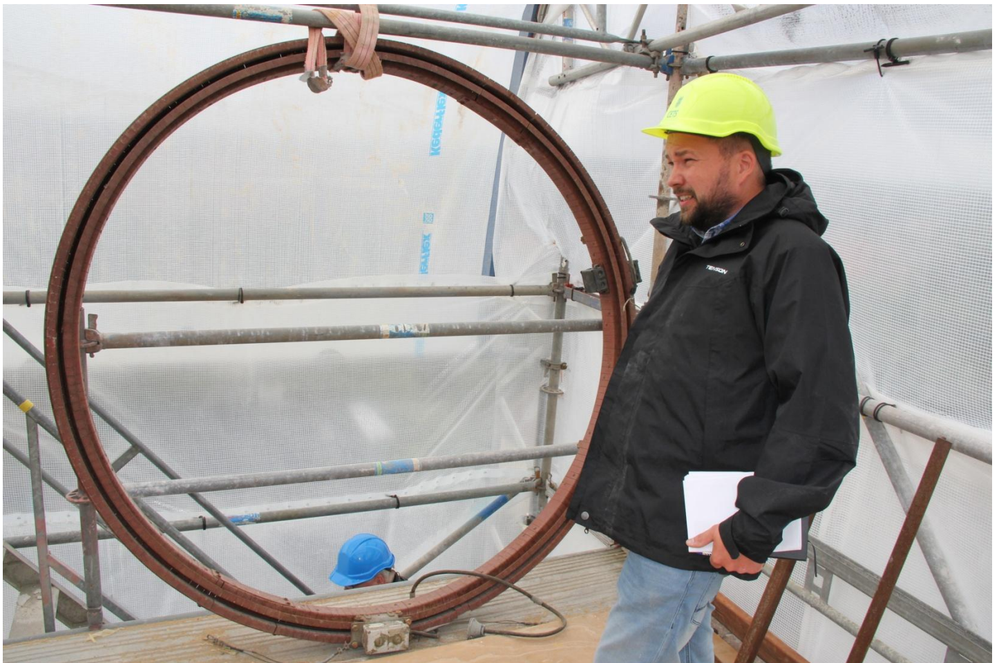
Den gamle strømsskinne i hatten blev checket op.