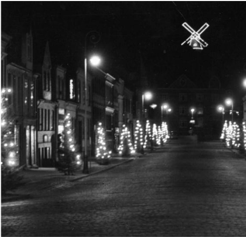
VEJLE MØLLE - ELPÆRER MONT. PÅ VINGER Kun det omrids pærerne tegner ses.

Mulighederne er mange som man kan se på dette input fra et bestyrelsesmedlem