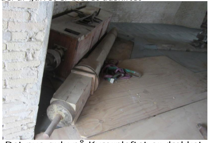
Det nye gulv på Kværnloftet er dækket til