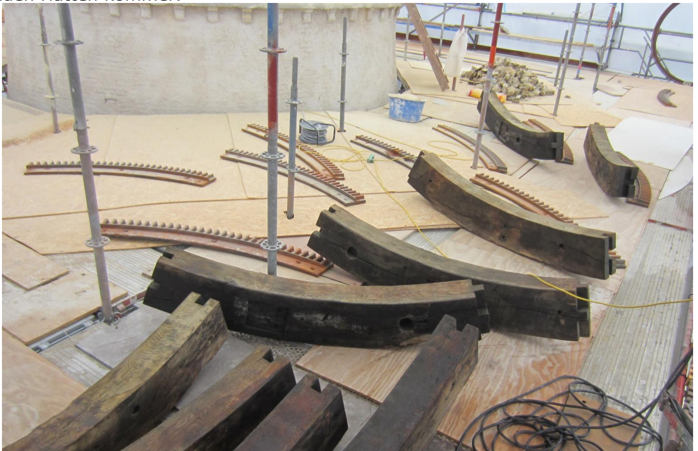
Heldigvis er alle dele til tandkransen nummererede med romertal.