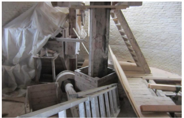
På Lorrisloftet over Stjernehjulsloftet arbejdes der også på gulvene og etablering af trapperne igen