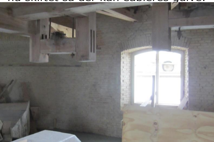
Her Broloftet lige under Kværnloftet