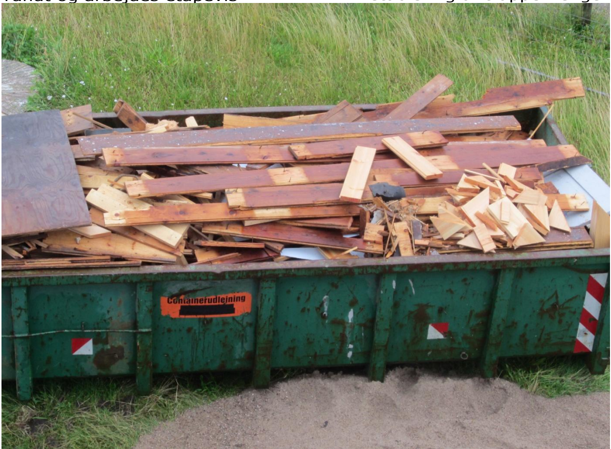
Et læs gamle, kasserede gulvbrædder