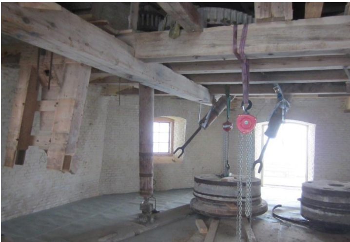
Et kig ind på kværnloftet med de to døre til Svikstillingen