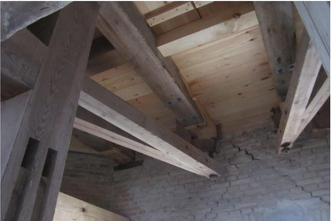
Et kig op på Kværnloftet hvor en del af gulvet er blevet udskiftet