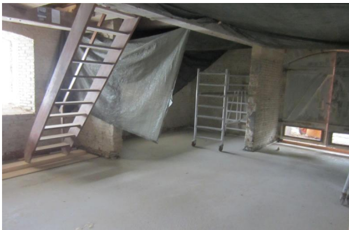
Nederst i Portrummet er nu støbt gulv. Bemærk de blændede vindueshuller, som nu er åbnet. Sikke en masse lys.