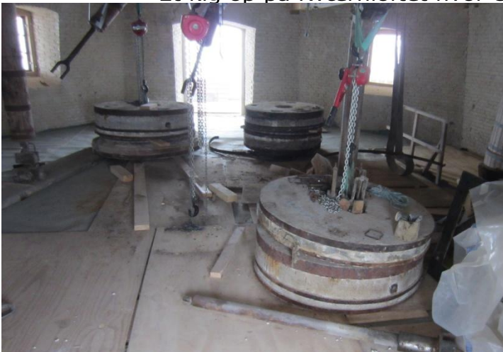
Kværnloftet med de tunge kværnsten