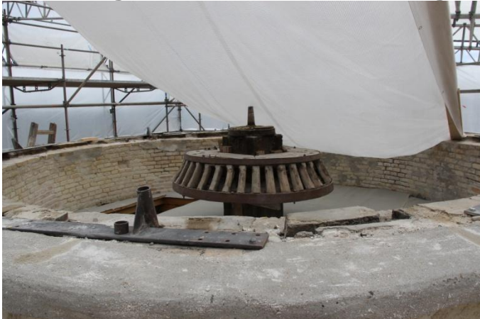
Kronhjulet i toppen af møllen

Ved besøget d. 5/7 2017 blev taget følgende billeder.