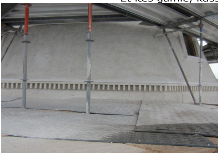
Udvendigt er man kommet rigtig langt. Her nederste del af Overmøllen med Stjernehjulsloftet