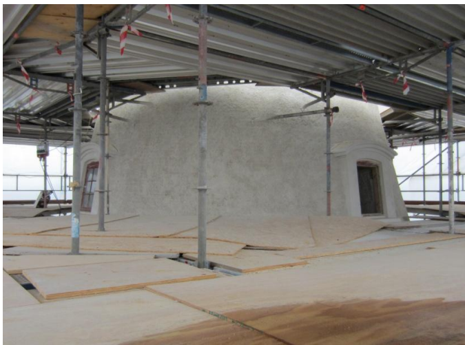
Lorrisloftet og ovenpå ligger Hatloftet