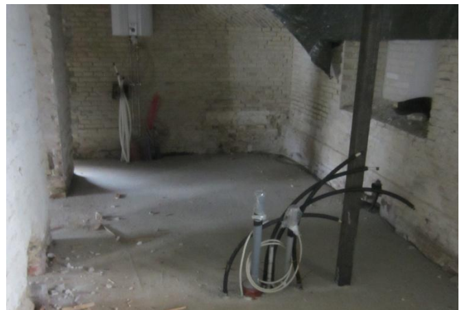
I den ene side bagerst etableres et Tekøkken og ved siden af etableres Handicapvenligt Toilet