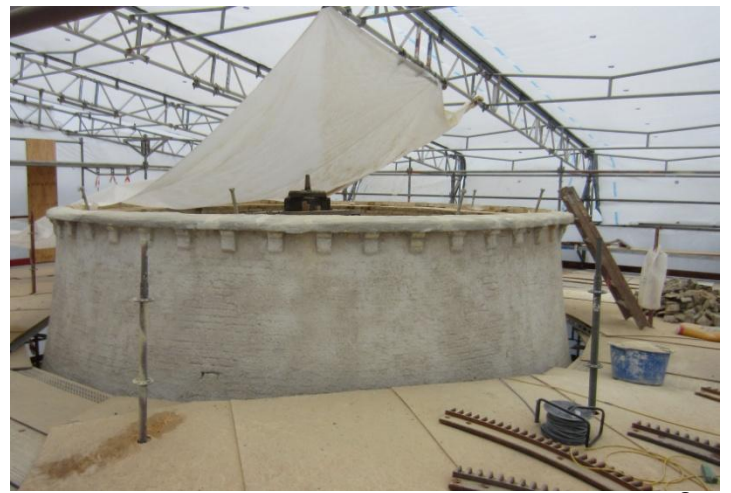
Hatloftet hvor Hatten kommer ovenpå