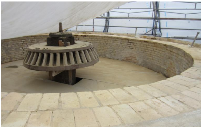
Her etableres glideskinne og tandkrans Kronhjulet, som trækker kongevellen, kommer Møllebyggeren og restaurerer inden Hatten kommer.