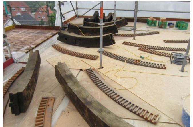
Dele til Tandkransen som møllehatten hviler på