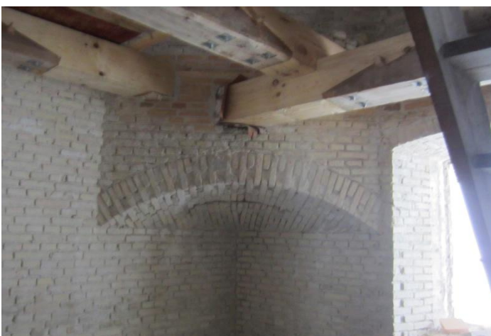
I Portrummet er de sidste bjælkeender nu skiftet så der kan etableres gulve.