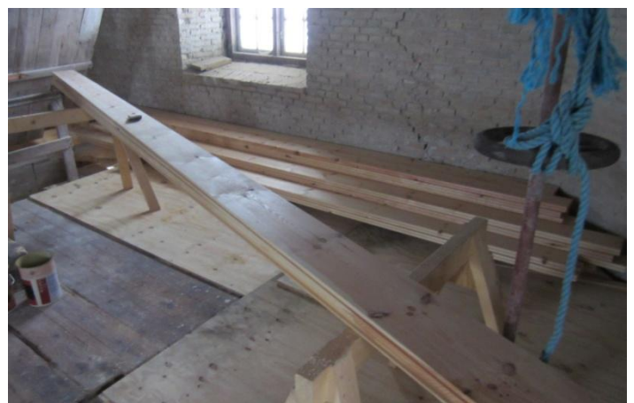
Ovenpå på Broloftet er man i gang med udskiftning af gulvet.