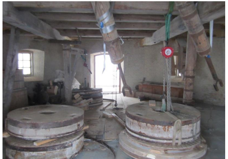
På kværnloftet flyttes stenene rundt med kraner så gulvet kan lægges