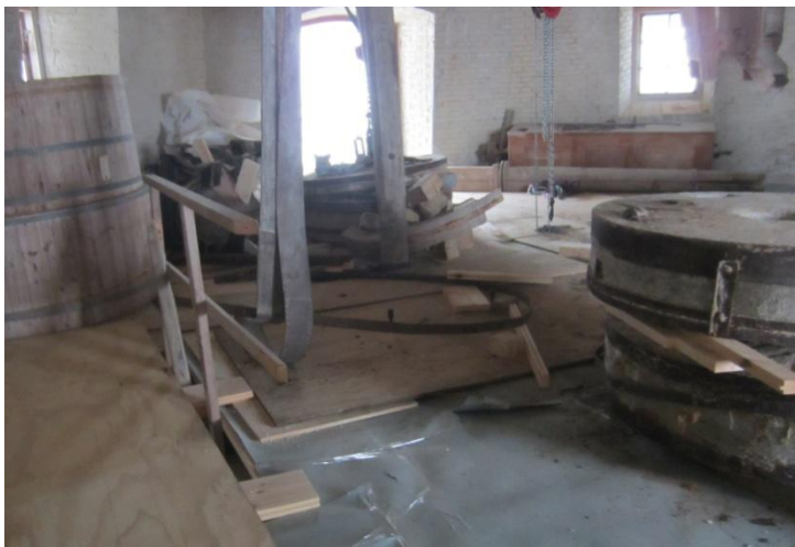
Også fra Kværnloftet hvor der flyttes rundt og arbejdes etapevis