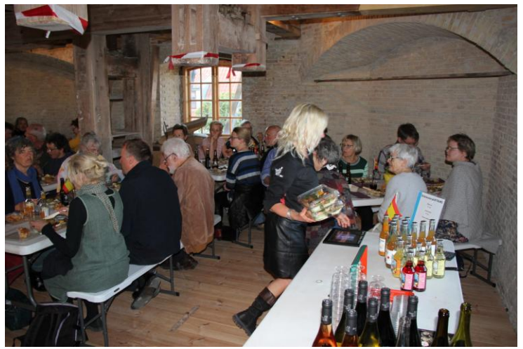
Indimellem nød man de lækre delikatesser