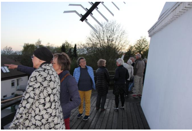
Så var det tid til at komme ud på svikstillingen