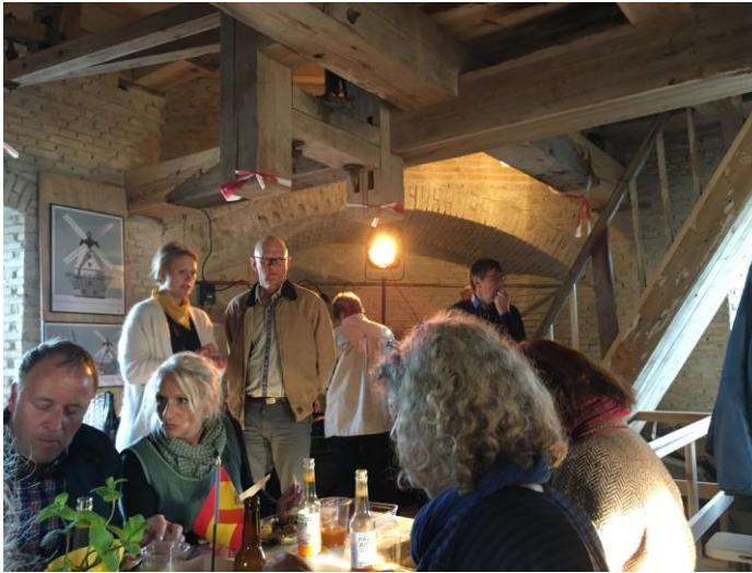
50 mennesker havde købt billet til dette arr.