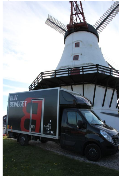
Et godt samarbejde om et godt arrangement