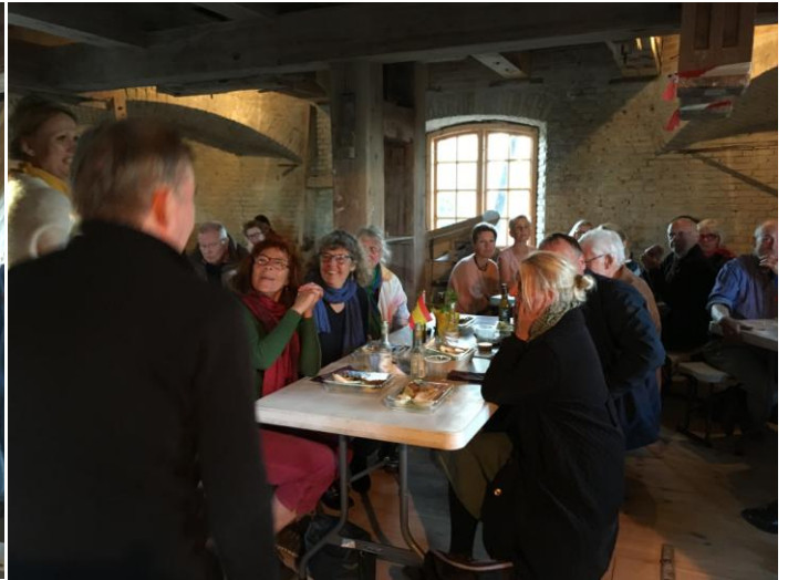
Lækre madkurve med spansk indhold af Tapas