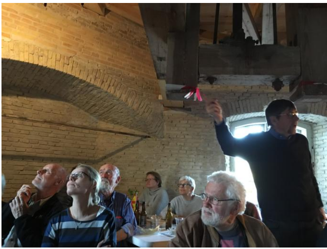
Der blev lyttet og peget og fortalt...