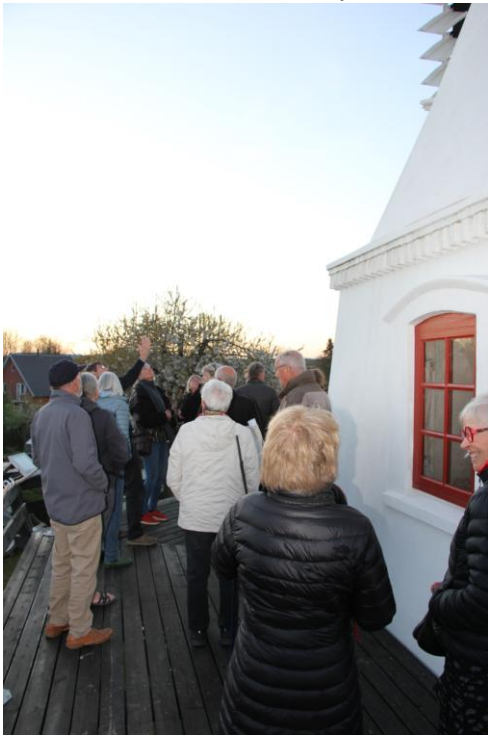
Alle var imponerede over møllens forvandling