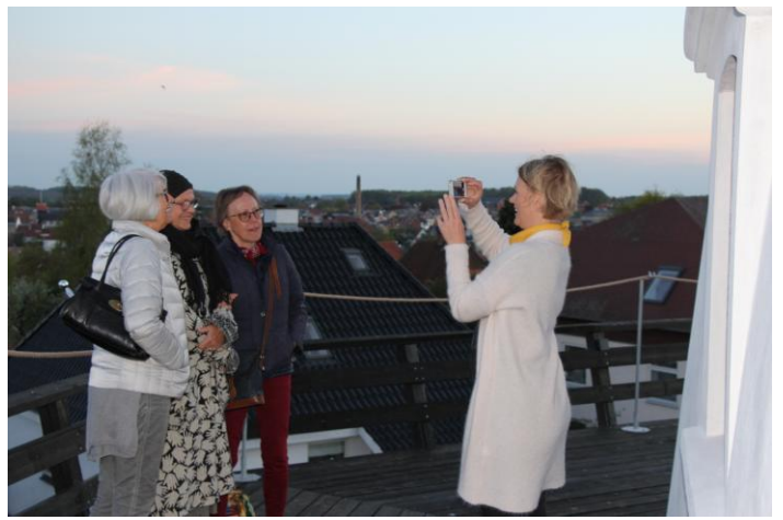
I hold på 25 var man ude at nyde udsigten