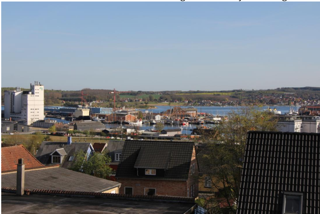
Og JA – Udsigten i aftes fejlede ikke noget!