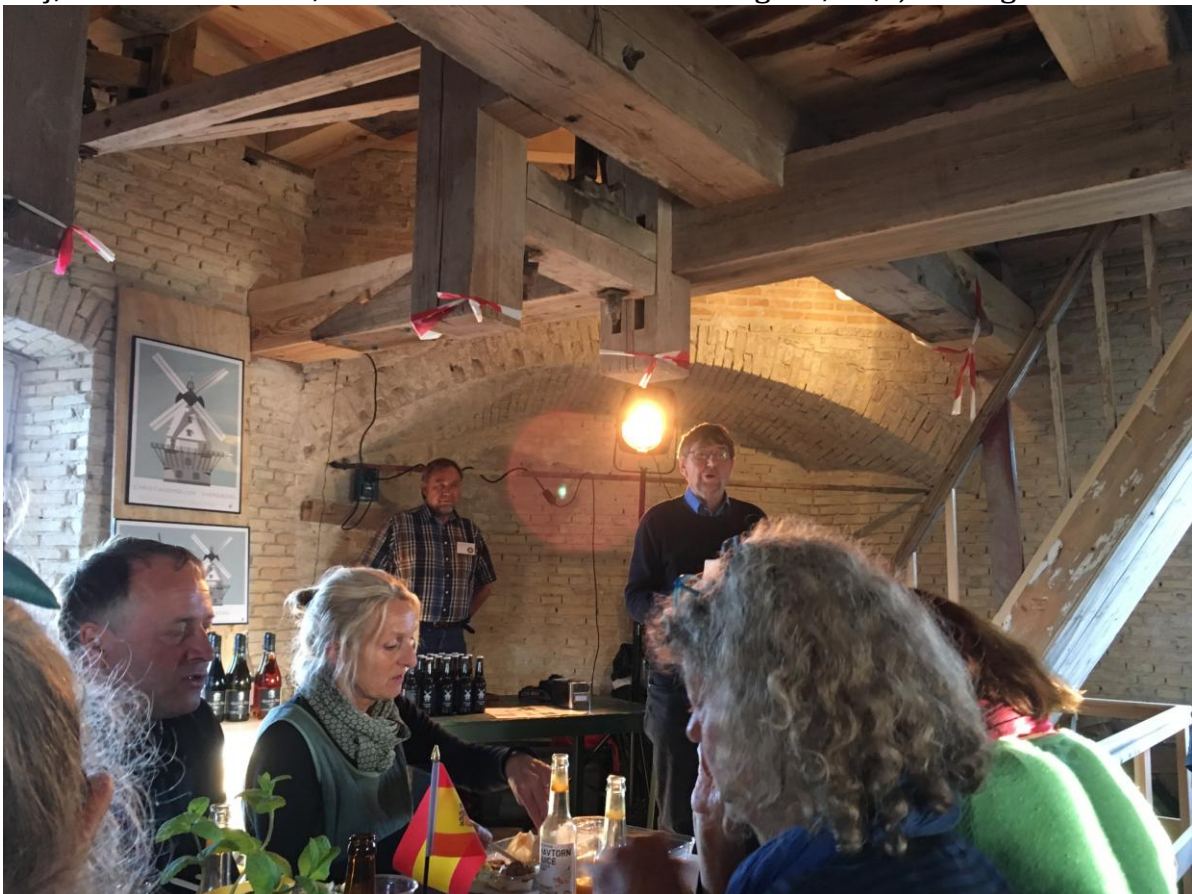
Så fik de besøgen historien om møllen og om restaureringens forløb