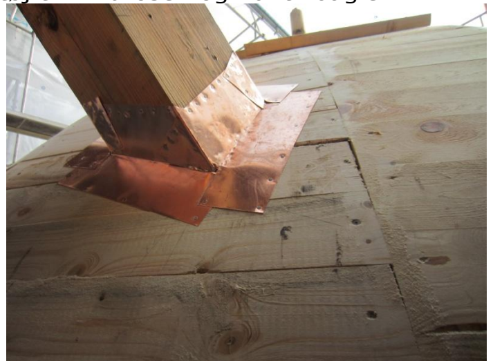
Hvor det bærende tømmer til vindrosen går igennem hatten tættes med kobber