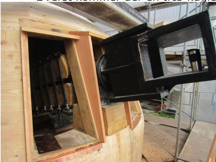
Forrest på hatten - to lemme - her venstre