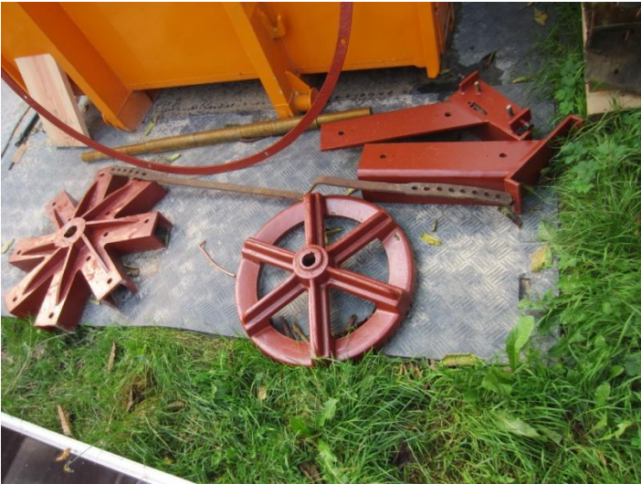
Herover: Vindrosens dele venter endnu

Til højre: Nogle bomme til at styre hatten med venter også