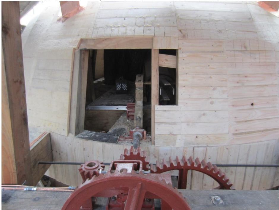
Hatten set udefra/bagfra med Geartøj til Vindrosen og hul til baglem