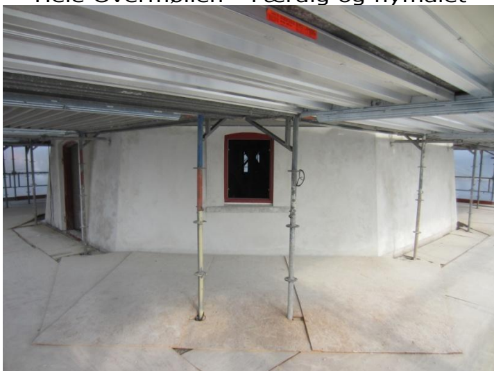
Resten af Undermøllen er grovpudset Så der går knap 2 uger inden maling