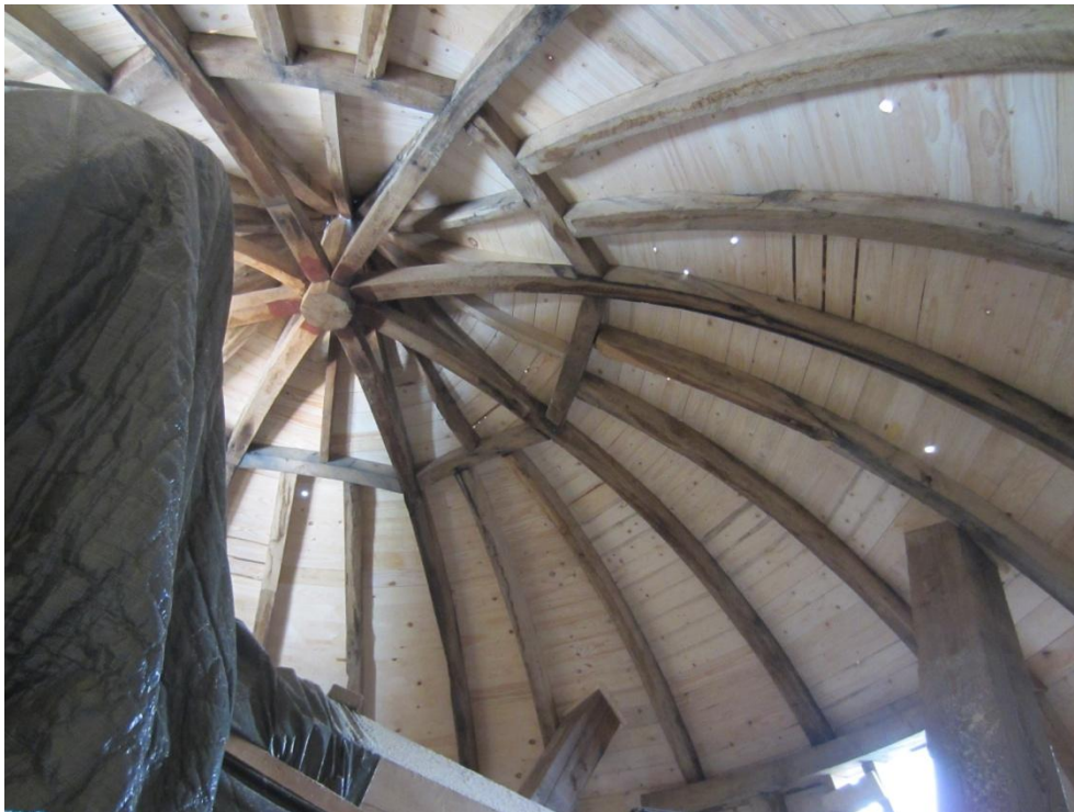
Billede af af Møllehattens flotte konstruktion