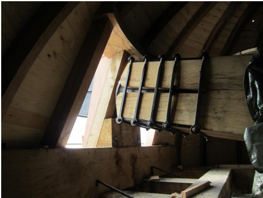
Her ses de to lemme fortil – og bag dem den store vingeaksel med Hathjulet