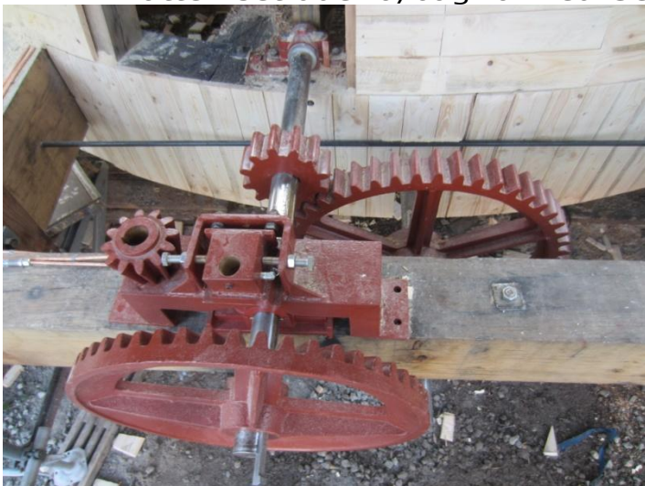
Geartøjet set ovenfra