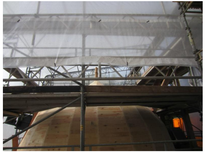
Bemærk den løgformede spids øverst