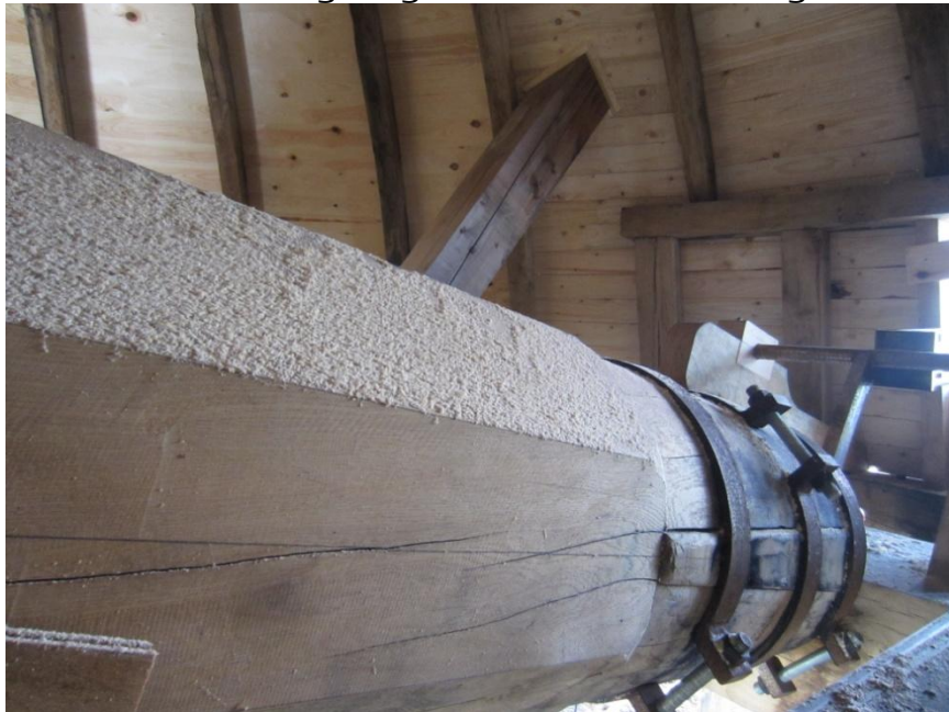
Vingeakslen ligger skråt nedad og ender i et søleleje