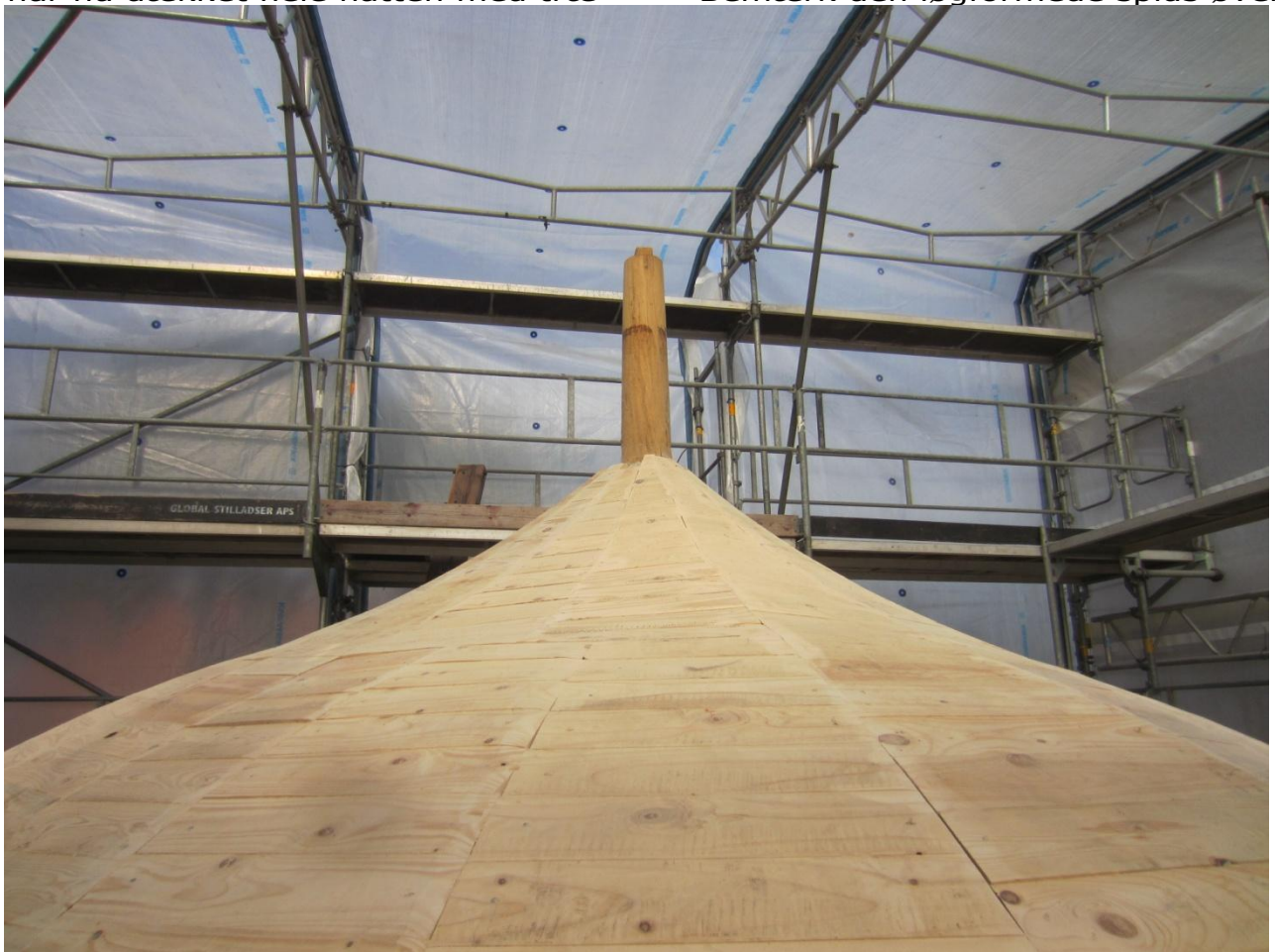
Øverst kommer der en træ-kugle og hatten beklædes med tjærepap.