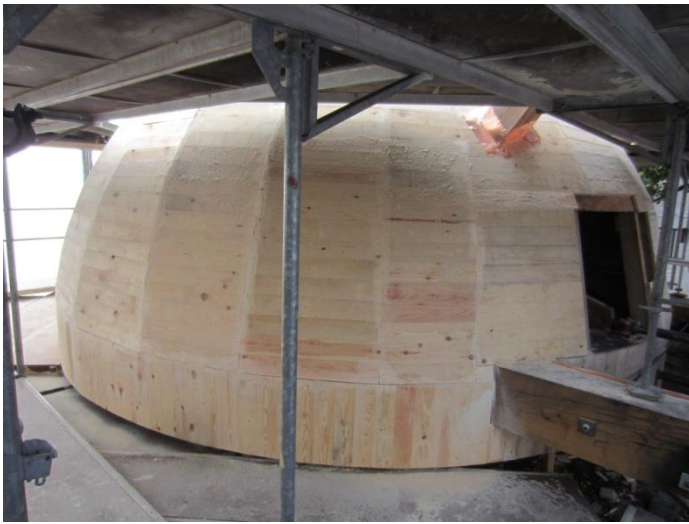
Man har nu dækket hele hatten med træ