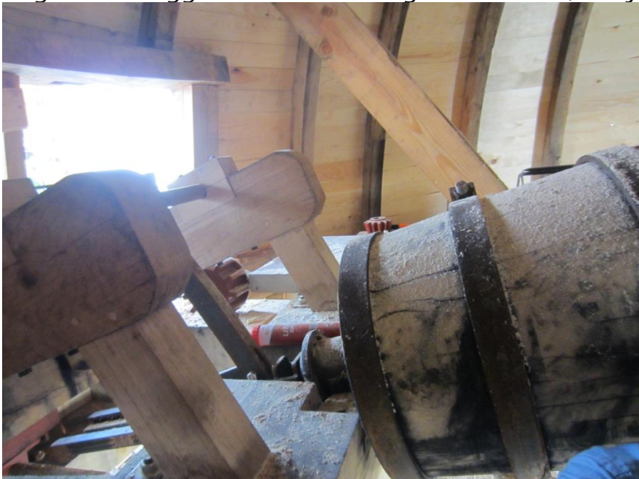
Her ses lejet – og starten på Geartøjet inden baglemmen