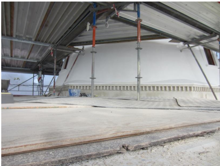
Hele Overmøllen - Færdig og nymalet