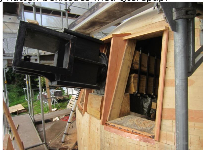
her højre så kan der justeres og repareres