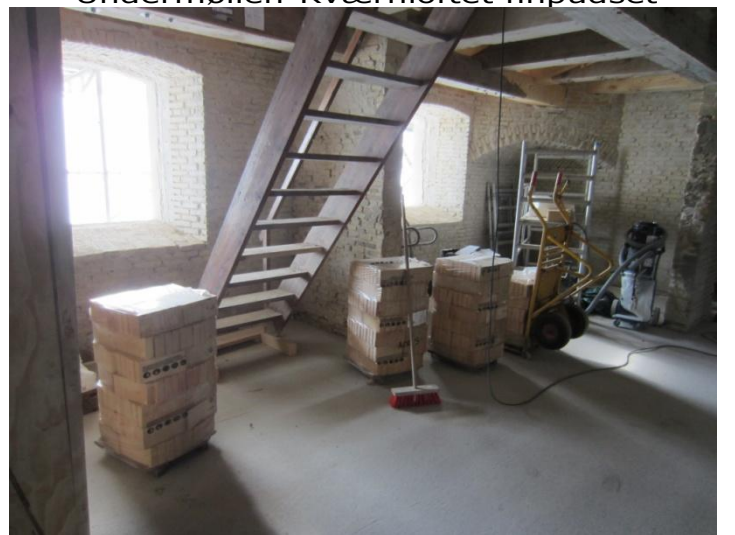
Sten til murene (toilet/køkken) i Portrummet er gjort klar.