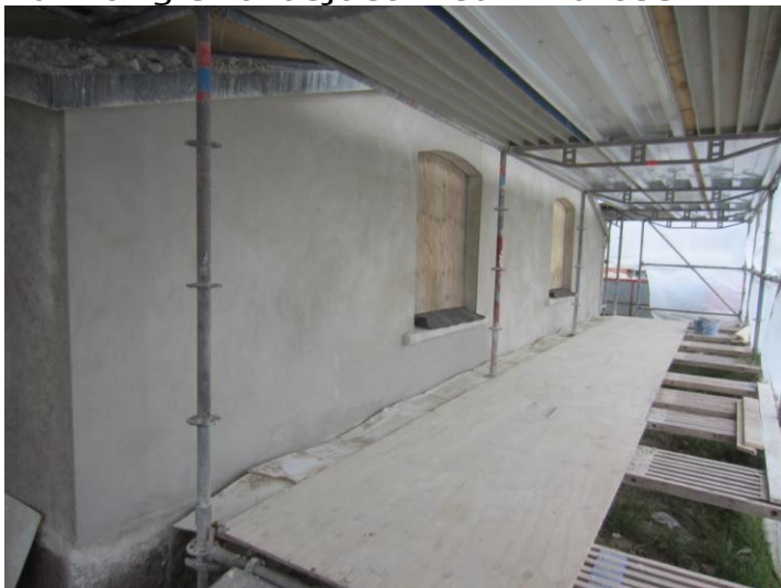
Så er nederste dæk finpudset