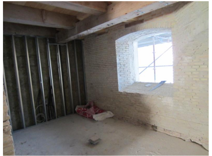
På køkkensiden i gang med isolering.