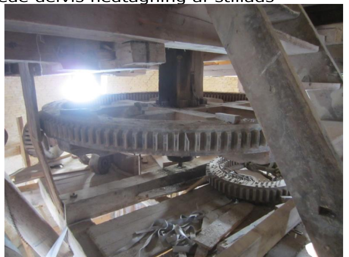
Det store stjernhjul venter på igen at køre rundt