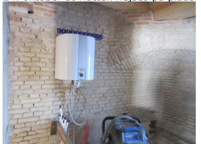
Vandvarmer, gulvvarme og kloak er på plads