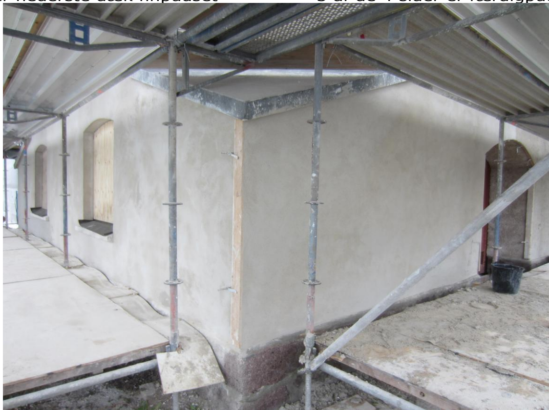
Lidt småreparationer omkring de to porte mangler og soklen Men meget snart har vi en hel hvid mølle!