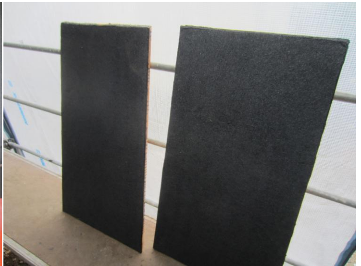
Lemme for og bag beklædt med tjærepap – klar til brug