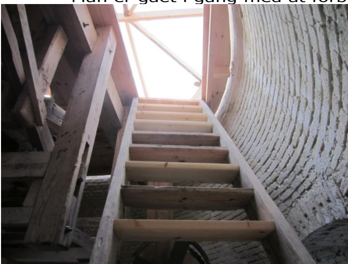
Trappen fra Lorrisloftet op til hatten er repareret – trin udskiftet