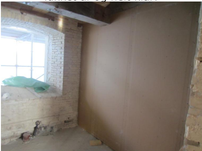
Indvendigt er man gået i gang med en skillevæg mellem toilet og køkken