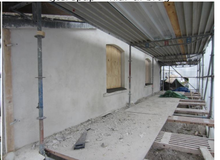
3 af de 4 sider er færdigpudset