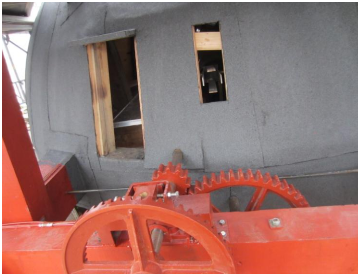
Så ser gear og hat ud til at være klar Nu mangler arbejdet med Vindrosen