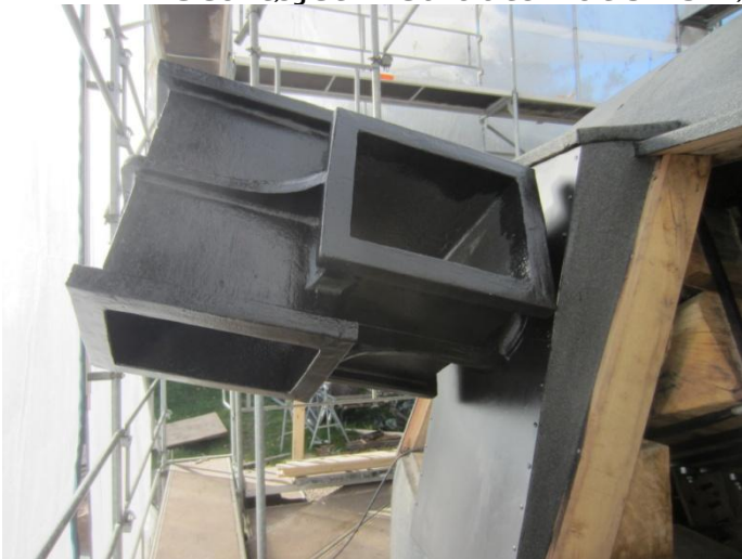
Foran er nu, bortset fra de to lemme, lukket af og helt klar.