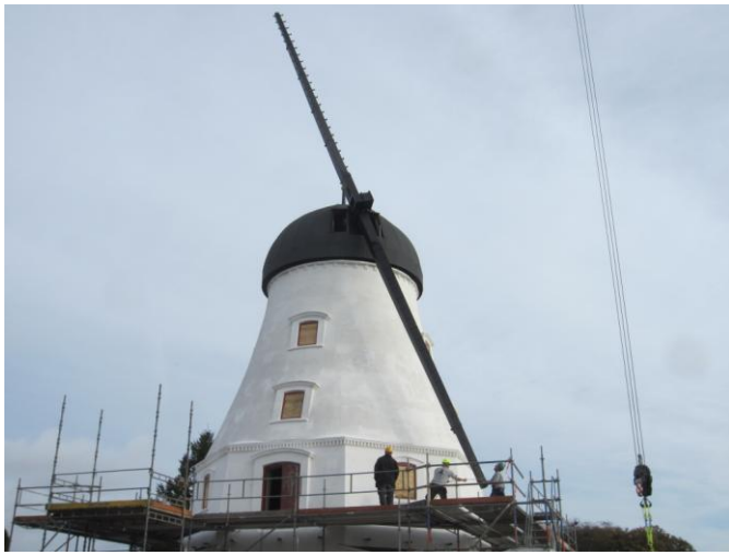
1. vinge drejes 90 grader