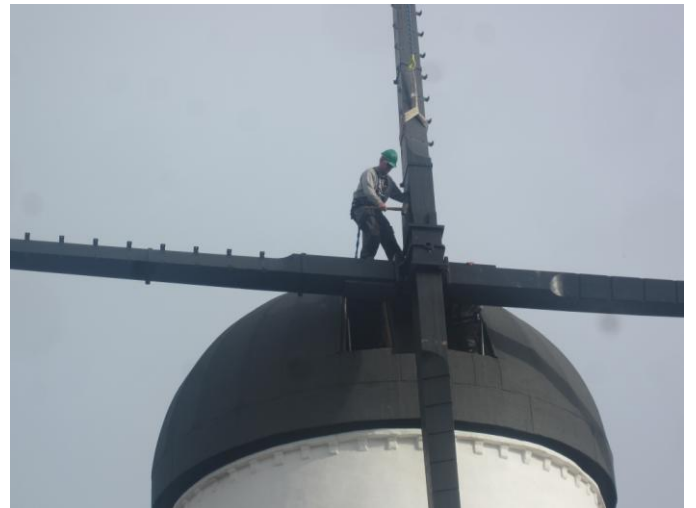
Så skulle den være der