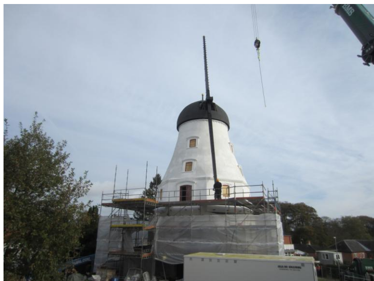
Kranen gør klar til 2. vinge