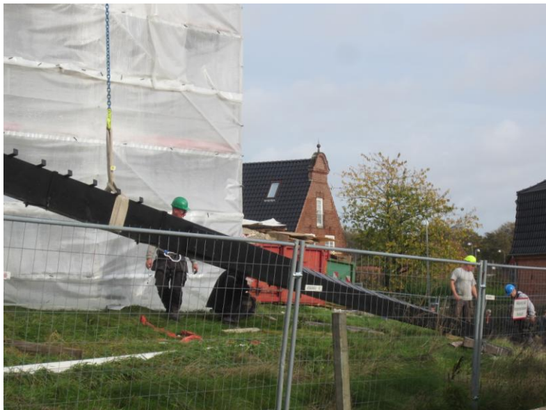
Så har kranen fat i 2. vinge