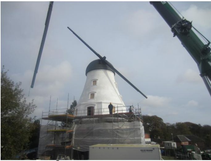
På vej gennem luften