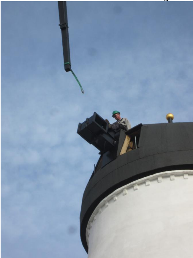
De to møllebyggere i Hatten tager imod