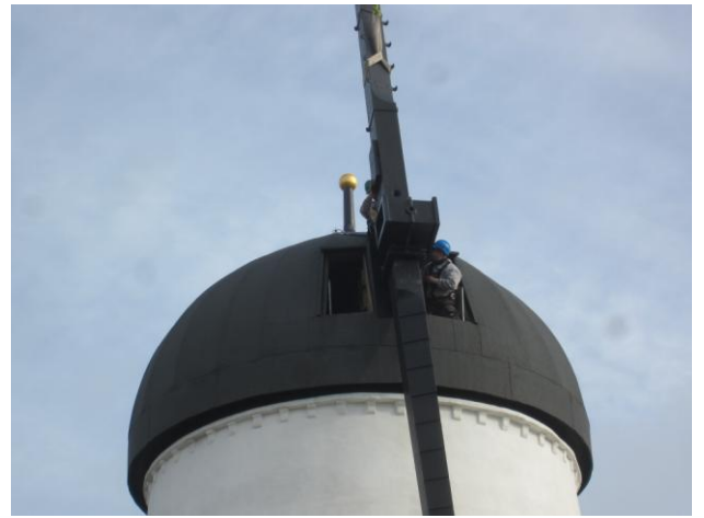
Langsomt fires den ned gennem øjet