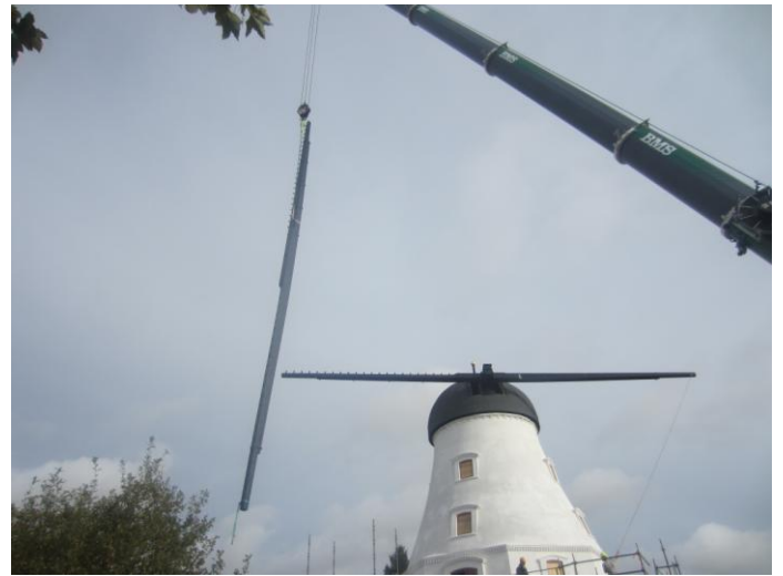
Den 1. vinge ligger vandret