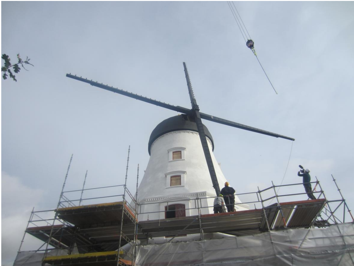
Kranen løsner sit greb og deres job er færdigt.