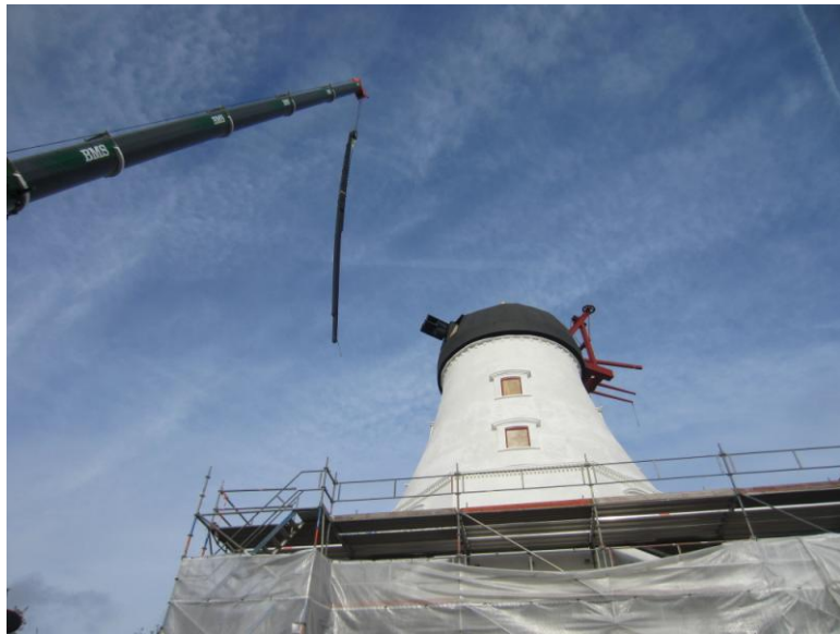
Langsomt nærmer den sig