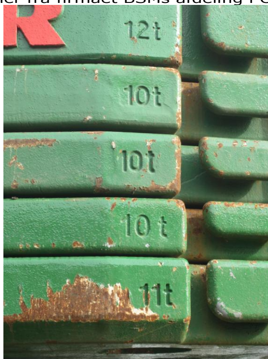
53 tons modvægt skulle der til jobbet med Hatten og Vingerne Nu kunne de så pilles af Kranen igen – Jobbet var slut !

De næste dage skal der så sættes Vingeklapper på de 4 vinger og hatten gøres færdig