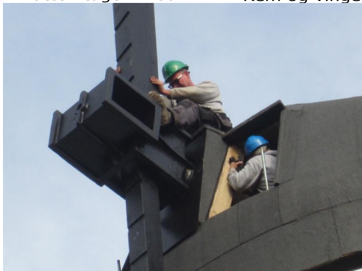
Vejret artede sig Det var en mild efterårsdag næsten uden vind