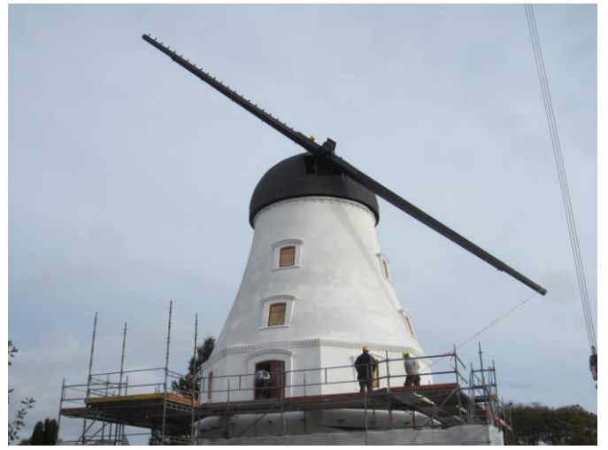
Vingen boltes fast