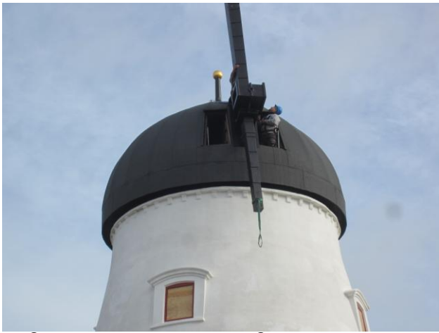
Så er første vinge på vej igennem