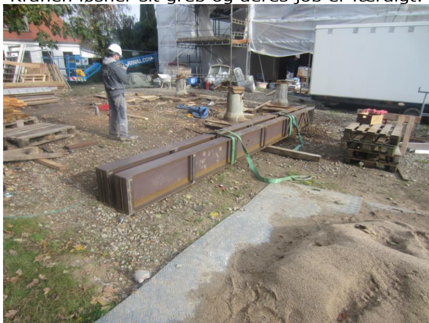
På jorden står den nu på oprydning