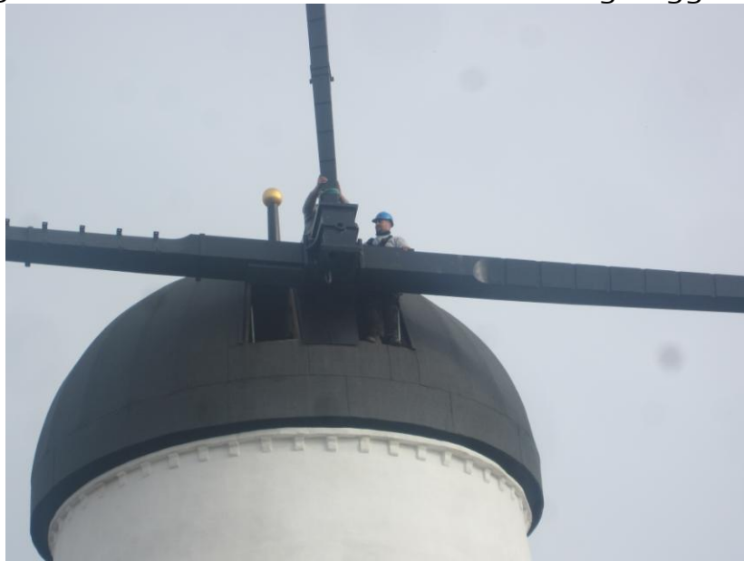
Og anden vinge fires gennem det andet øje.