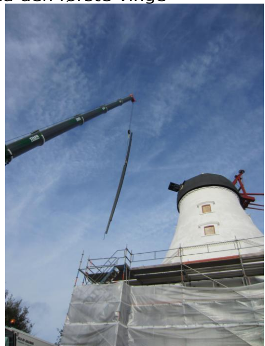
Den 22 m lange vinge ligner en tændstik