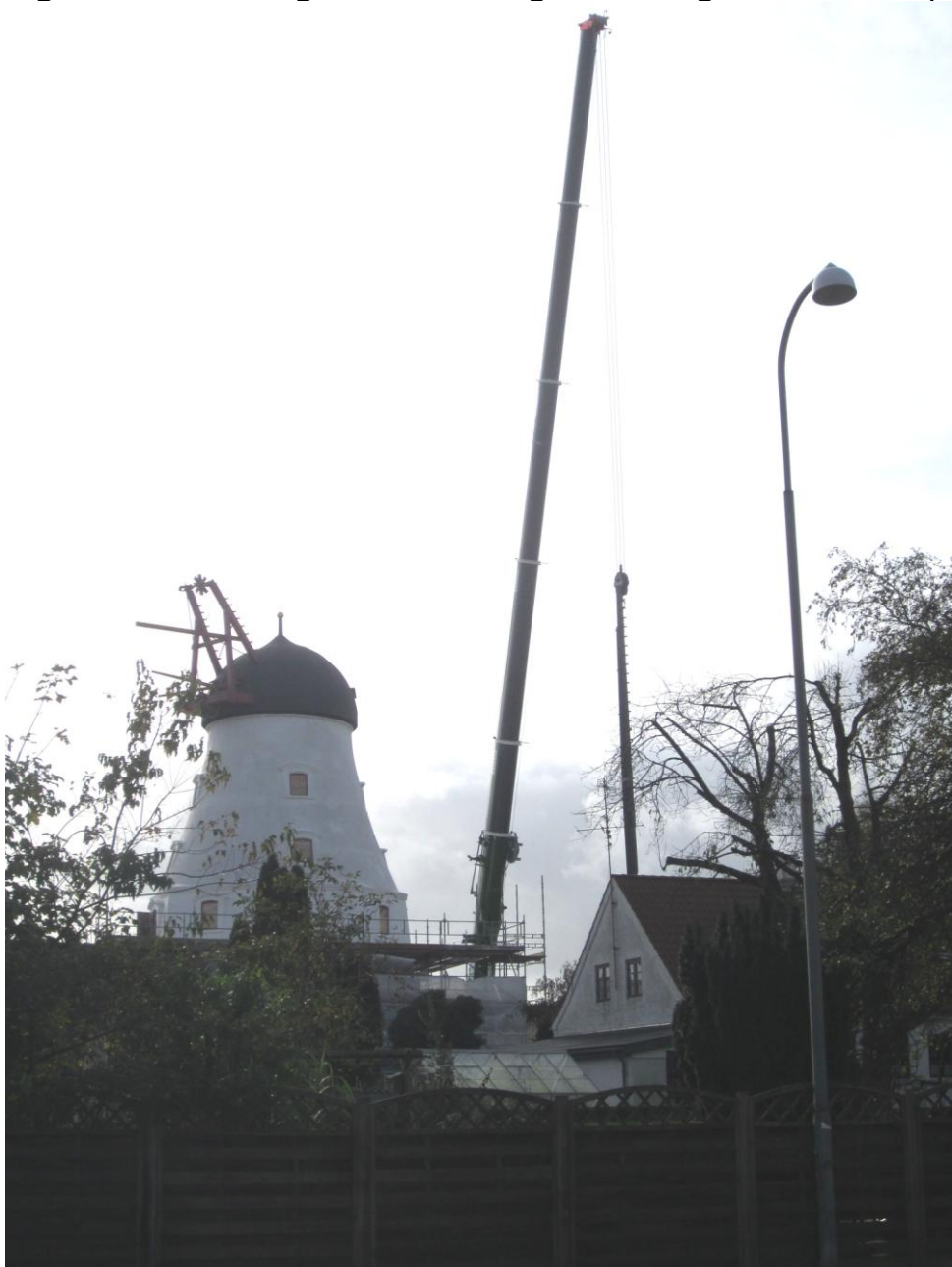
Set fra Mølmarksvej Kranen med den første vinge

Uge 43 – Torsdag Over middag blev vingerne løftet op