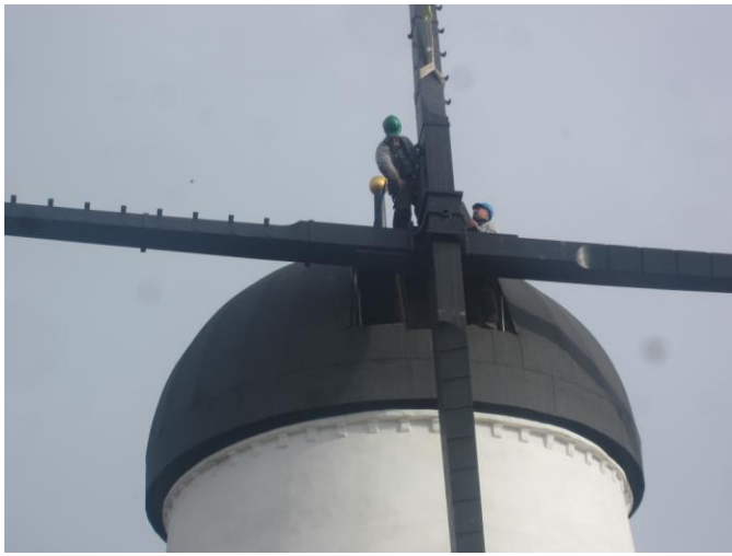
2. vinge fastgøres med klodser