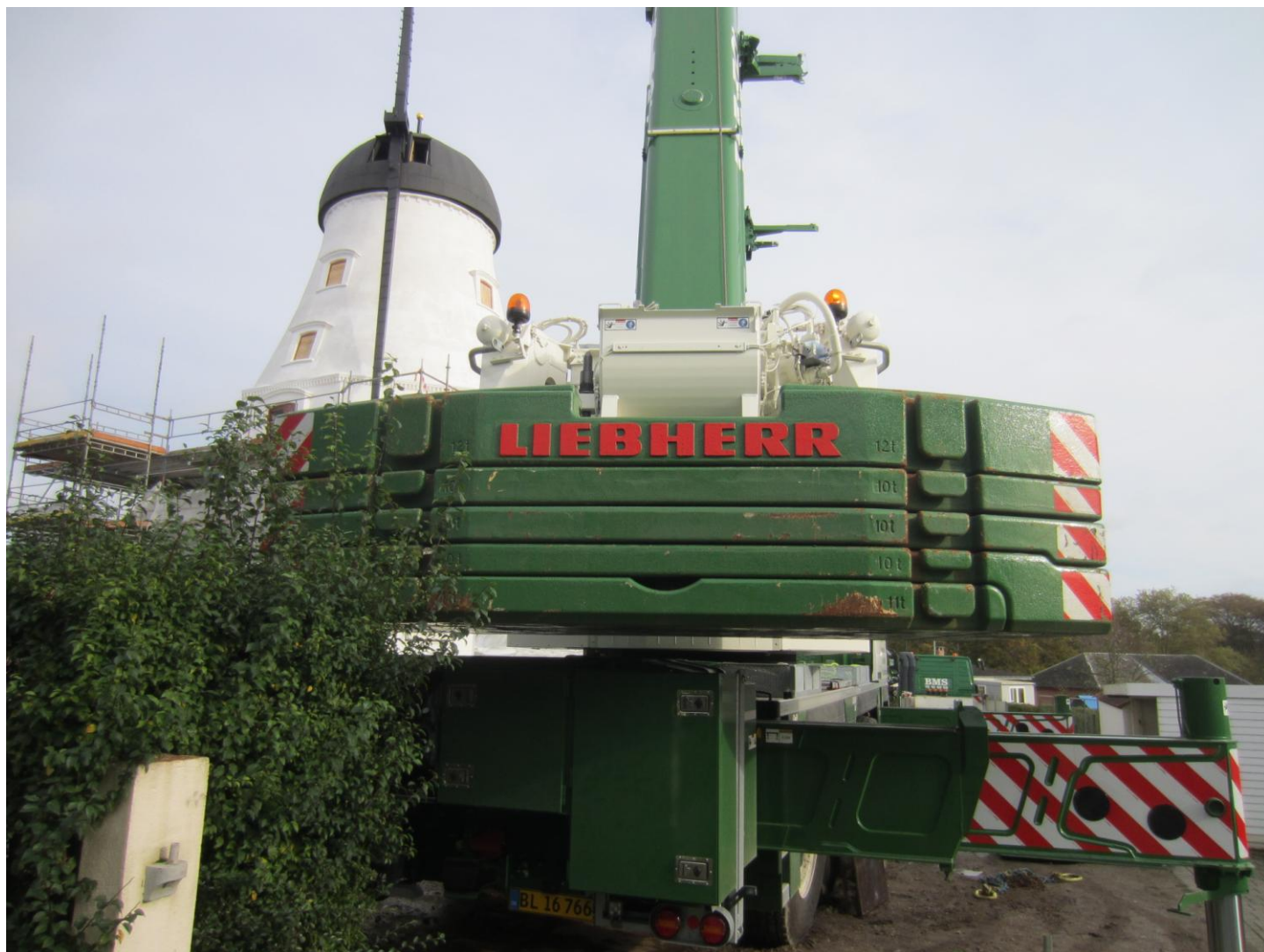
Her bagsmækken af kranen Danmarks 2. højeste Kommer fra firmaet BSMs afdeling i Odense