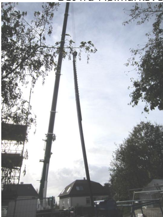
Stille og roligt gik det