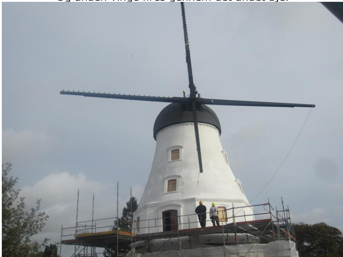
Man passer på ikke at vingen får stød undervejs