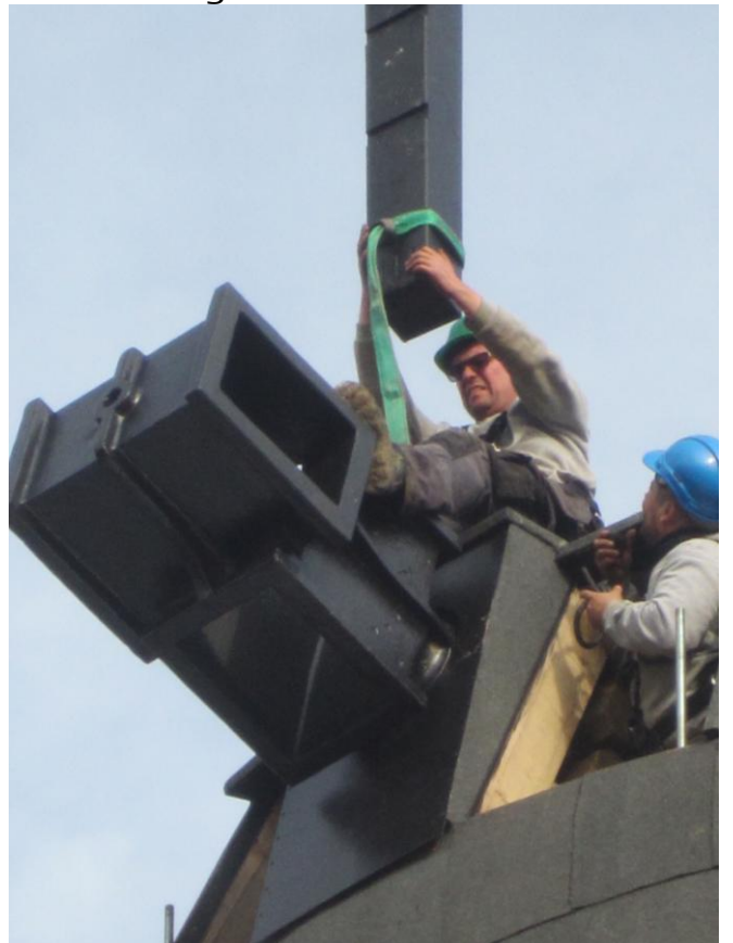
Rem og vinge fires langsomt