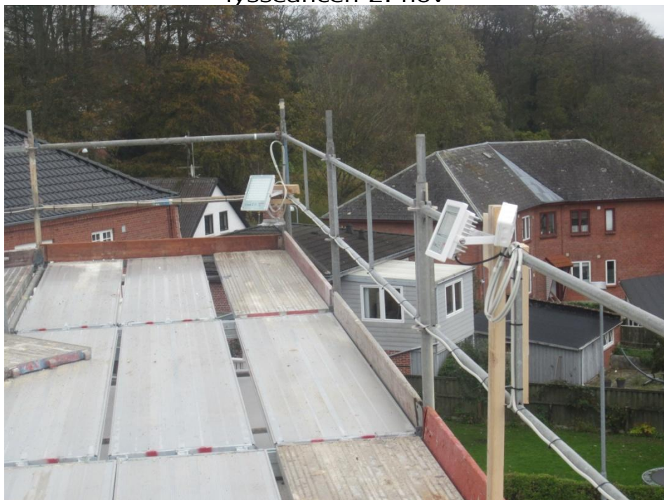
I den anledning er rigget lys til - så hele overmøllen med hat/vinger bliver belyst