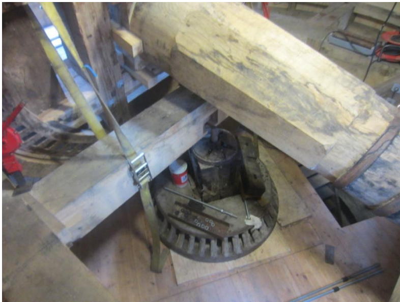
Set ovenfra. - på Gulvet er Kronhjulet sænket ned