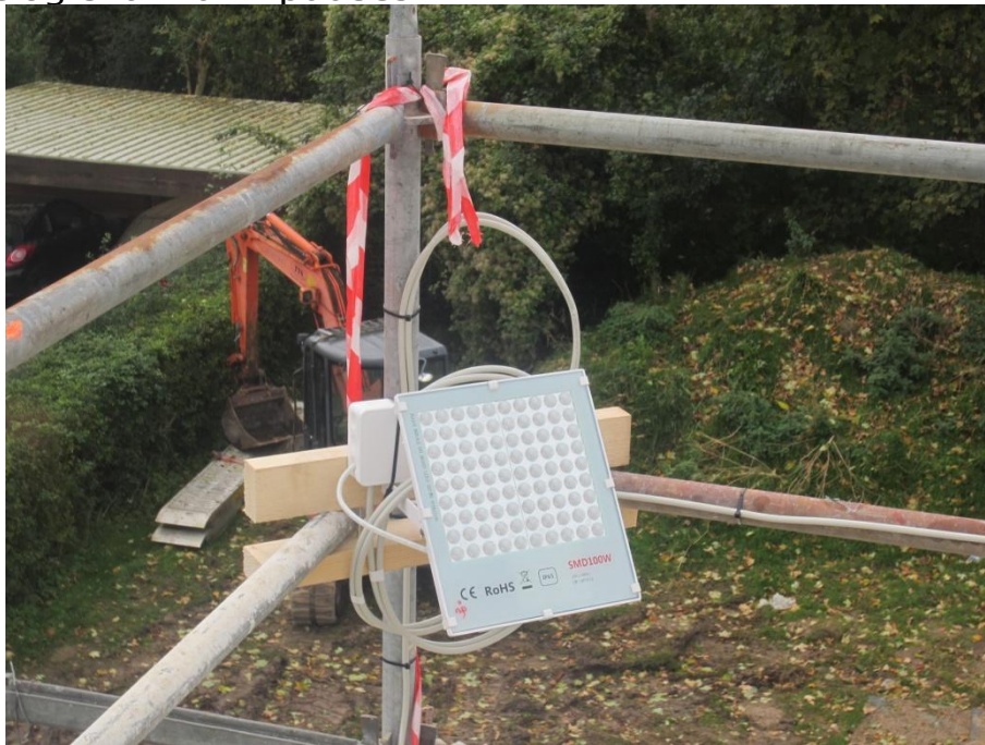
NEJ, dette er ikke møllens endelige lys. Dette skal bruges i forbindelse med lysseancen 2. nov