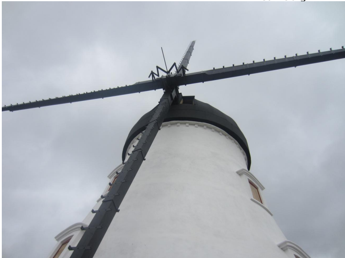
På torsdag/fredag vil de første klapper komme op. De 3 øverste og den nederste, på hver vinge inden styrelisten monteres og så følger resten først i næste uge.