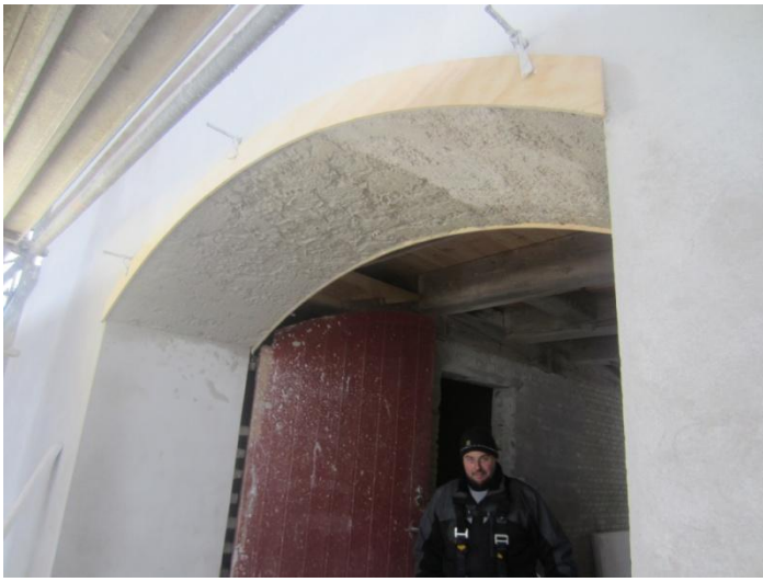
De to buer over mølleporten er grovpudset og skal nu finpudses