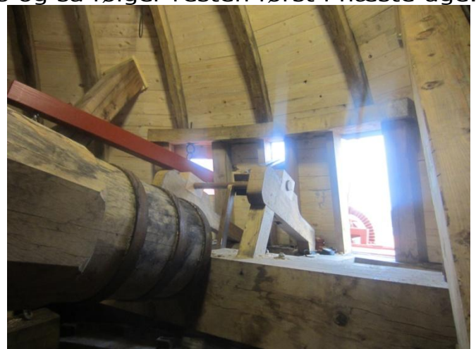
Bagenden med alt styrtøjet til klapperne og bremsen ("Persen")