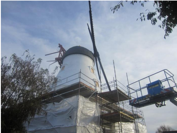
Nu er der kommet beslag til klapperne -