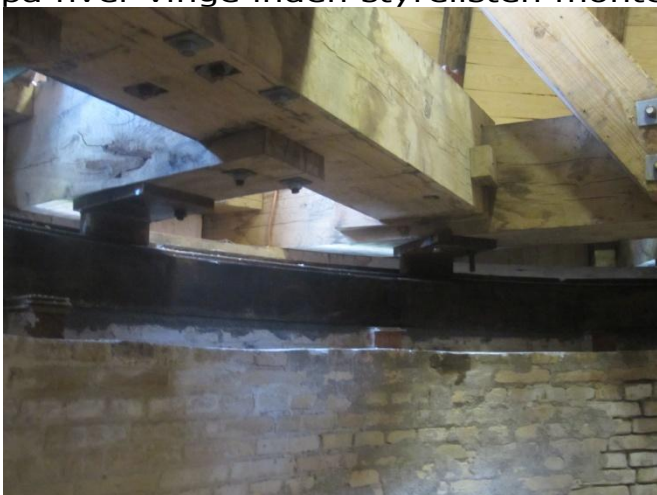
20 tons tung hat m/vinger på plads. Hattens Krøjekrans hviler på møllens