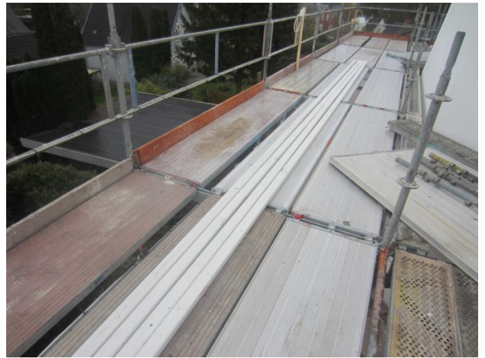
En lang hvid styreliste monteres på hver vinge så klapperne alle reagerer samtidig