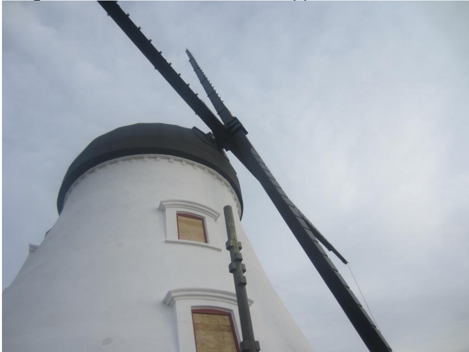
Først kom der vinger på Christiansmøllen

Uge 44 – 31 oktober "Edderkoppen" er monteret