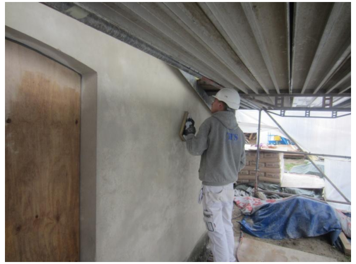
murene finpudses sidste gang