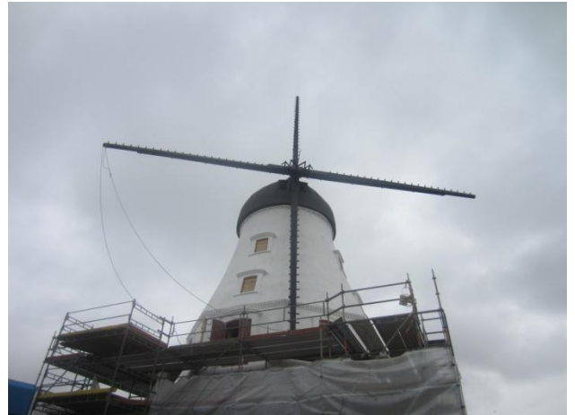
på de 4 vingeender der manglede