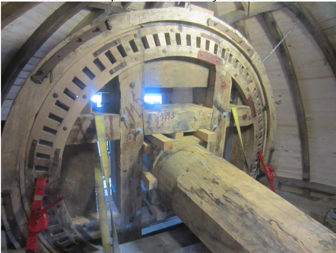
Den store vingeaksel med det store Hathjul er lige nu spændt godt fast