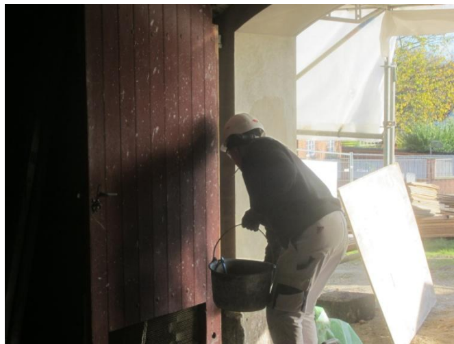
Murerne er i gang med den sidste finpudsning omkring portene