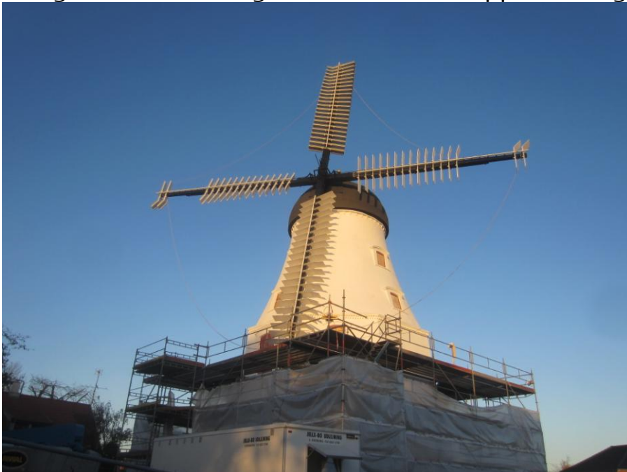
DE ser rigtig godt ud i aftenlyset