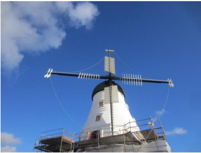
Vægten fordeles ved at vingerne følges