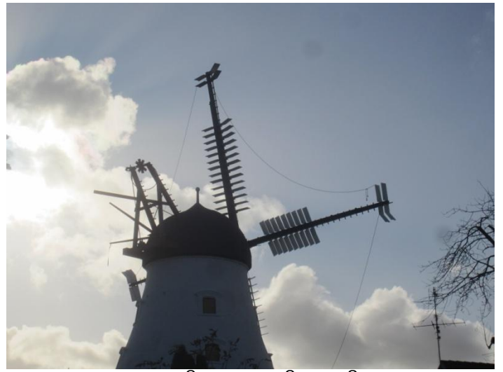
Først 4 på hver så 9 på hver