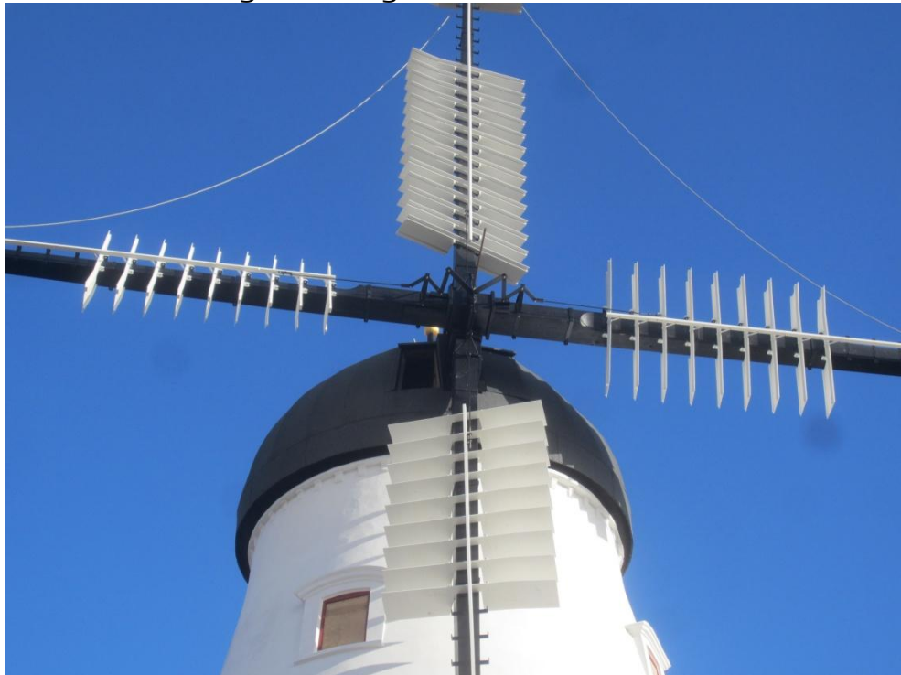
Her ses tydeligt de 4 hvide styreskiner som styrer alle klapperne