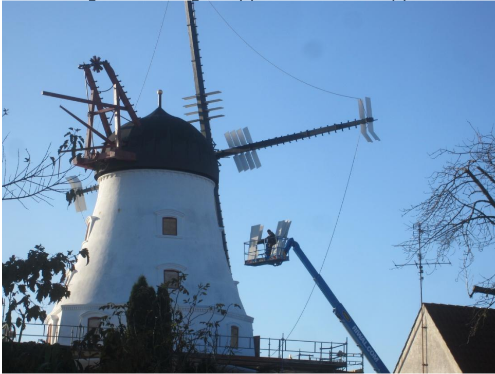
Fra morgenstunden blev der sat klapper på