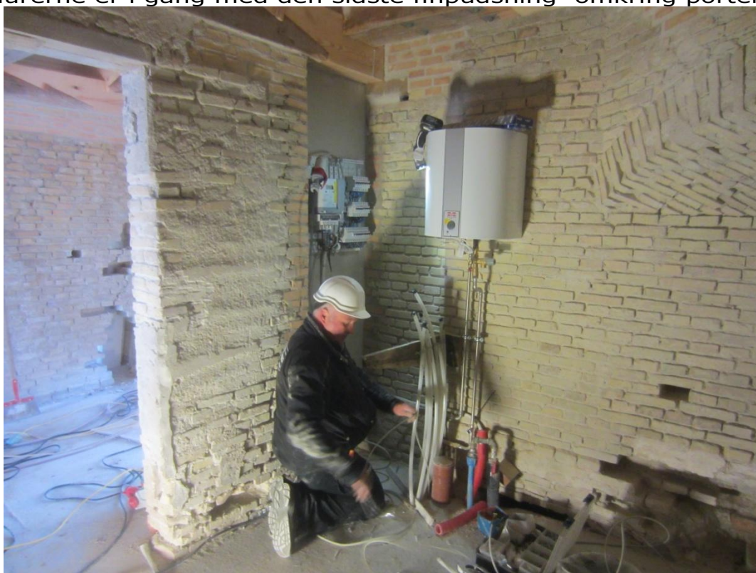
Så er elektrikereren i gang – i første omgang etableres målerskab