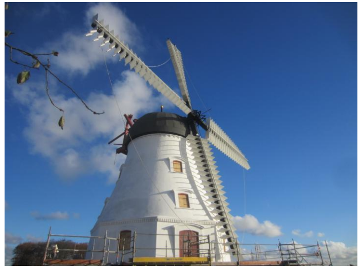
Man siger ikke nej til en tur i liften