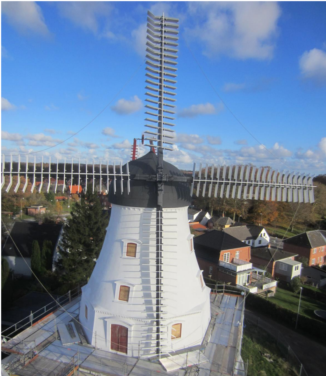
Den grimme ælling er blevet til en smuk svane