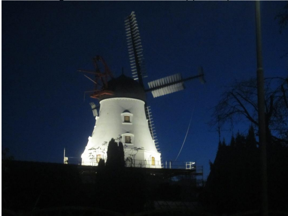
De første 3 billeder er fra i aftes. -