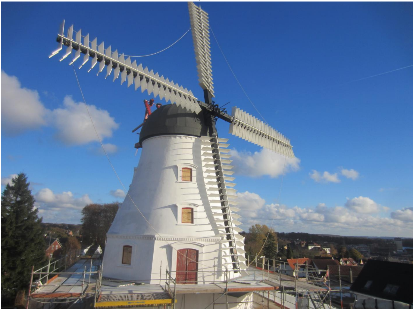
Tak for turen til Møllebyggerne