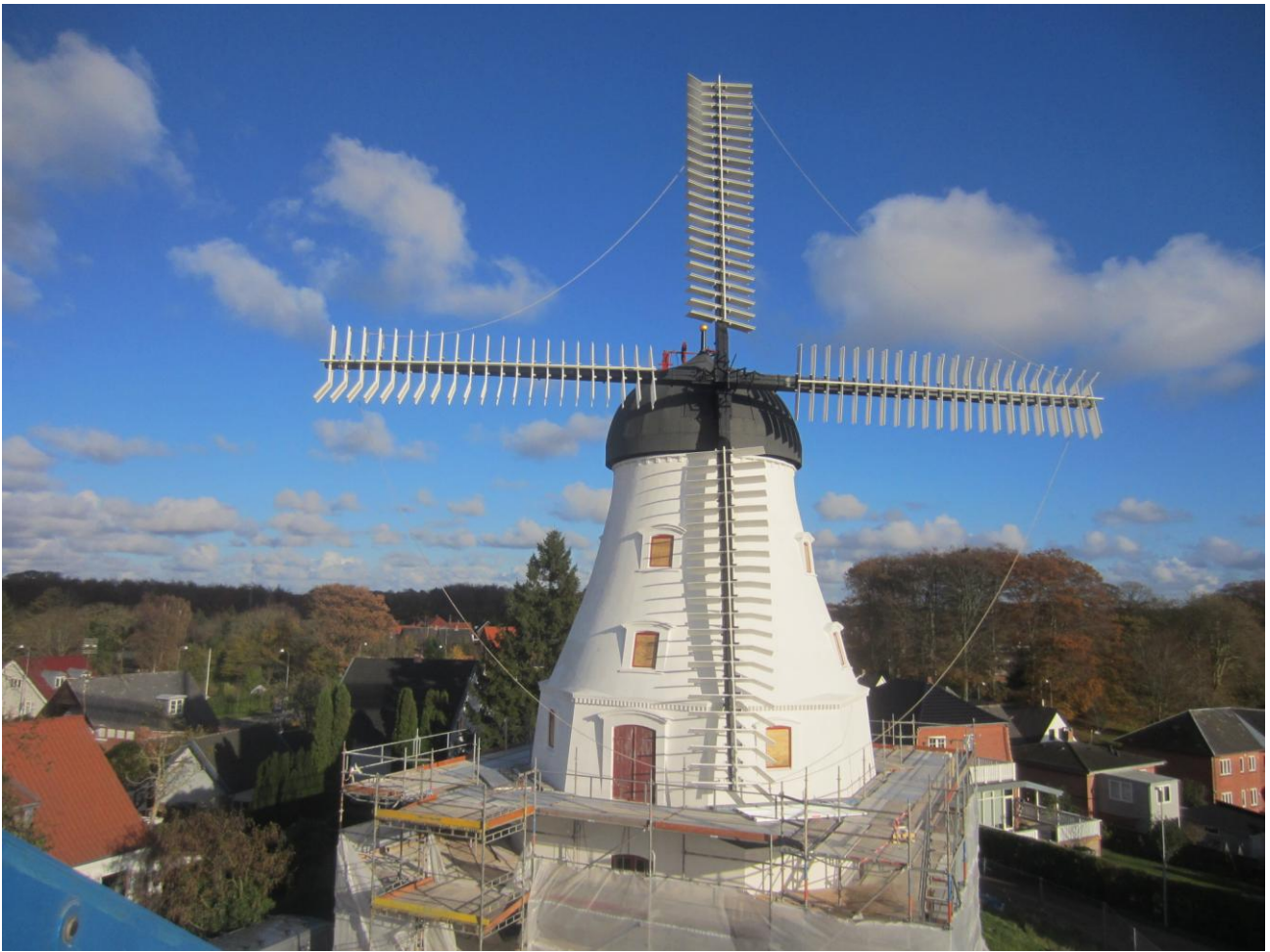
Glæder os til undermøllens stillads forsvinder