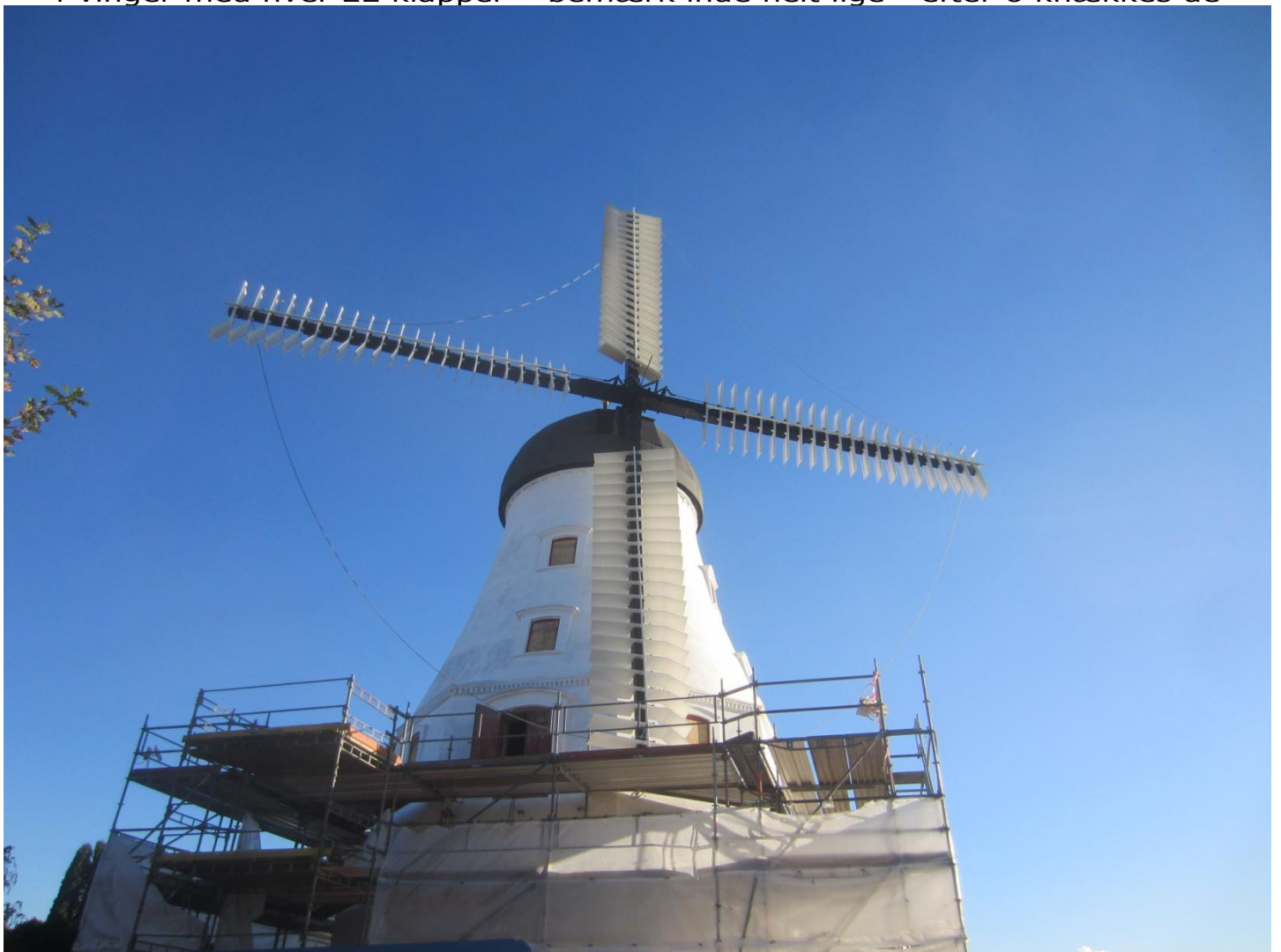
De 88 klapper pynter gevaldigt på de sorte vingearme