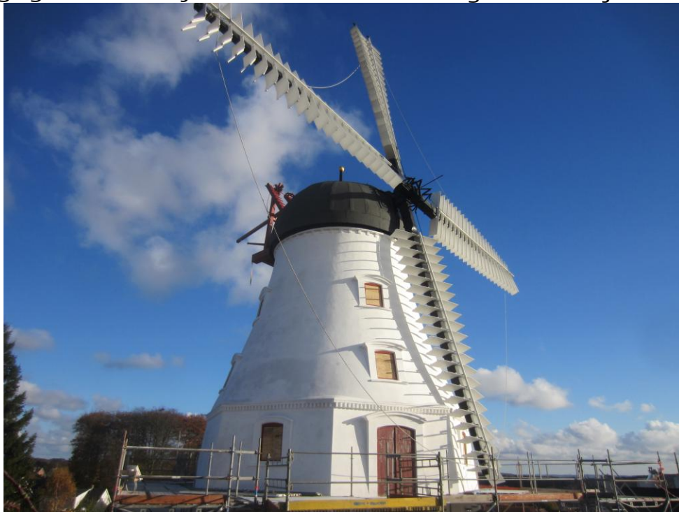
Iført sikkerhedsrej steg vi til vejrs