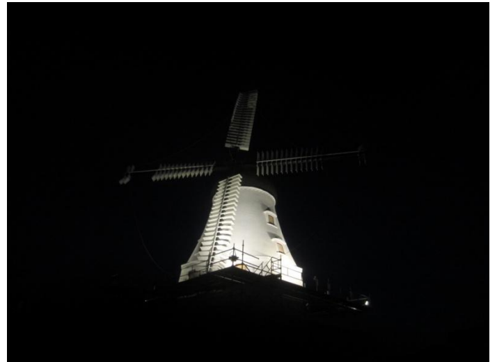
Kanonflot og så mangler der endda lys - på både undermølle og vinger/hat