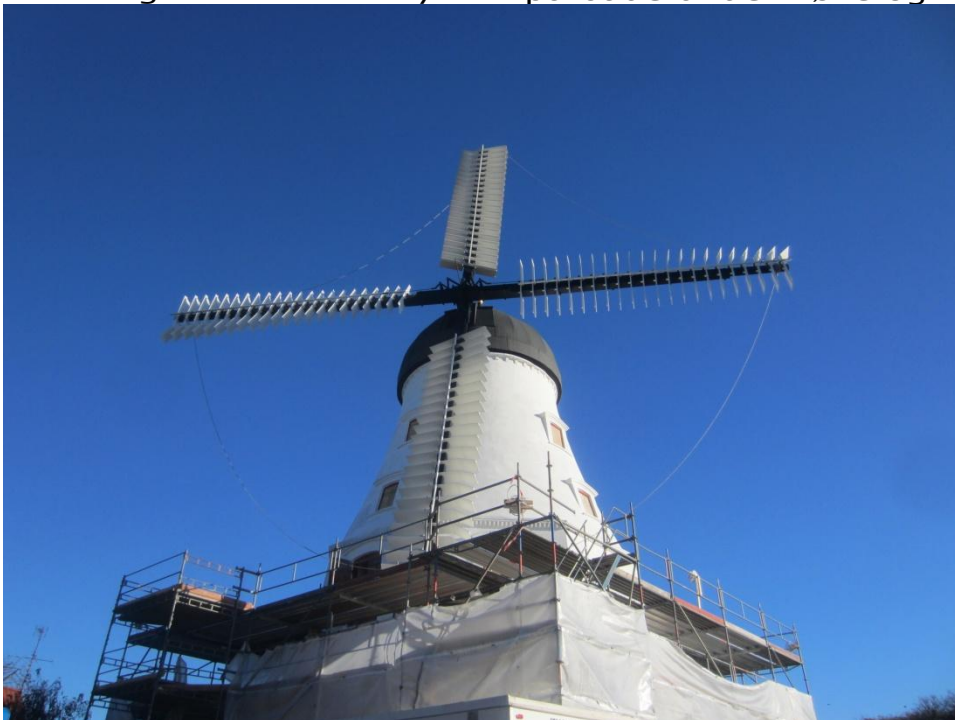
KL 10.00 tirsdag blev møllebyggeren færdig med at sætte klapper på