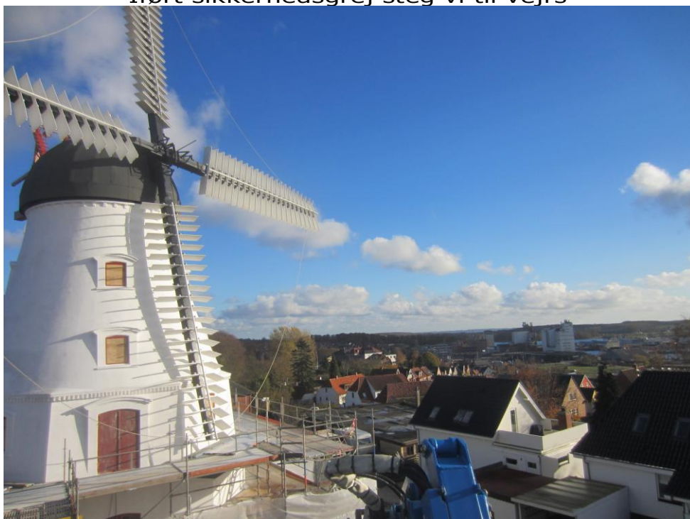
højere og højere op