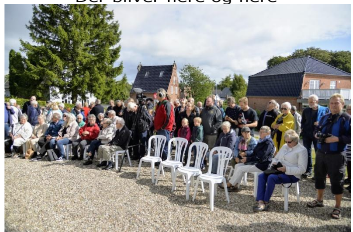
Stole sat frem til de ældste gæster