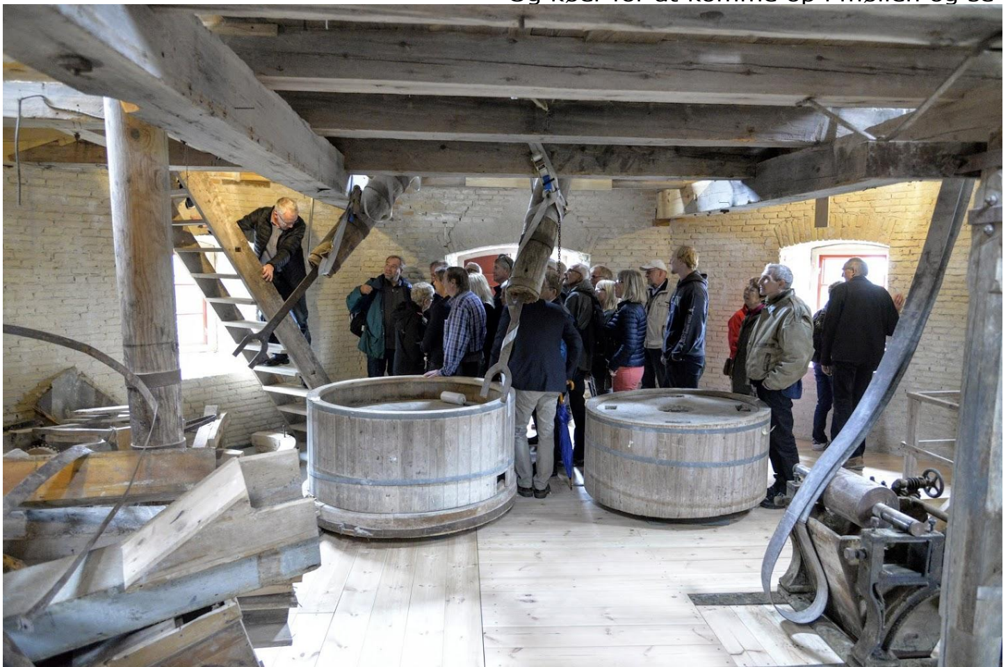
Alle havde mulighed for at komme ud på Svikstillingen . En gruppe står og venter på at komme højere op i møllen