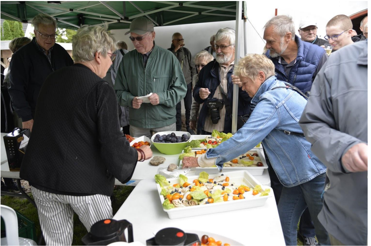
Lykkedes det at holde teltene ved jorden og folk nød pandekager med forsk. fyld og frugtfade fra kommunens kantine