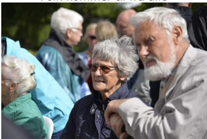
2 af 3 møllebørn fra 2. sidste møller 1924-1946 mødte også op.