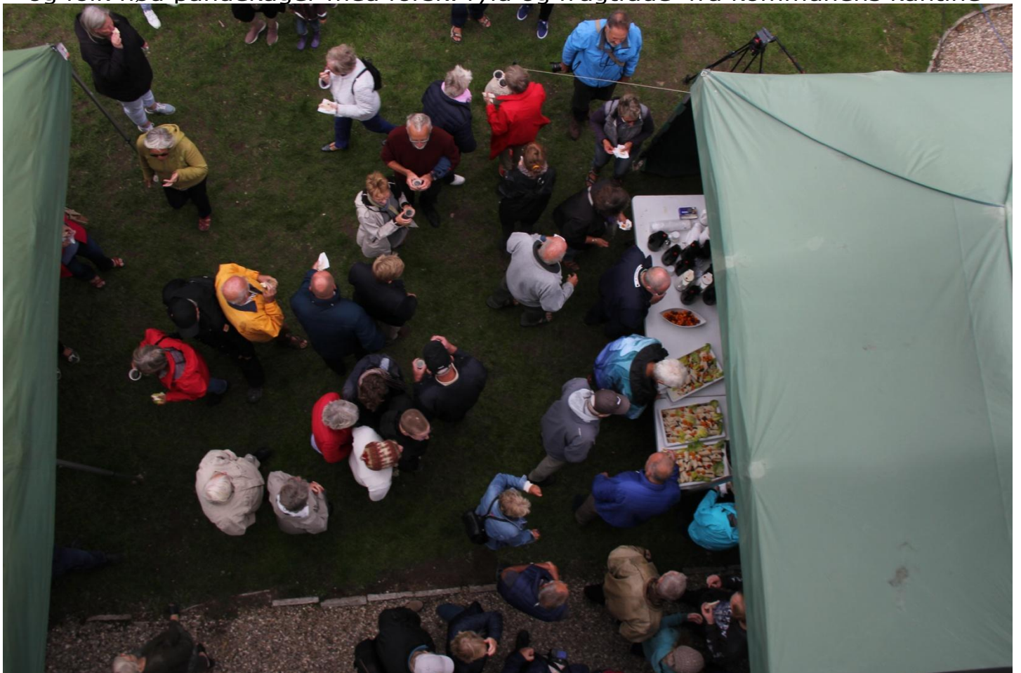
Lauget vil gerne sige tak for den store opbakning til arrangementet. Samlet var omkring 300 forbi i de 3 timer