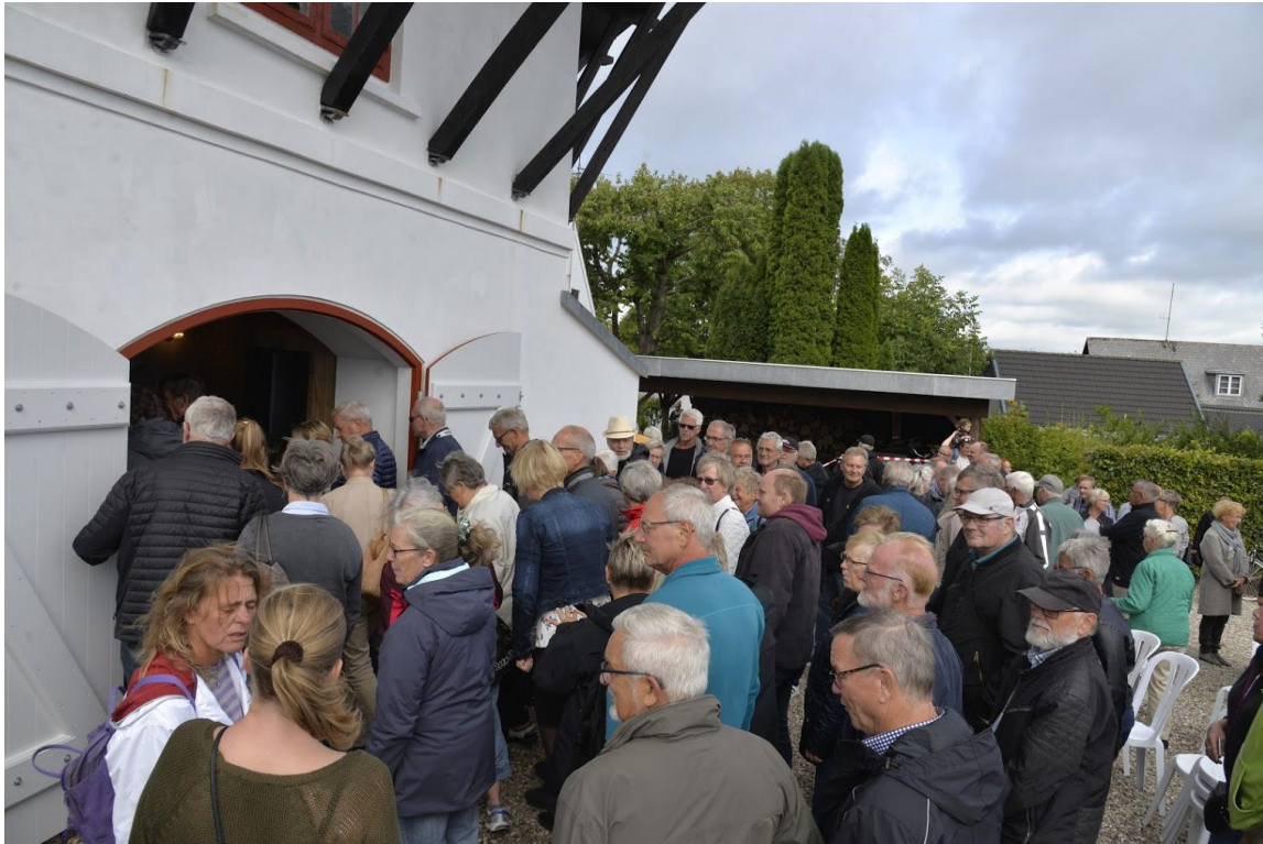
Jo der var trængsel og arrangementet fortsatte til kl 15.00