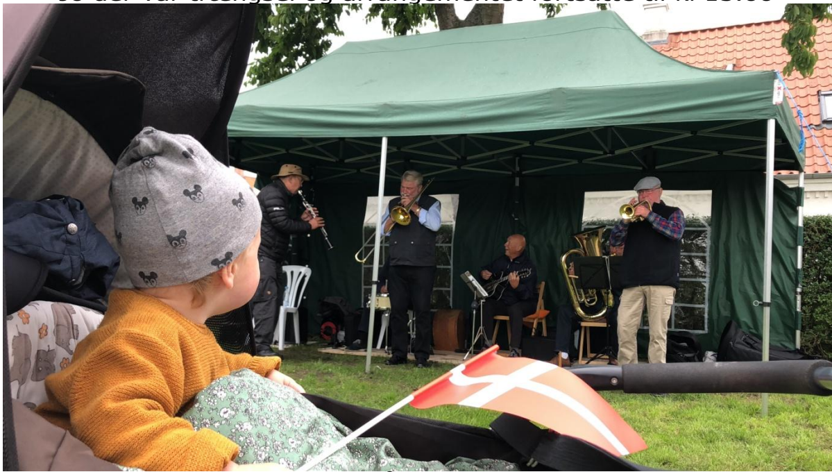
Store som små nød Jazzorkestret