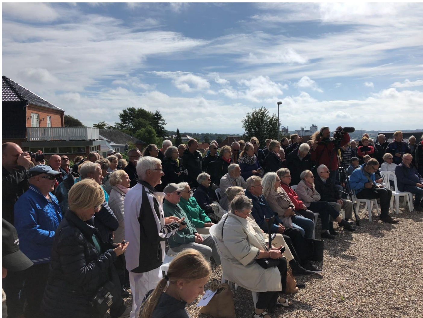
Over 200 mennesker havde fundet vej til åbningen