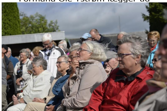
Der lyttes i blæsevejret