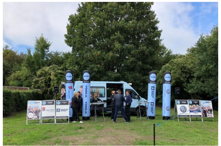
Radio Diablo sendete Live fra møllen