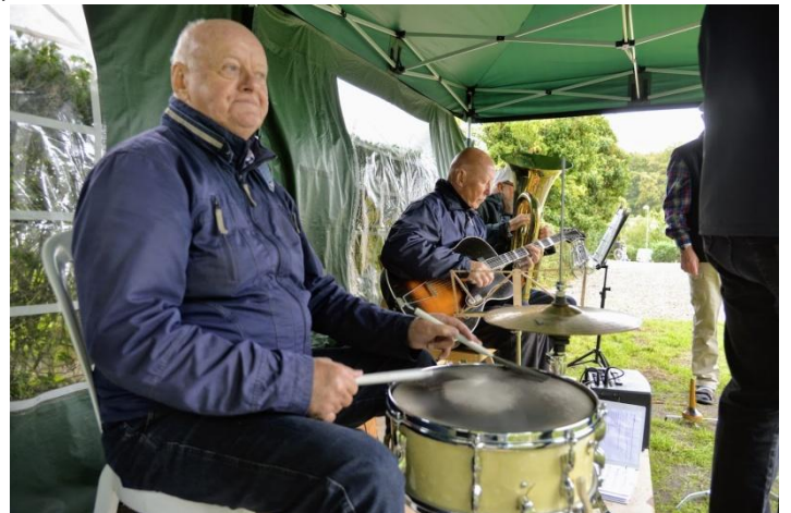
Trods en regnbyge og kraftig blæst