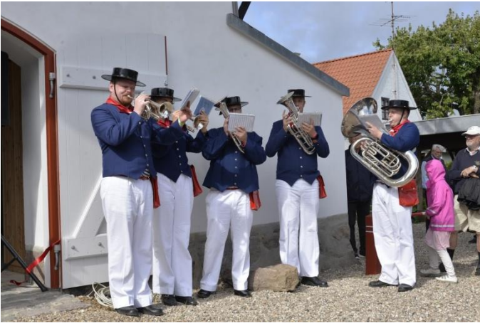
Peder Most Garden blæste fanfare