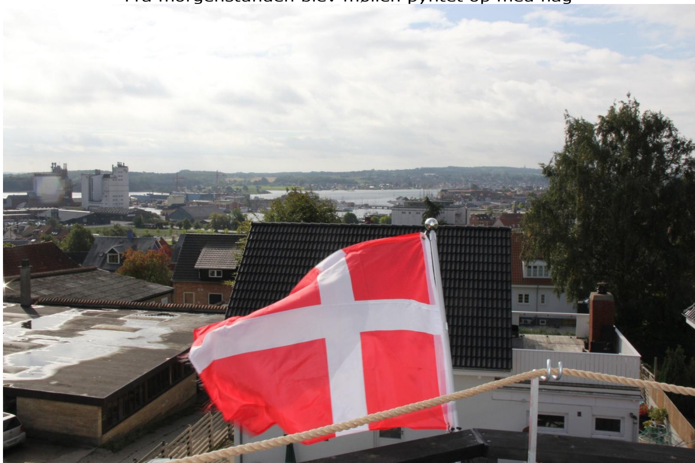
På Svikstillingen vajede 8 flag fra ottekantes spidser