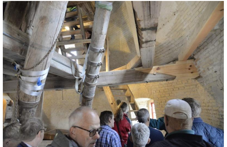
Og kører for at komme op i møllen og se