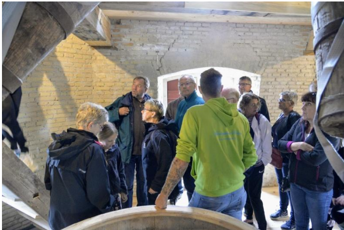
Resten af dagen var der trængsel