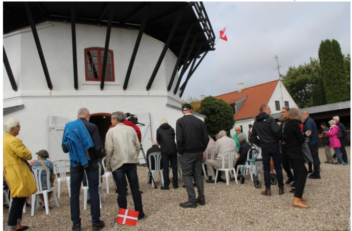
De første gæster vil have en god plads.