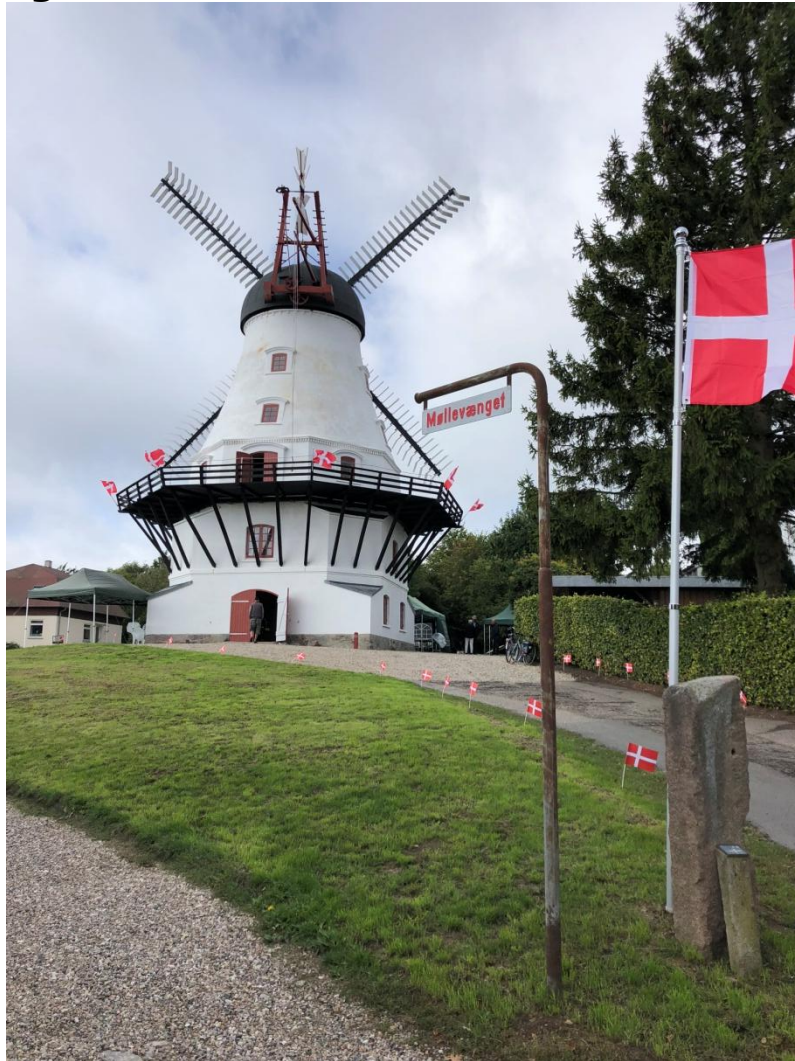
Fra morgenstunden blev møllen pyntet op med flag