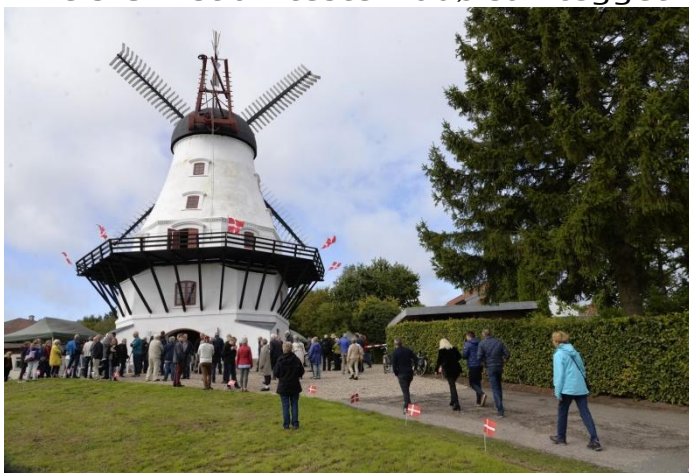
Folk kommer til fra alle