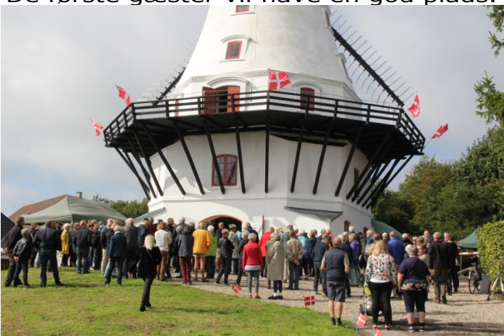
Der bliver flere og flere