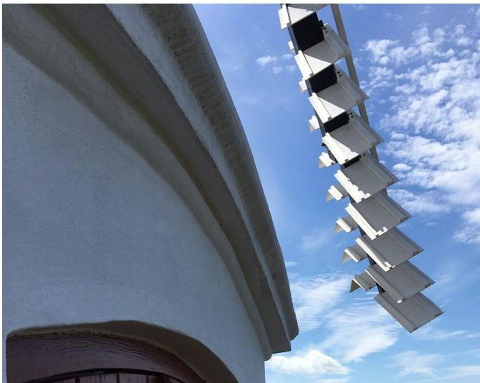
Vejret holdt og der var åbent i cafeen hele dagen