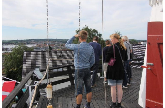
På svikstillingen var en lind strøm af besøgende.