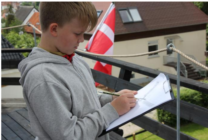
Nogle prøvede at tegne møllen og måtte op og se nærmere på dem inden stregerne blev slået.