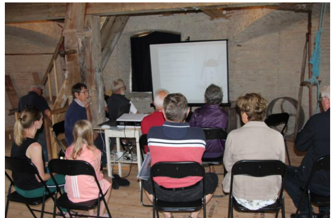
På broloftet blev der vist billeder fra renoveringen og fortalt om møllen.