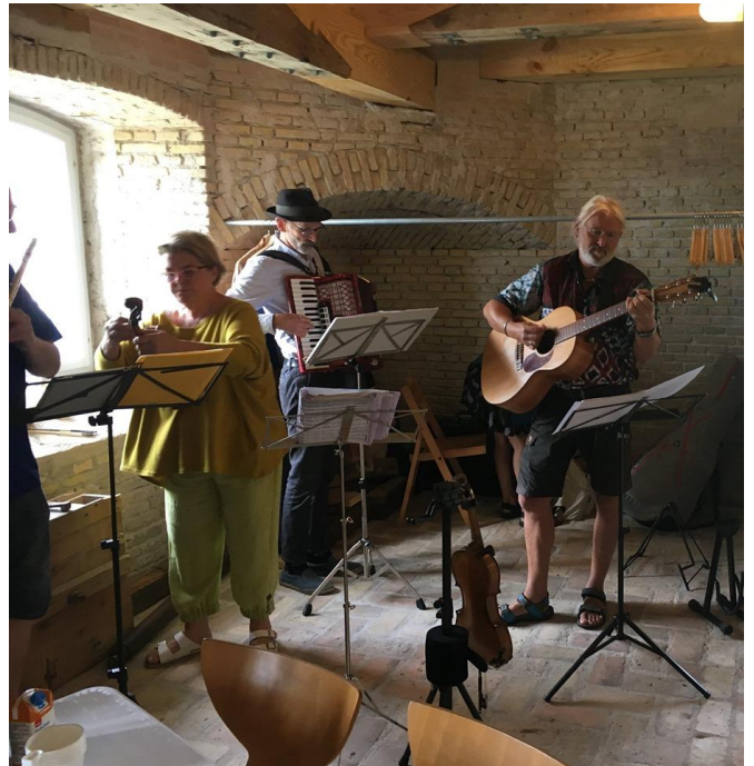
Dagen igennem underholdt Mollevit