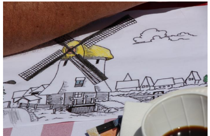
Til de mindre børn var der mølletegninger som skulle farvelægges med farveblyanter.