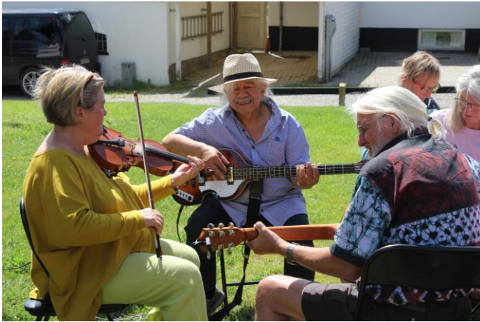
Folkemusikbandet Mollevit spillede fynsk folkemusik