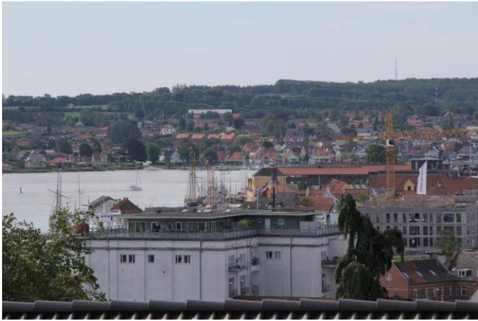
Lidt af udsigten fra svikstillingen