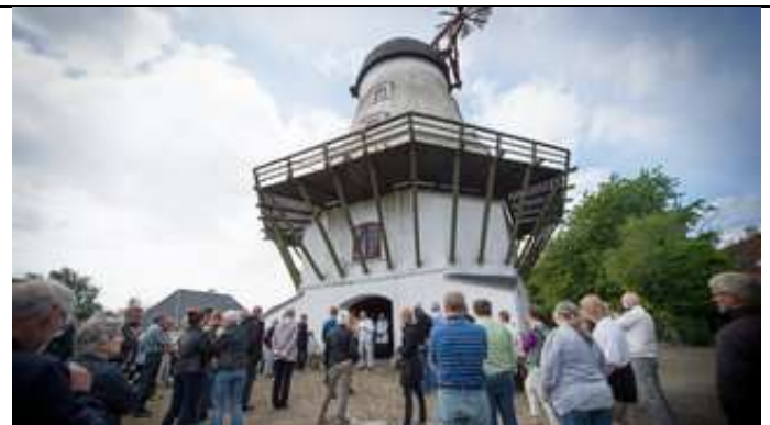
Åben Mølle 2015