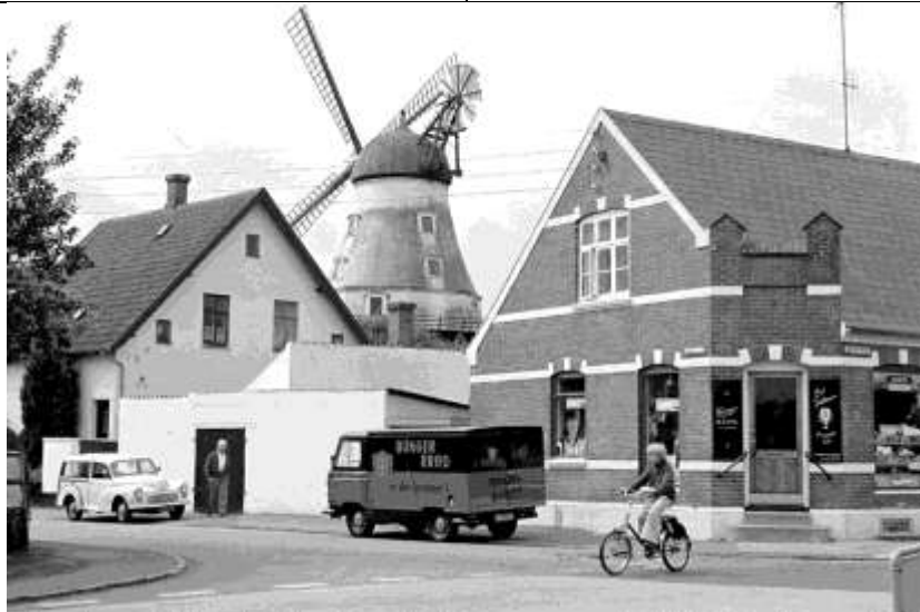
1975 Hjørnet af Porthusvej og Mølmarksvej