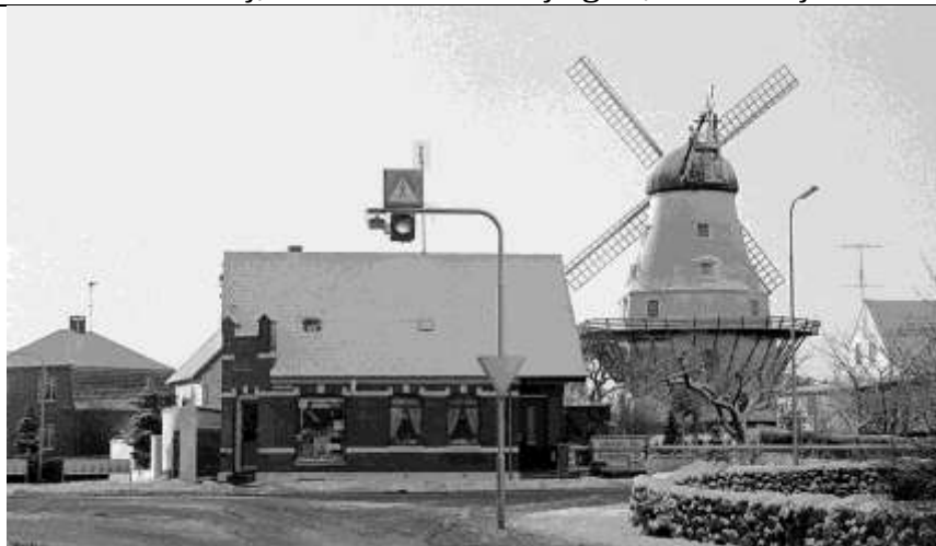
1975 Hjørnet af Porthusvej og Mølmarksvej