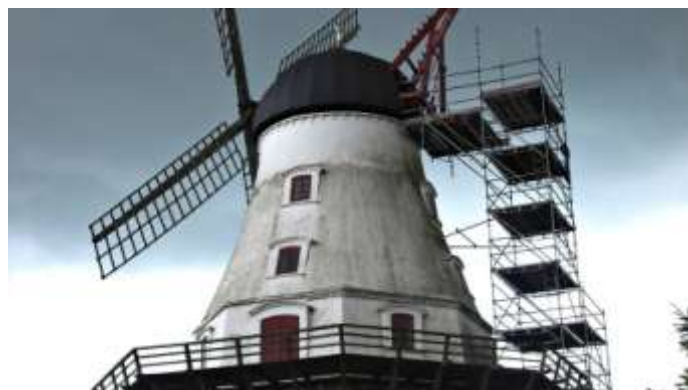
I 2008 blev der rejst et stillads op til hatten efter orkanen