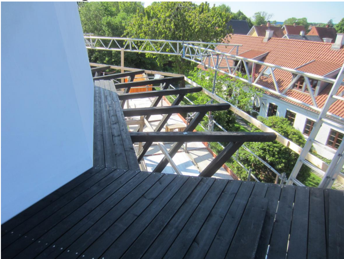
tirsdag var de allerede godt i gang mod øst