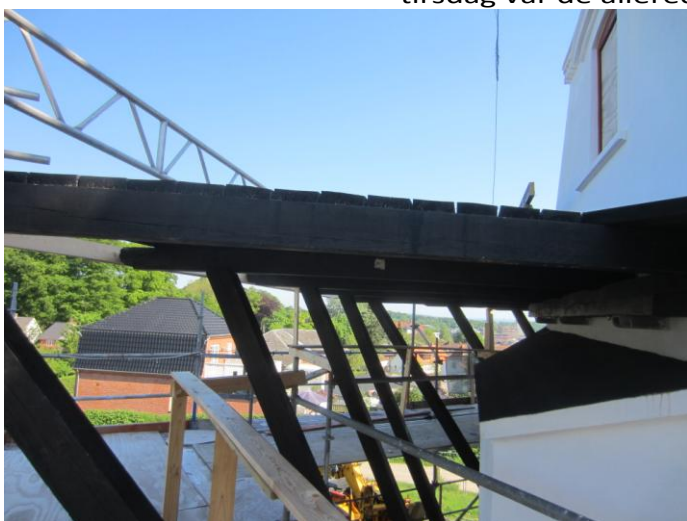
Et meget solidt og flot plankegulv