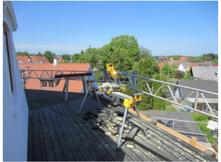
Det flotte vejr fotsætter i dag torsdag sidste felt