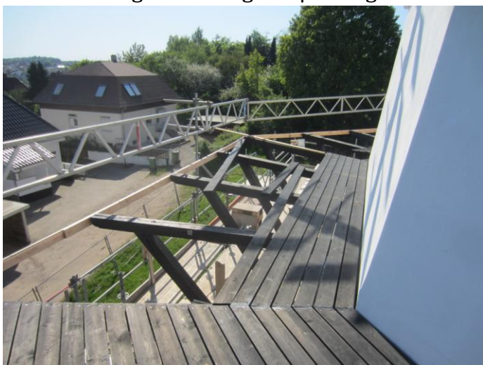
Sidste uge var jo på 4 dage p.gr. af Pinsen