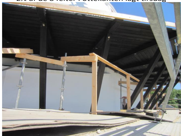
Fra tirsdag fortsatte arbejdet efter Pinse