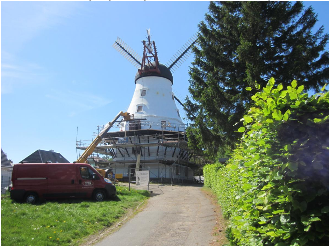
Håndværkerne fra TTS bliver færdige med gulvet og kommer i gang med Rækværket - og så er de tilbage på tirsdag efter Pinse.