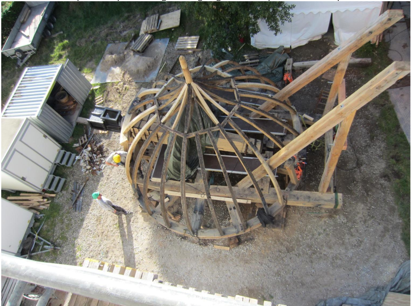
Møllehatten færdiggøres på arbejdspladsen og Møllebyggerne er i gang.