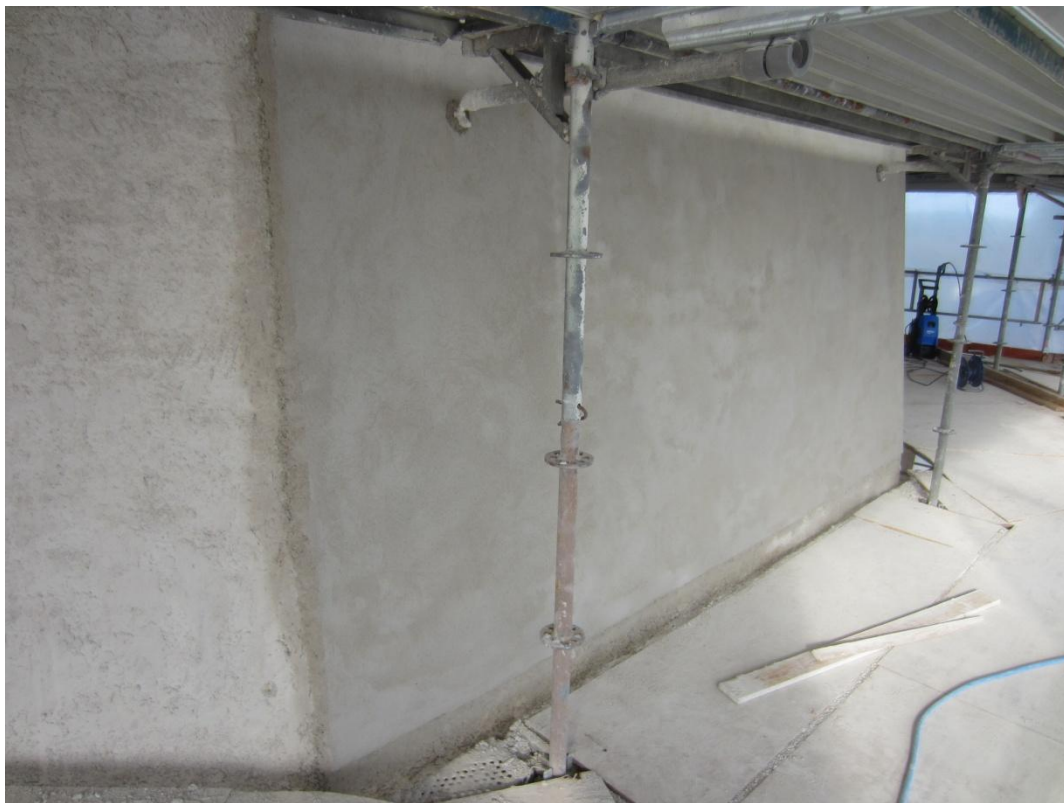
En af de store flader som er færdigpudset

Andre er i gang med at restaurere et par nye trappesider ved bla at skifte træ ud