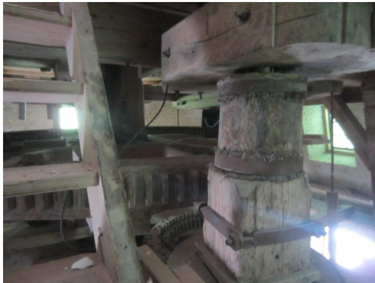
Via trappe forbi det store vandrette Stjernehjul på Stjernehjulsoftet + til højre en udveksling