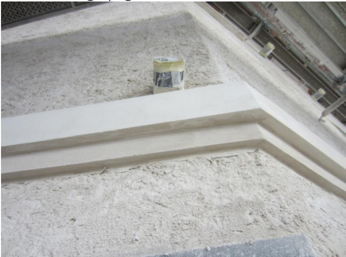
En flot kantfrise under beslagene til Svikstillingen