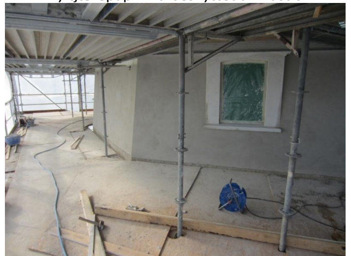
Kværnloftet er godt i gang med finpudsningen