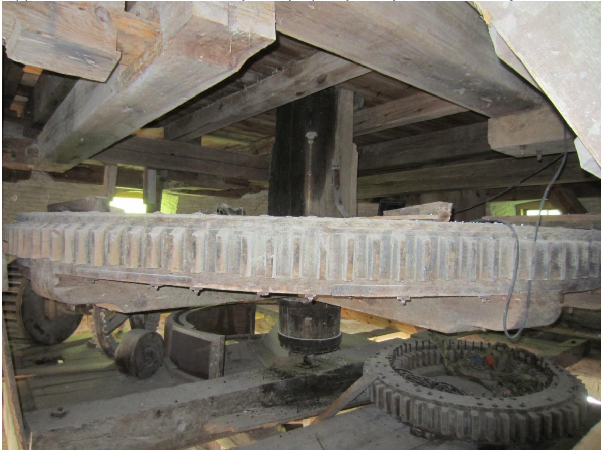
Stjernehjulsoftet hvor Kongesvellen ender i et søle lige under Stjernehjulet