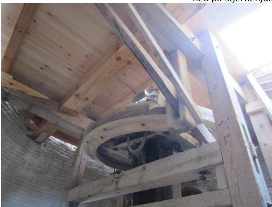
Den store Kongevelle/ som vingerne trækker rundt går ned gennem Hejseløftet og giver kraften hjulet der trækker diverse hejse