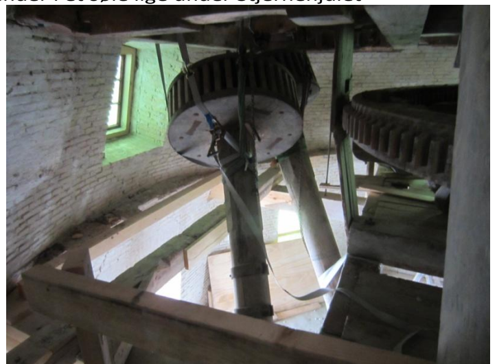
På stjernehjulsoftet skal de 3 drev, som lige nu af arbejdshensyn er trukket godt op og dette forhindrer at hele gulvet kan laves.