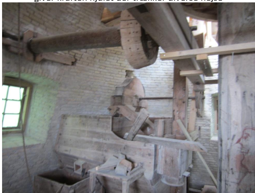
Den ene af hejsene som trækker kornsækkene helt nede fra Portrummet op til Kværnloftet