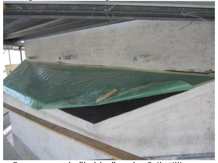
De reparerede "hylder" under Svikstillingen Ny tjærepap – nu beskyttet af Plastic