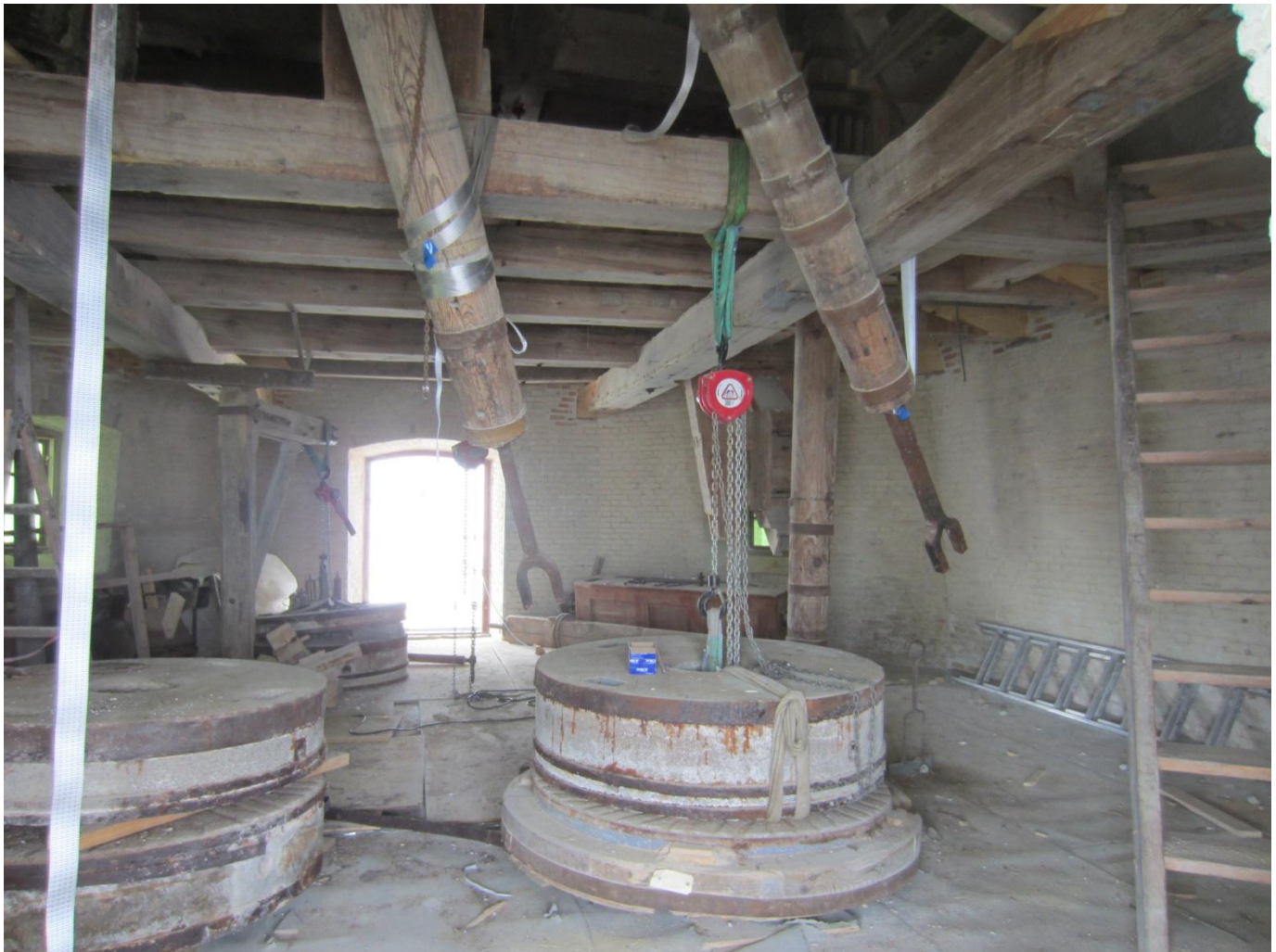
De skal på et tidspunkt svinges tilbage og monteres på de 3 kværne på Kværnloftet.