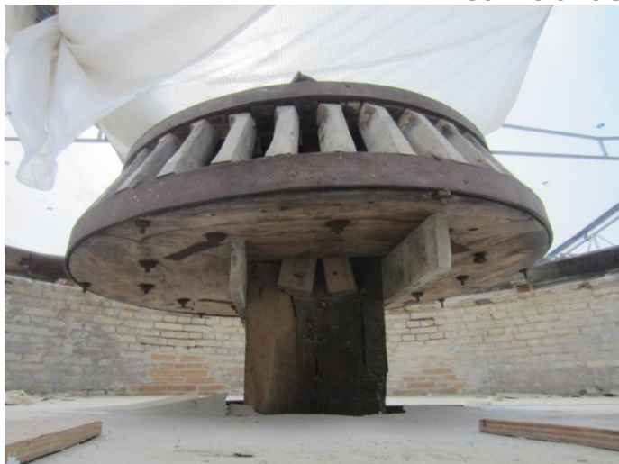
Øverst oppe Kronhjulet på det lave Hatloft