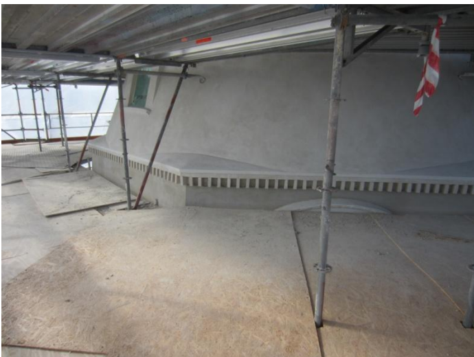
Hele overmøllen er færdigpudset. Som det ses her nederst er de nu gået i gang med Undermøllen