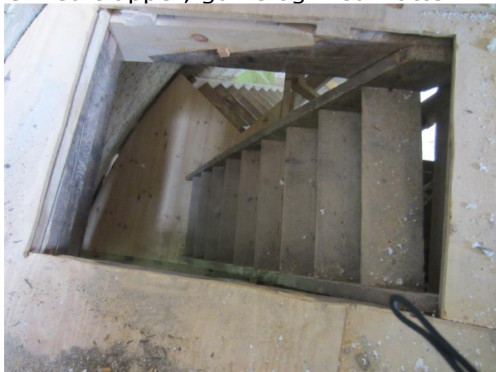
Med trappe ned til Lorrisloftet lige under og videre ned på Stjernehjulsløftet